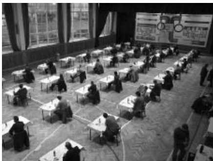
Degustace – hodnocení vín 15. 3. 2008