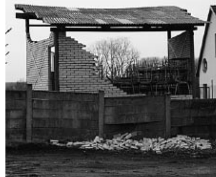
Ema na stadionu