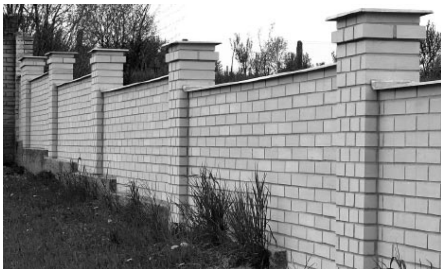
Zídka na hřbitově po opravě