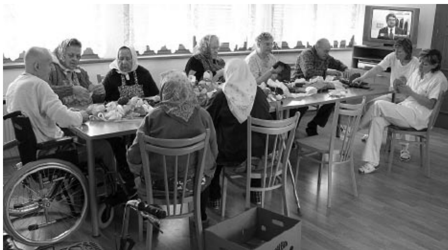
Do zhotovení růží na Jízdu králů se zapojili klienti i personál