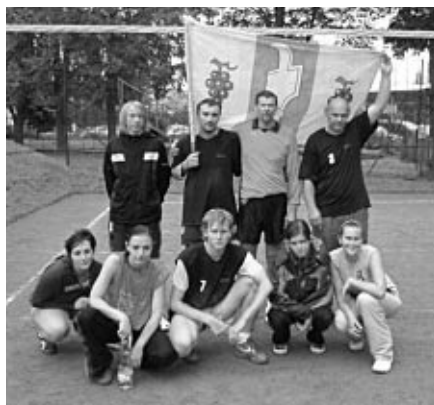
5. místo v republikovém finále