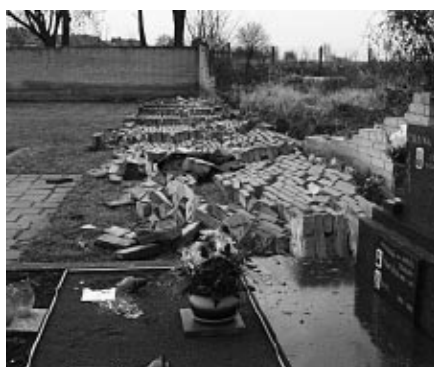
Zídka na hřbitově před opravou