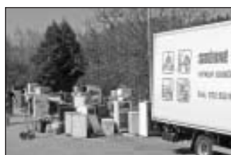
sběr nebezpečného odpadu, duben 2007