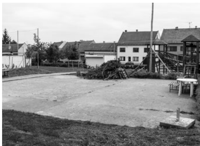
Horní hřiště, před rekonstrukcí povrchu