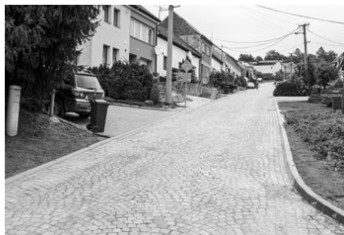
Rekonstrukce komunikace Starohorská, stav po