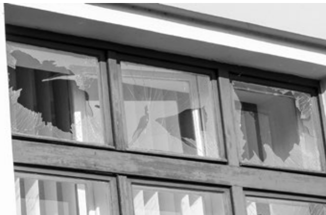
Tlaková vlna způsobila vysklení několika oken OÚ