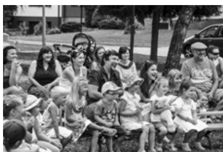
Divadlo, Vděční diváci