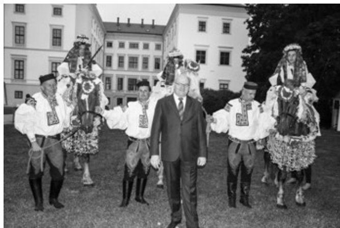
Setkání s ministrem kultury, D. Hermanem