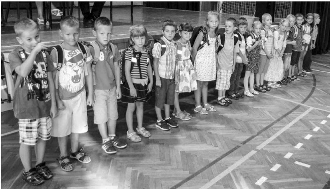
Zahájení nového školního roku, představení prvňáčků