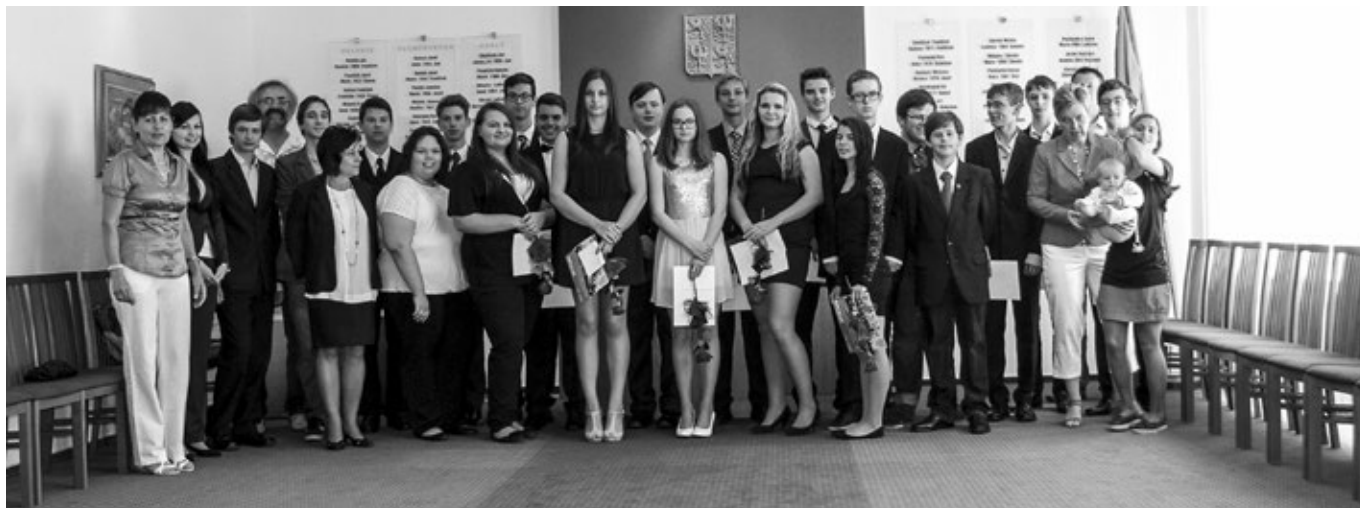
Přijetí žáků 9. třídy na OÚ