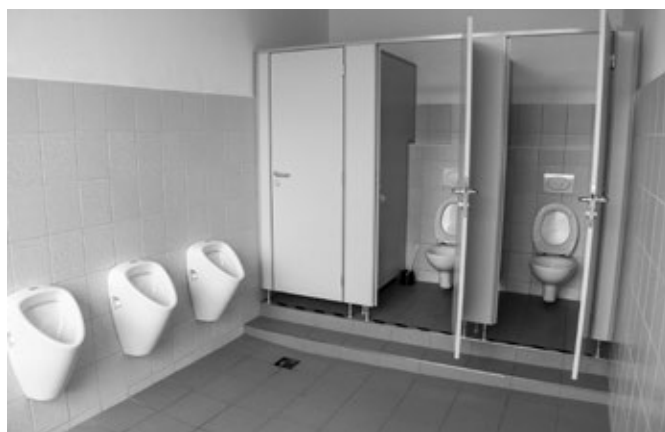
Rekonstrukce WC v ZŠ, stav po