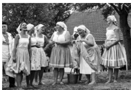
Vlčnovské búdové umělkyně