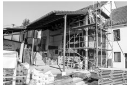
Zateplování hasičské zbrojnice