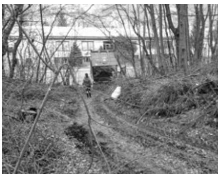
Les u Araveru před jarním úklidem