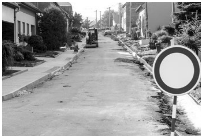
Rekonstrukce ulice Kaunicova, v průběhu