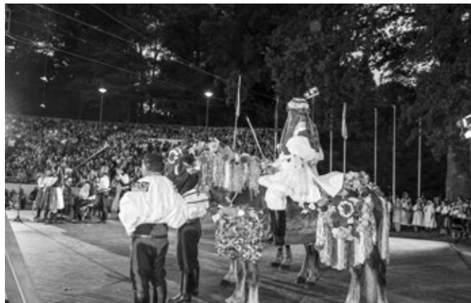
Jízda králů ve Strážnici, hlavní pořad