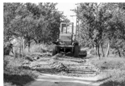
Úprava cesty směr Hornánský most – Žleb