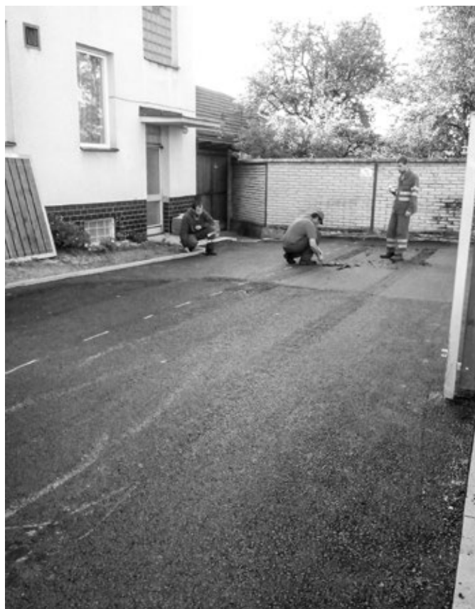
Vlčnov ve fotografii - Úprava povrchu u zahrádkářů