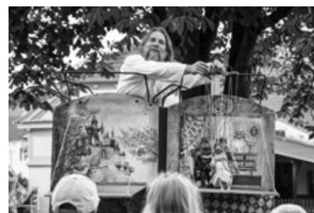
Divadlo, Pohádka o Šípkové Růžence