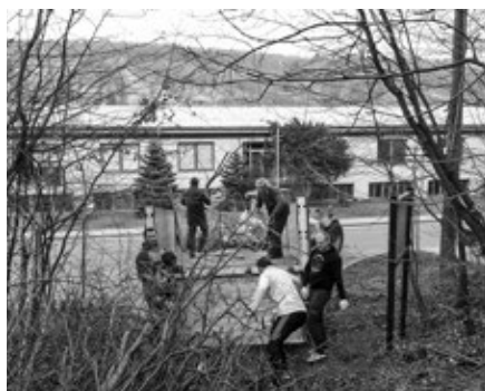
Jarní úklid lesa u Araveru