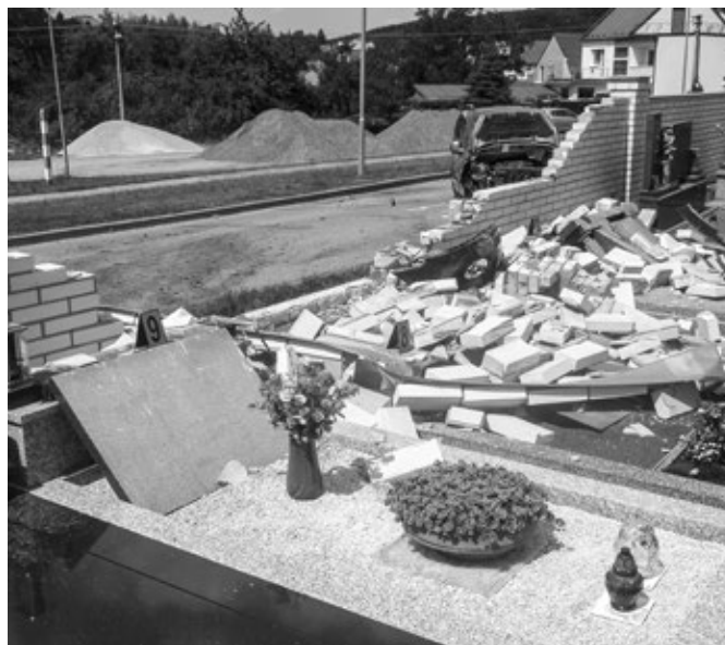
Dopravní nehoda na hřbitově