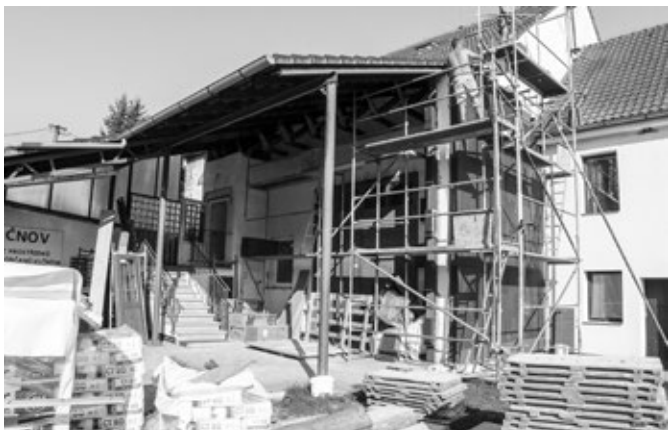
Zateplování hasičské zbrojnice