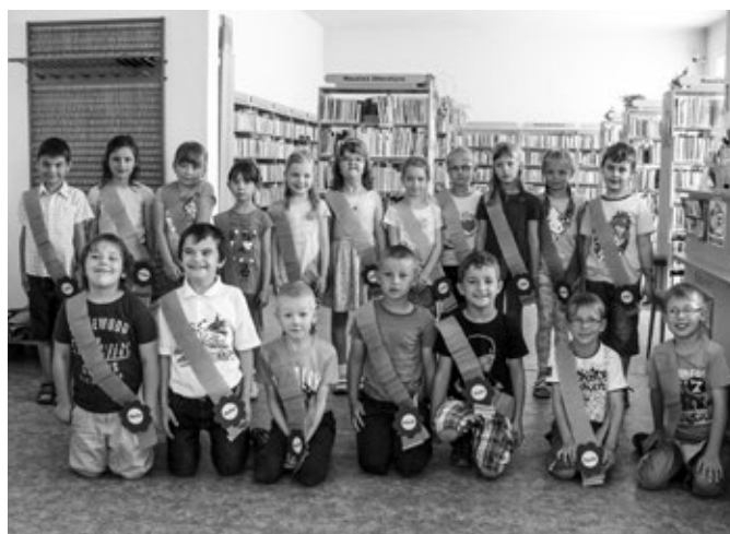
Pasování na čtenáře