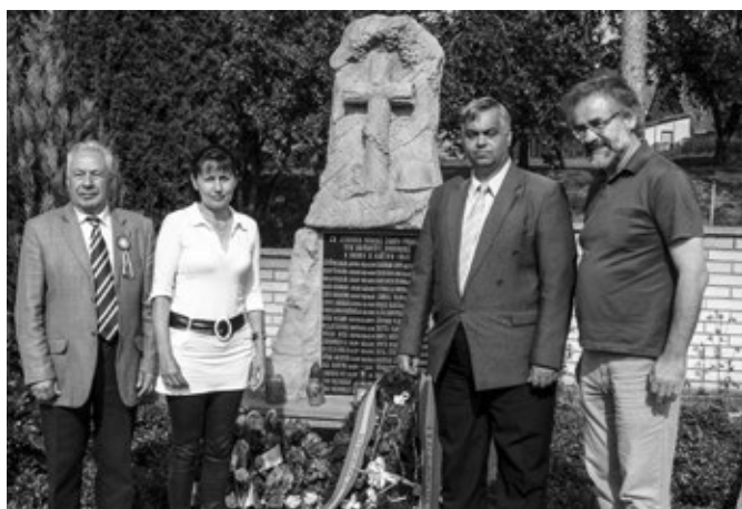
Položení věnců u pomníku rumunských vojáků se členy Rumunské společnosti historického letectví