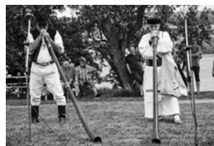
Fujaristé z Holíca