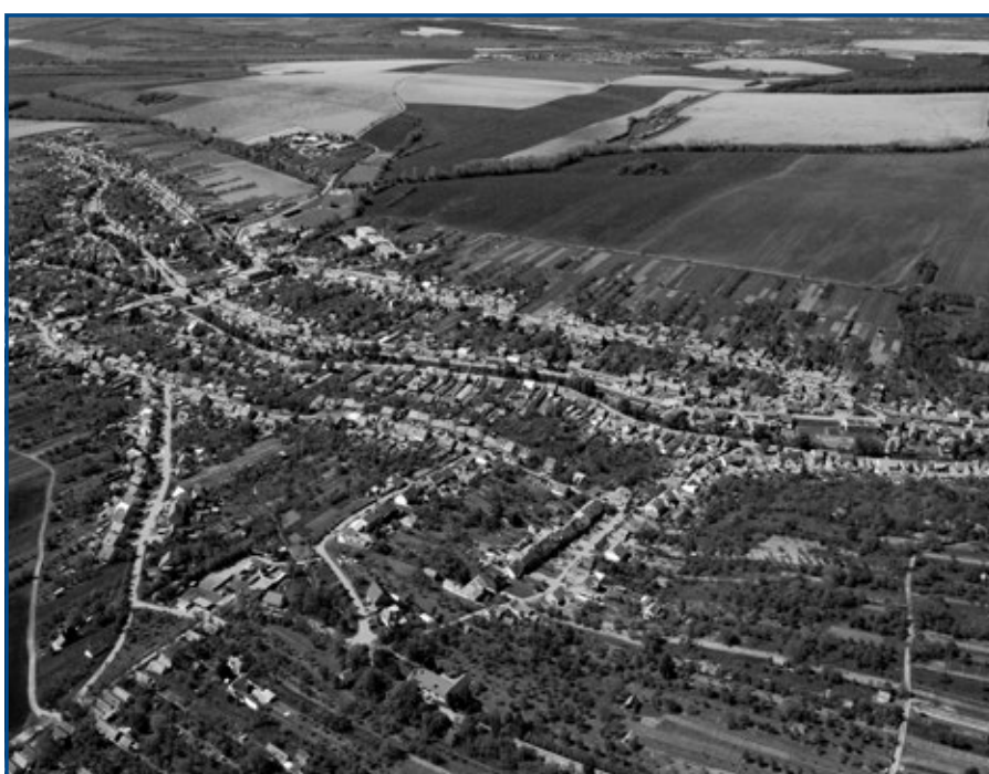
Aktuální letecké fotografie Vlčnova pořízené v květnu 2015