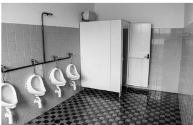
Rekonstrukce WC v ZŠ, stav před