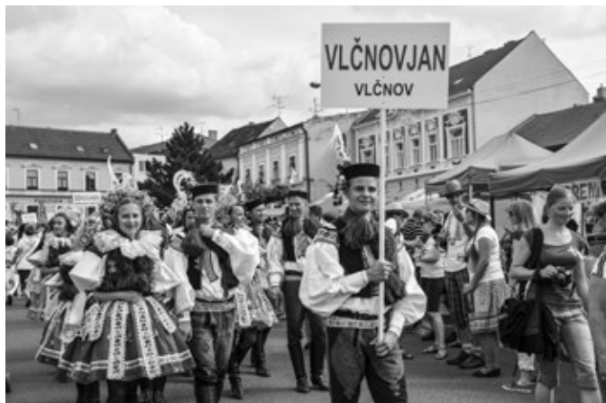
Vlčnovjan ve Strážnici

Při projíždce koní festivalovým areálem před vystoupením se nám také úplně náhodou podařilo potkat s ministrem kultury Danielem Hermanem, s nímž jsme krátce pohovořili a poděkovali mu za podporu