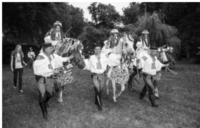
Zákulisí MFF Strážnice