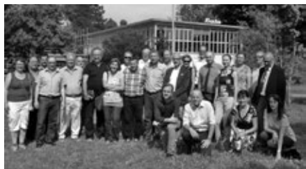
Pozvání hosté před klubovnou Baťa