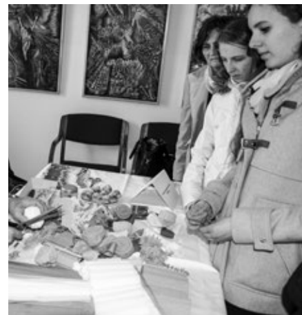
Miniveletrh cestovního ruchu v UH