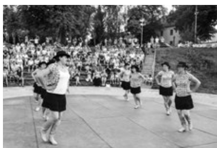
Country, Taneční skupina Tady a teď