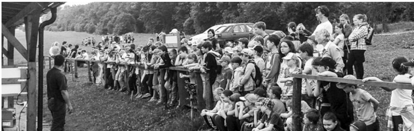
Žáci ZŠ na myslivecké střelnici