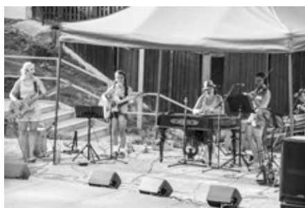
Country, Děvčice z Podolí