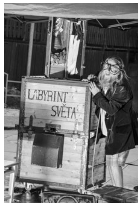
Divadlo, Labyrint světa