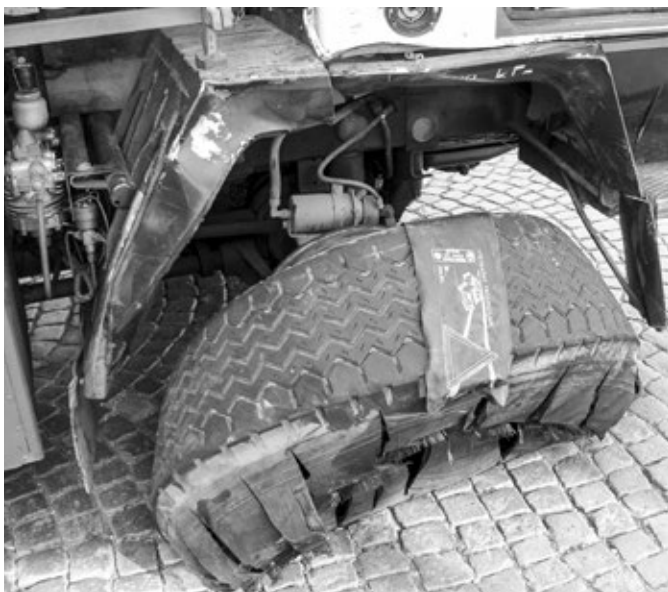
Defekt hasičského auta