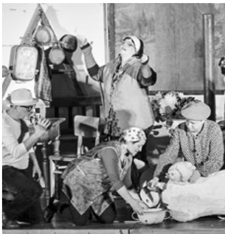
Divadlo Hrozen: Zabijačka