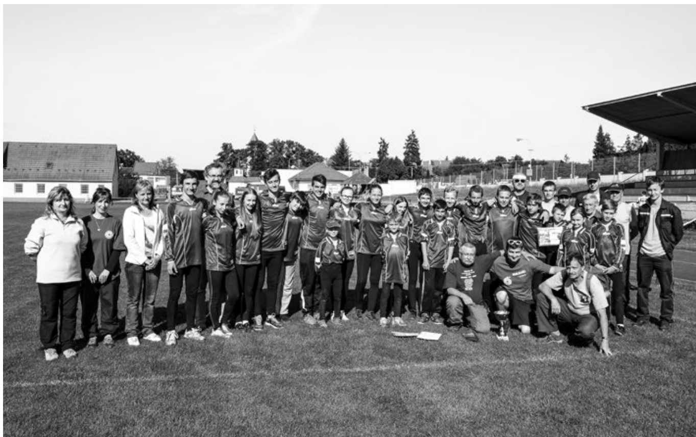
Okresní kolo hry Plamen