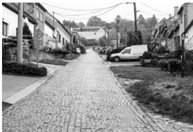
Rekonstrukce komunikace Starohorská, stav před