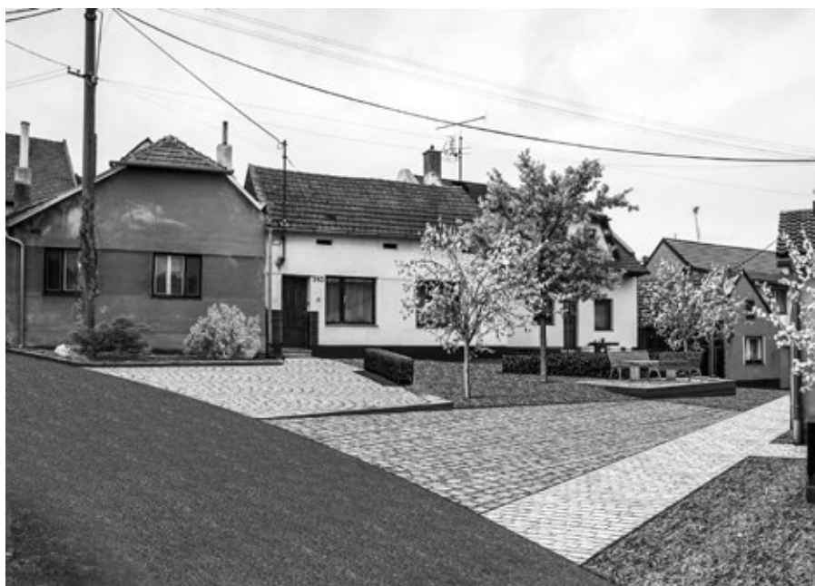
Návrh úpravy Dolních chatúpek

Do konce listopadu budou vyměněna všechna okna na budově obecního úřadu. Instalovat se budou dřevěná eurookna, která nás budou stát 880 000 Kč.