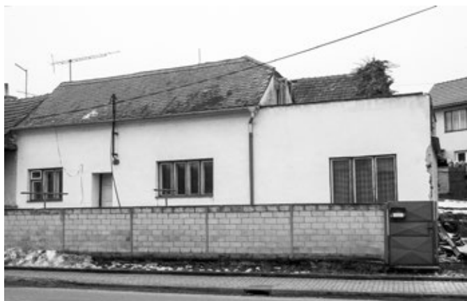
Dům č. 768, před demolicí