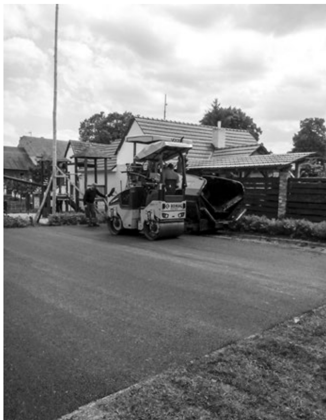
Úprava povrchu na horním hřišti