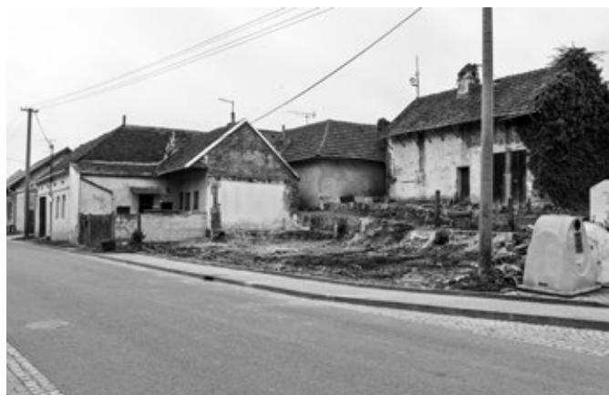
Dům č. 768, po demolici