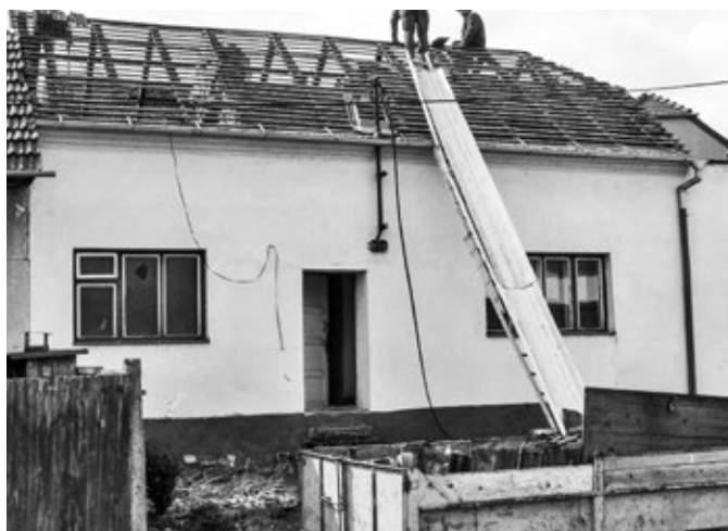
Dům č. 768, průběh demolice