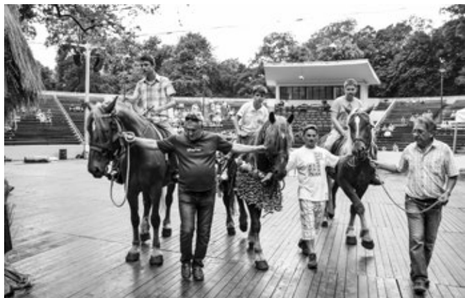
Zkouška před vystoupením