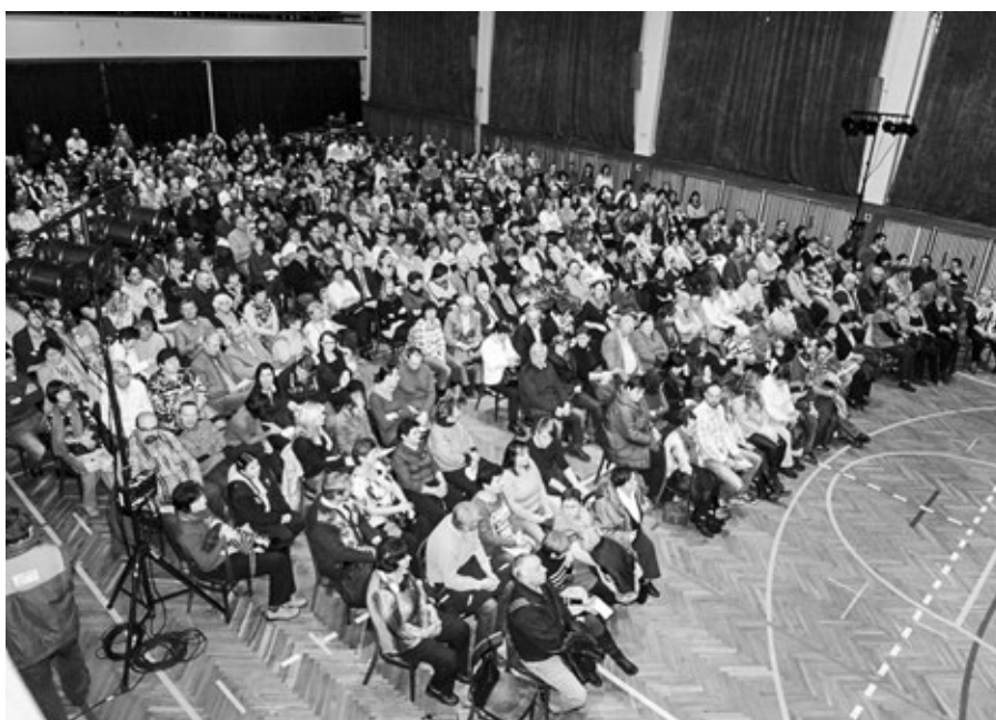
Zaplněný sál KSK, divadelní představení Zabijačka

pohlednic z Vlčnova, vydání jízdokrálových pohlednic z Vlčnova, vydání Programového sborníku Jízdy králů, spoluautorství na vydání publikace Chute a voně Oravy a Moravy, bedeker po kulínárskych podujatiach a expoziciách Oravy a východního Slovácka s receptmi tradičných pokrmov , na kterém jsme spolupracovali v rámci dotačního příhraničního projektu společně s Oravským kulturním strediskom v Dolnom Kubíně.