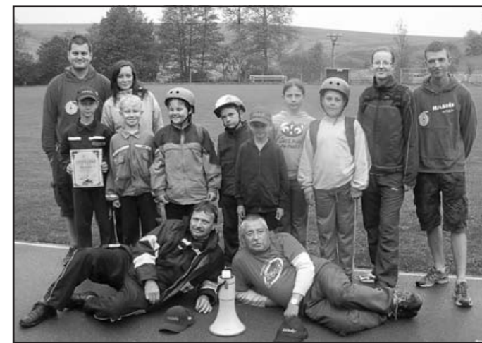
Mladší žáci Vlčnova se svými vedoucími – 4. místo na okrese

Starší žáci, dvoječka, je tým, kde by ještě třetina závodníků mohla být zařazena v kategorii mladších. Vzhledem k tomuto věkovému aspektu bylo jejich konečné třetí místo na okrese pro nás příjemným šokem a velkým příslibem do budoucnosti. Dvoječka výbornými výkony v průběhu samotného závodu ve Vlčnově pomohla „krytý záda“ jedničky a její největší soupeře dvakrát odsunula dokonce za sebe – skvěle a neuvěřitelně v konkurenci daleko věkově starších a fyzicky vyspělejších soupeřů. Tento tým má tudíž podíl na postupu do krajského kola, kde již v přípravě i v samotném závodě byli zařazeni dva její nejlepší závodníci.