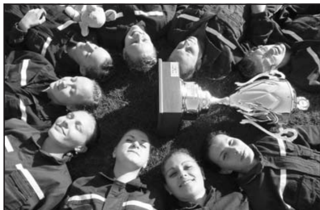
Mistryně republiky – MČR CTIF ve Dvoře Králové nad Labem