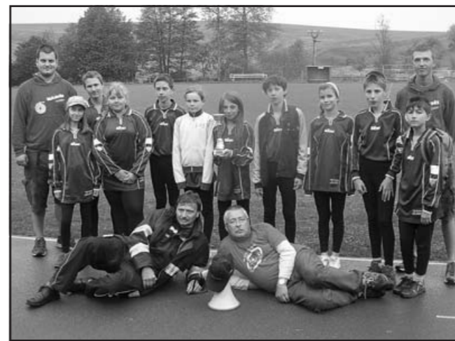
Žáci Vlčnova 2 se svými vedoucími – 3. místo na okrese