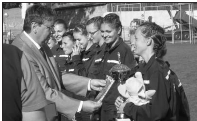
Ženy mistryně republiky – MČR CTIF ve Dvoře Králové nad Labem