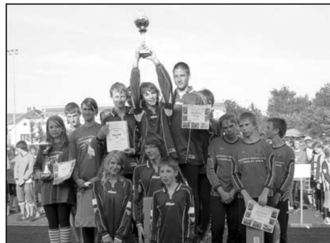
Žáci Vlčnova, 2. místo Huslenky (VS) a 3. místo Štítaná nad Vlčí (ZL)

Mladší žáci na okresním kole hry Plamen, které, jak bývá poslední desetiletí obvyklé, pořádal Vlčnov, obsadili pěkně čtvrté místo. Pro někoho možná na Vlčnov málo, ale když si uvědomíme věk těchto dětí, pozdní složení týmu, mohl by tento tým být novou dobrou základnou pro kategorii starších v budoucnosti.