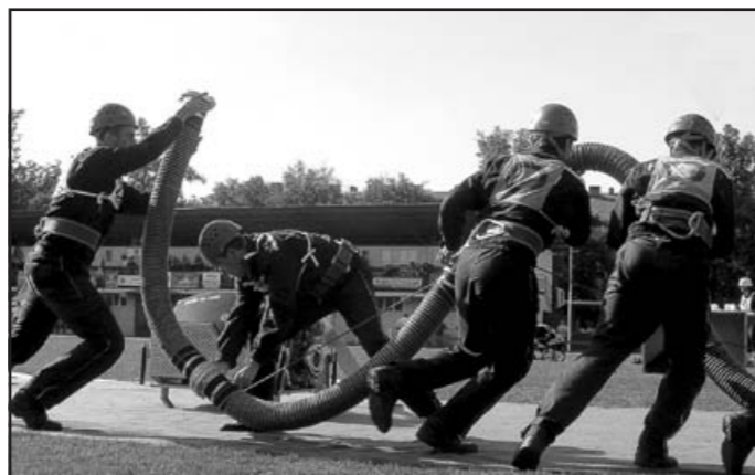
Muži M2 při útoku – MČR CTIF ve Dvoře Králové nad Labem