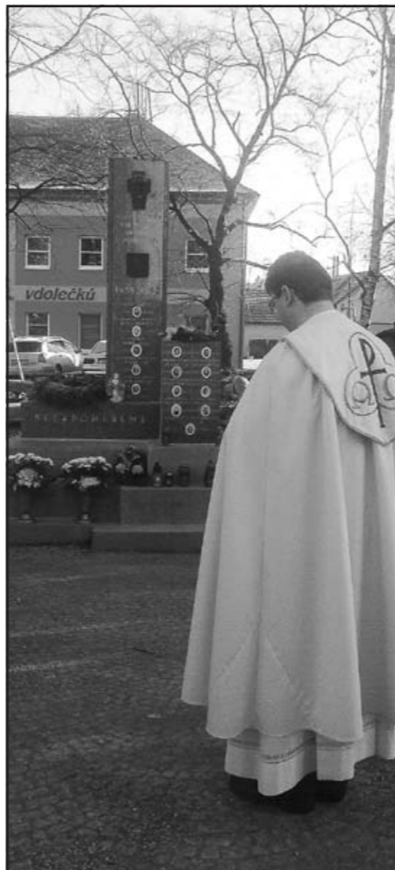
Žehnání přemístěného pomníku obětem 2. sv. války