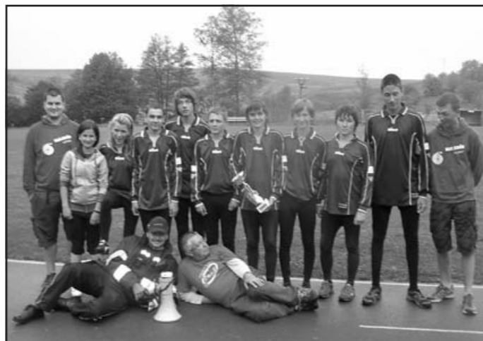
Žáci Vlčnova 1 se svými vedoucími jsou okresními přeborníky