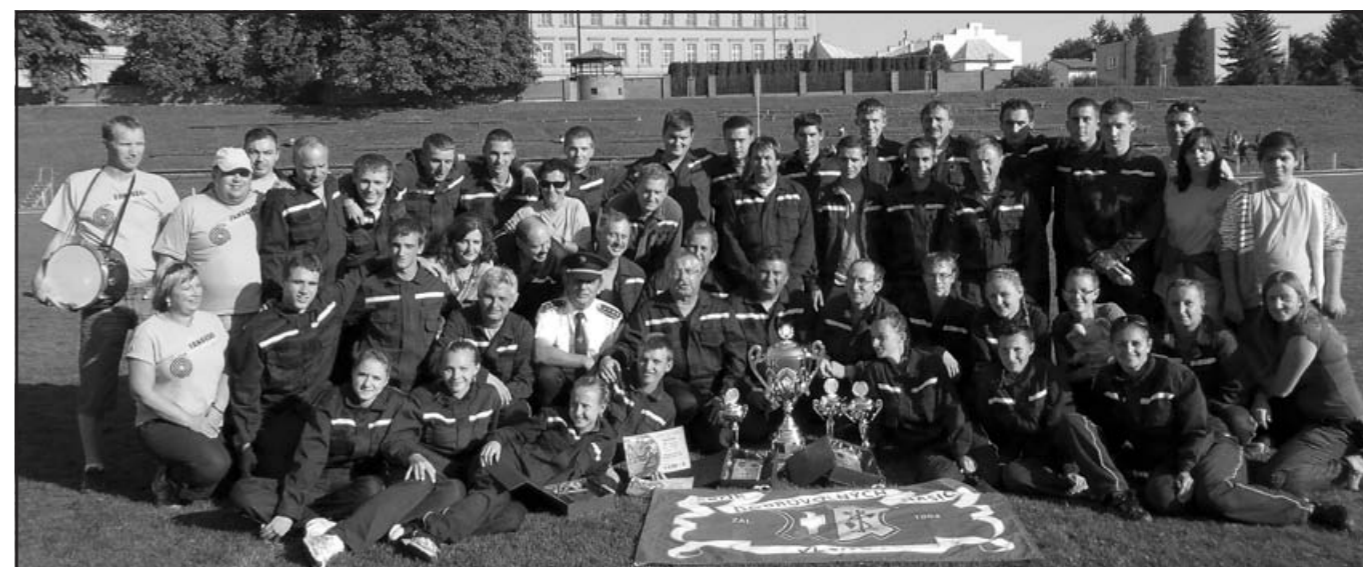
Celá úspěšná vlčnovská výprava – MČR CTIF ve Dvoře Králové nad Labem

Většina závodníků týmu starších hasičů M3 (s věkovým průměrem 49 let) si splnila svůj hasičsko-sportovní sen – jako člen týmu závodit na mistrovství republiky. Tým byl na takové významné události poprvé, ve své kategorii (se započtením věků jako bonus) sám, přesto si od