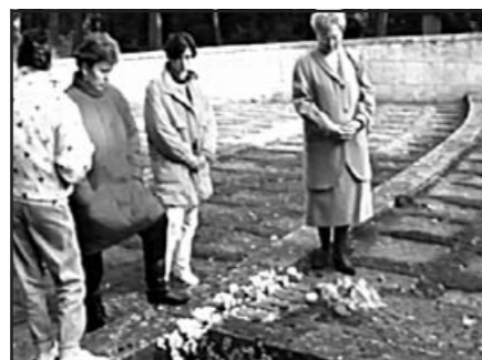
U hrobu otce ve Vidni