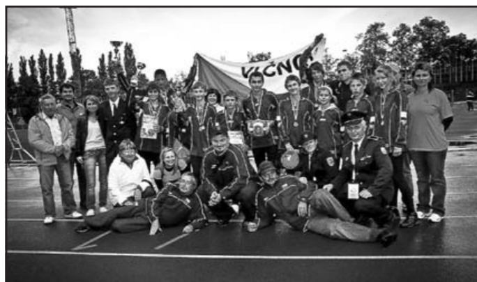
Celá úspěšná vlčnovská výprava v Ostravě – MČR Plamen Ostrava

pršet, ale zároveň bylo zřejmé, že v krátké době budeme muset absolvovat 4 disciplíny. Nesmírně náročná záležitost pro soutěžící, vedoucí i pro organizátory.