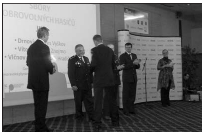
Starosta sboru přebírá o cenění a dar za vítězství