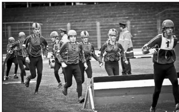
Rozběh vicemistrovského PÚ CTIF Vlčnova – MČR Plamen Ostrava