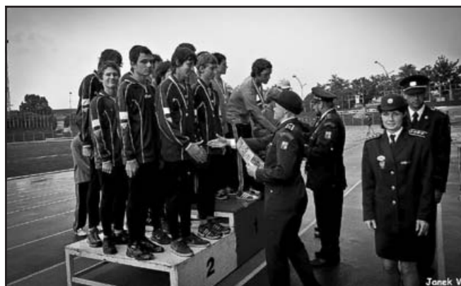
Vicemistři ČR v PÚ CTIF CTIF – MČR Plamen Ostrava