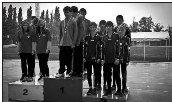
3. místo ve štafetě dvojic – MČR Plamen Ostrava