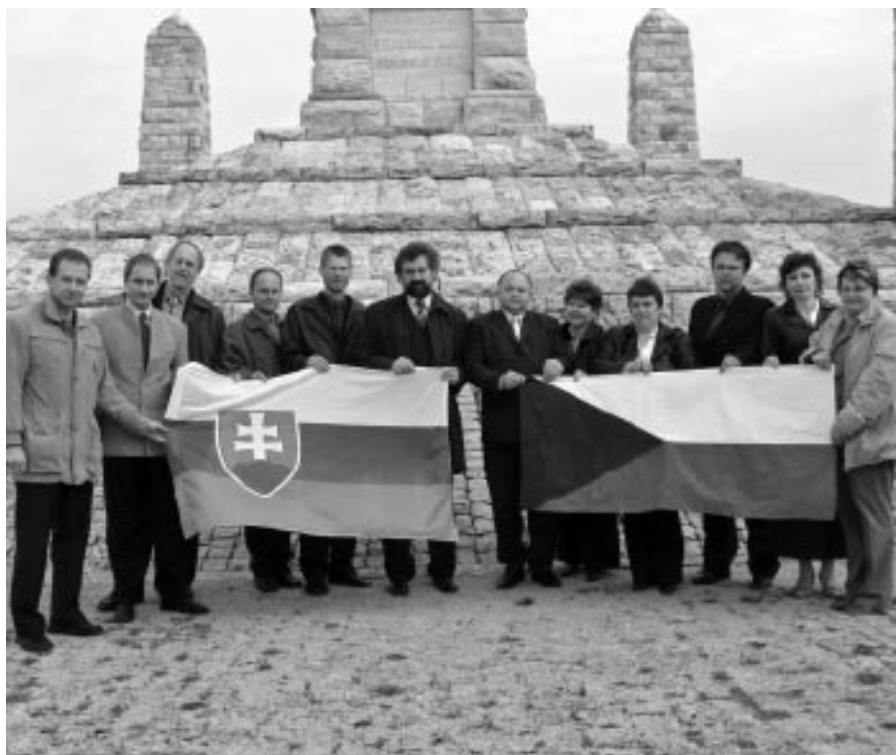
Podpis smlouvy o příhraniční spolupráci