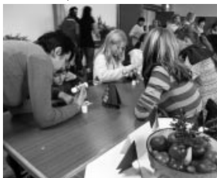
Chystáme vánoce 2007