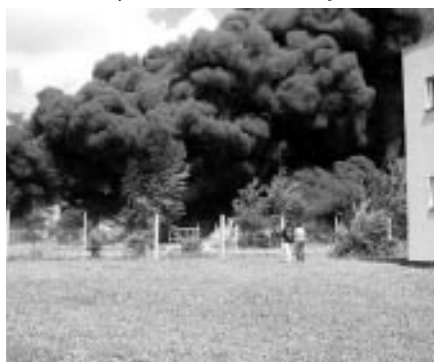
Požár pneumatik v Uh. Brodě