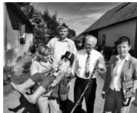
Setkání Vlčnovů – Vlčnov u Zavlekova