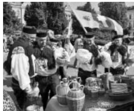
Slavnosti vína v Uh. Hradišti