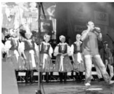
Vlčnovské budovalé umělkyně ve „Stodole Michala Tučného“