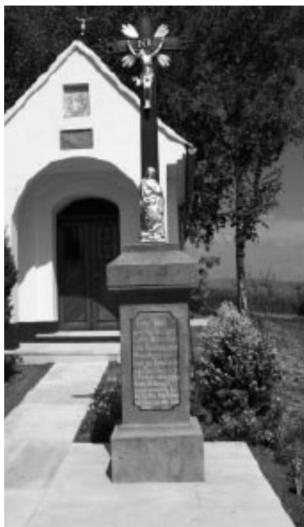
Oprava kapličky ve Vinohradech