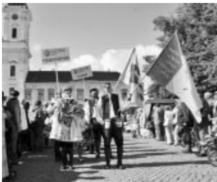
Slavnosti vína v Uh. Hradišti