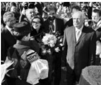
Návštěva prezidenta ČR