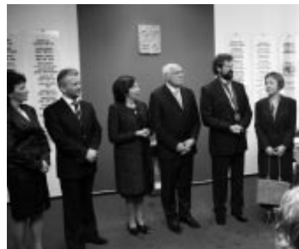
Návštěva prezidenta ČR