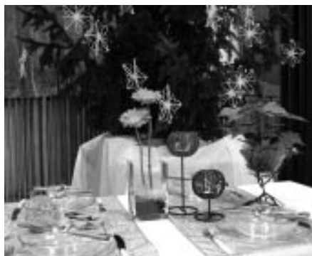
Chystáme vánoce 2007