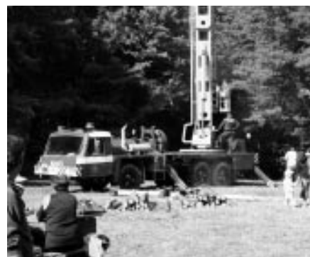
Setkání na Pepčíně