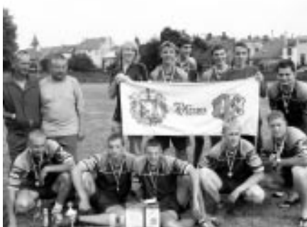
Muži – krajské kolo Kroměříž – 2. místo