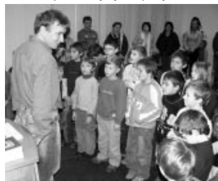
Přijetí žáků přípravy kopané