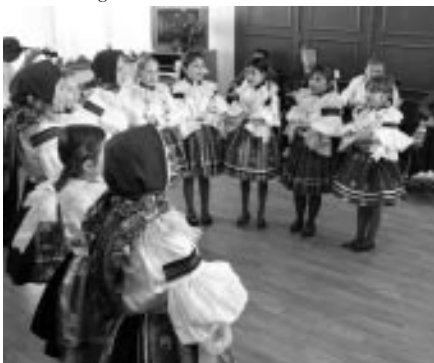
Vlčnovjánaek v Charitním domě