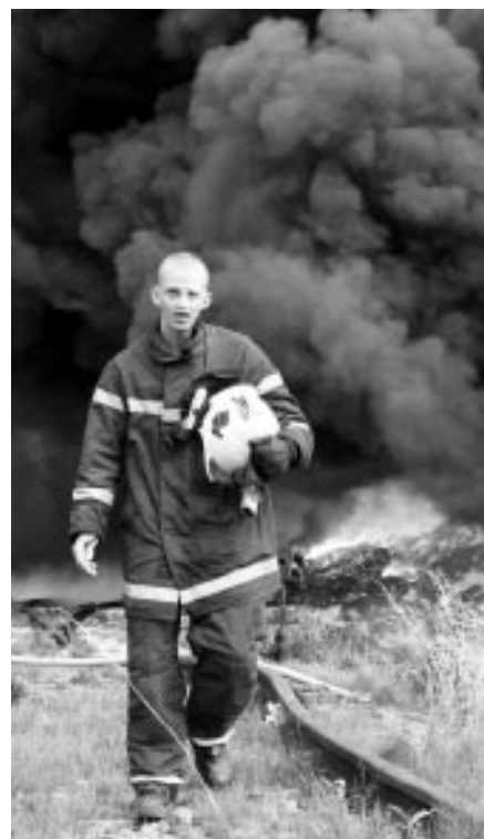
Požár pneumatik v Uh. Brodě