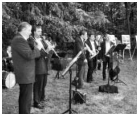
Setkání na Pepčíně