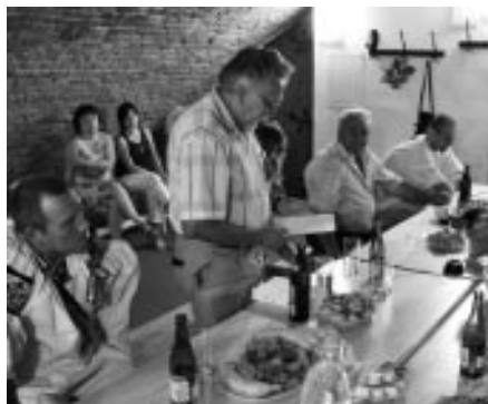
Setkání Vlčnovů – Vlčnov