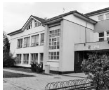
Nové byty v nadstavbě MŠ