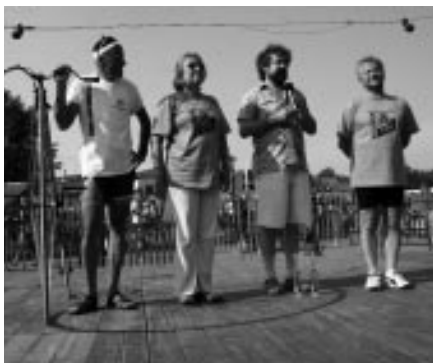
Netradičně za tradicemi J.K.