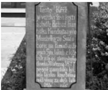
Oprava kapličky ve Vinohradech