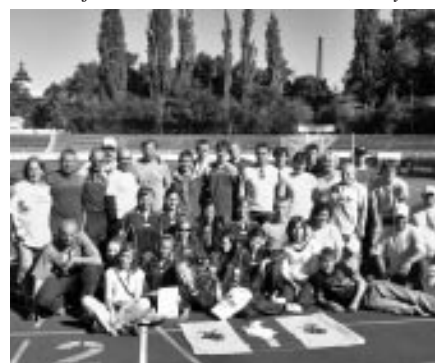
Vlčnovjané v Plzni – 9. místo ženy