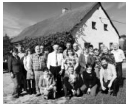
Setkání Vlčnovů – Vlčnov u Zavlekova