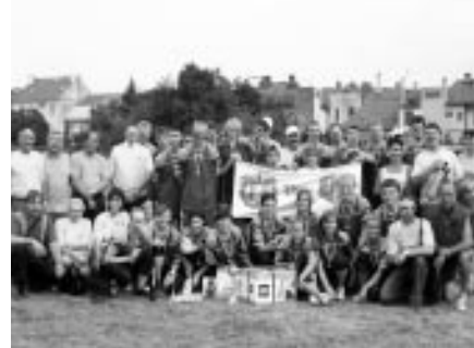
Krajské kolo, Kroměříž – muži, ženy