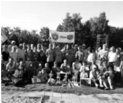
Vlčnovjané, Mistrovství ČR ve Zlíně