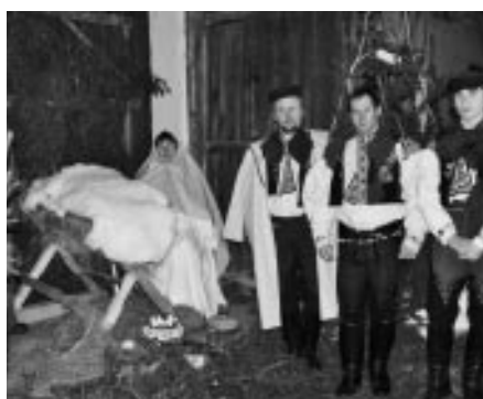
Živý Betlém 2006