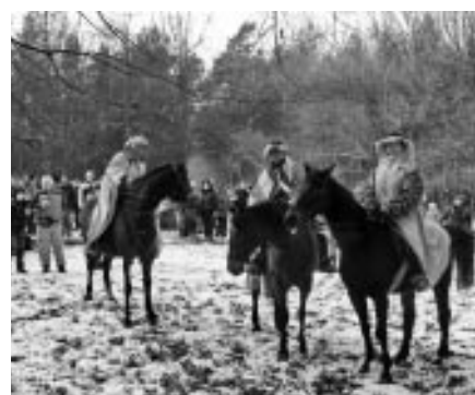
Silvestrovské setkání na Pepčíně