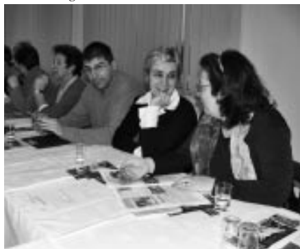
Setkání spolků se starostou obce