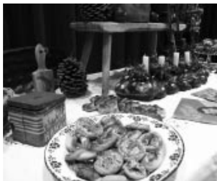
Chystáme vánoce 2007