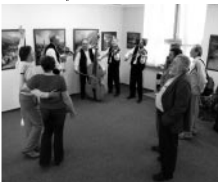
Vernisáž výstavy – Galerie na Měštance