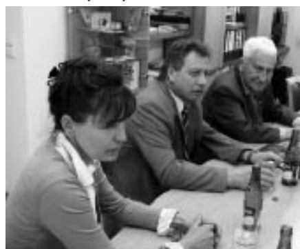
Tomáš Baťa ve Vlčnově