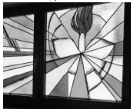
Žehnání vitráží na Charitním domě