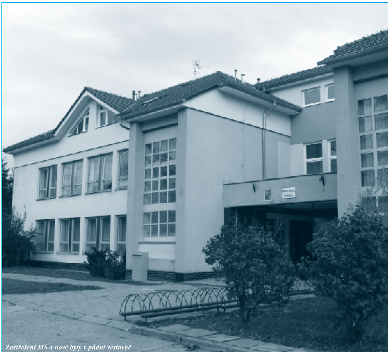
Zastřešení MŠ a nové byty v půdní vestavbě

e-mail: obec@vlcnov.cz VYDÁVÁ RADA OBCE VE VLČNOVĚ www.vlcnov.cz www.ksk.vlcnov.cz