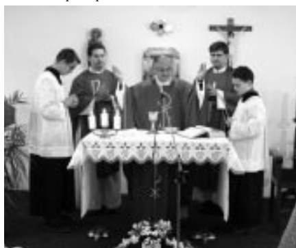
Žehnání vitráží na Charitním domě