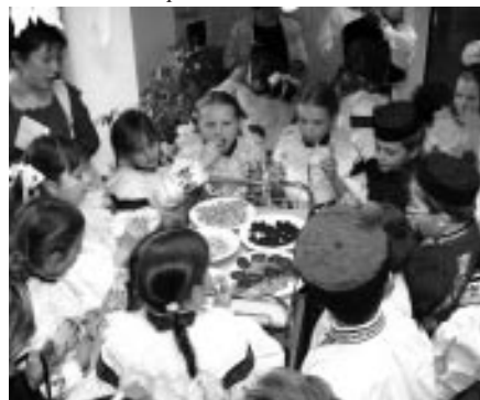
Vlčnovjánaek v Charitním domě