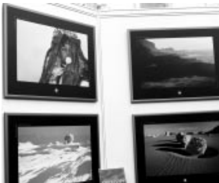
Region Tour Brno, veletrh CR