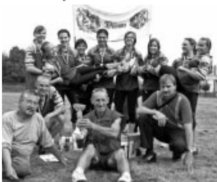
Ženy – krajské kolo Kroměříž – 1. místo