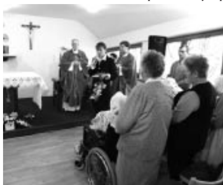
Žehnání vitráží na Charitním domě