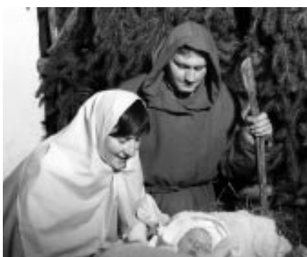
Živý Betlém 2006