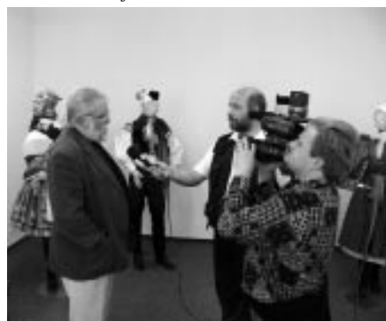
Vernisáž výstavy – Galerie na Měštance