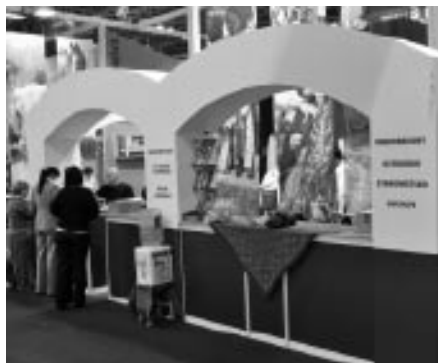
Region Tour Brno, veletrh CR