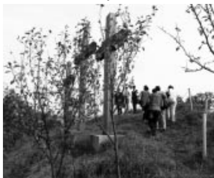
Zájezd Vlčnovjanů po Východním Slovácku