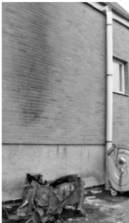
Požár kontejneru u KSK