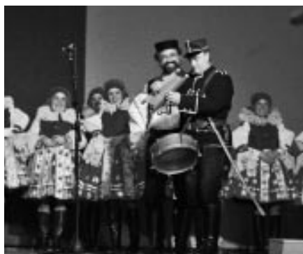
35. výročí založení Vlčnovjanu