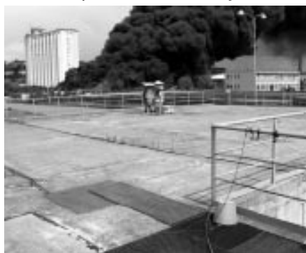
Požár pneumatik v Uh. Brodě