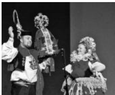
35. výročí založení Vlčnovjanu