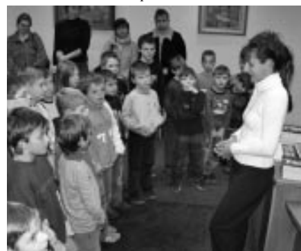
Přijetí žáků přípravy kopané