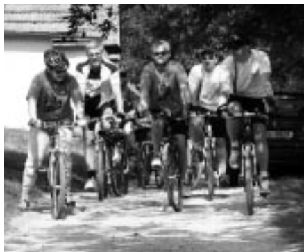
Netradičně za tradicemi J.K.