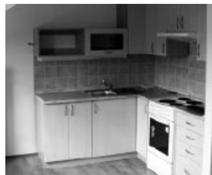
Nové byty v nadstavbě MŠ