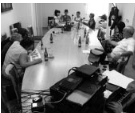
Natáčení Českého Rozhlasu Zlín