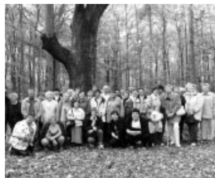
Zájezd Vlčnovjanů po Východním Slovácku