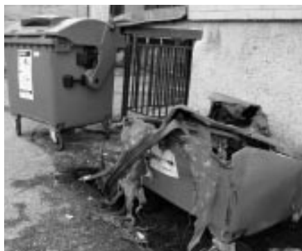
Požár kontejneru u KSK