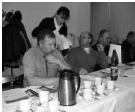
Setkání spolků se starostou obce