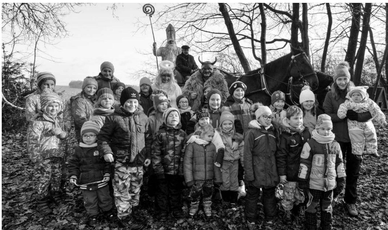
Děti s Mikulášem, andělem a čertem