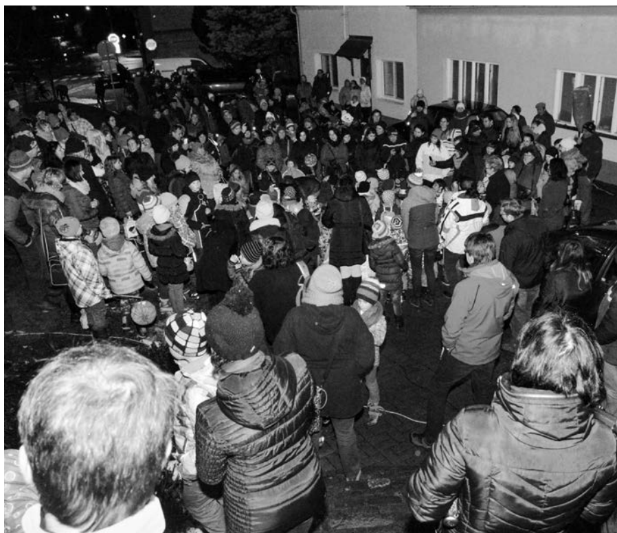
Zájem o rozsvícení stromečku byl velký