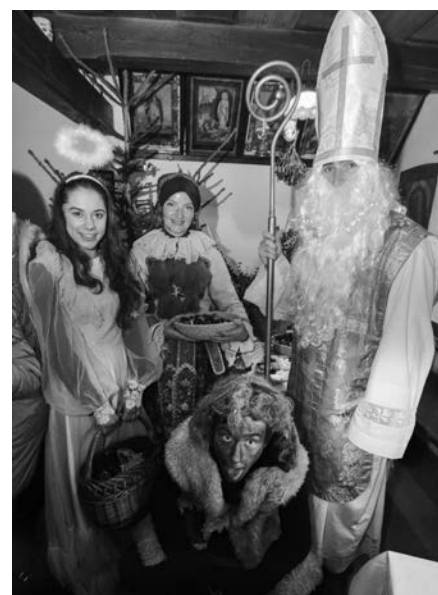
Návštěva sv. Mikuláše s doprovodem