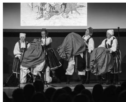
Pisničky z malířovy palety – pořad k výročí J. Uprky