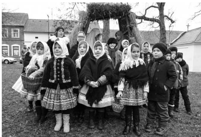
Vlčnovjáneek u jeslíček