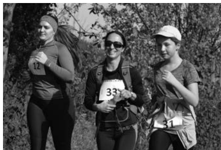
Zástupci obce Suchá Loz