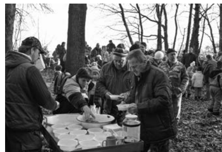
Myslivci připravili zvěřinový guláš