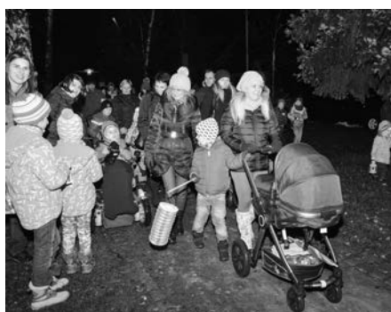
Průvod s lampičkami k vánočnímu stromu