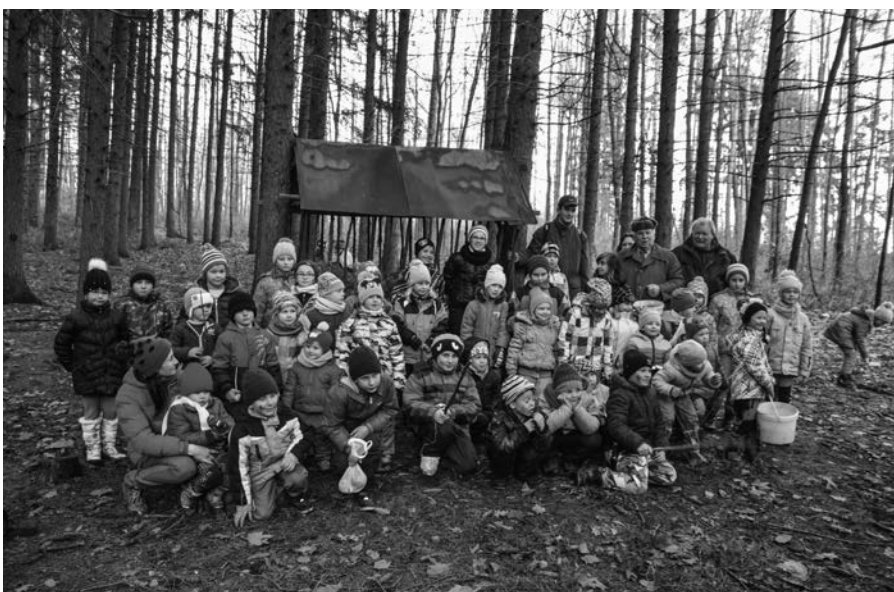
Společné foto u krmelce