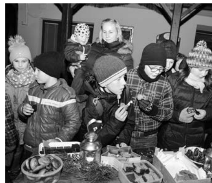
Maminky připravily občerstvení