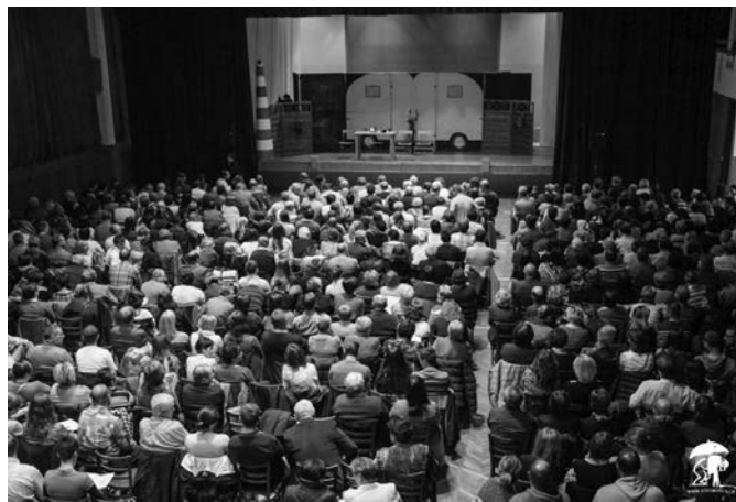
Divadlo Hrozen – Dovolena ólinkuzif