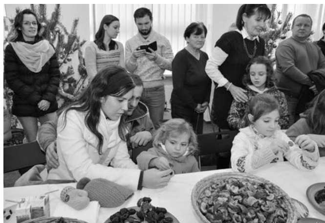
Výroba ozdob ze sušeného ovoce

Na Štědrý večer hvězdičky, ponesou vajíčka slepičky.