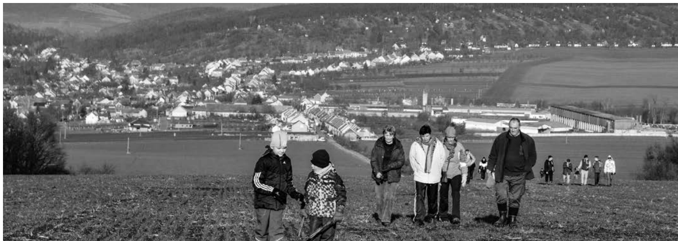
Účastníci pochodu na mysliveckou chatu – pohled od lesa k Vlčnovu