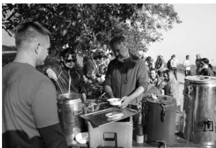
Občerstvení pro účastníky