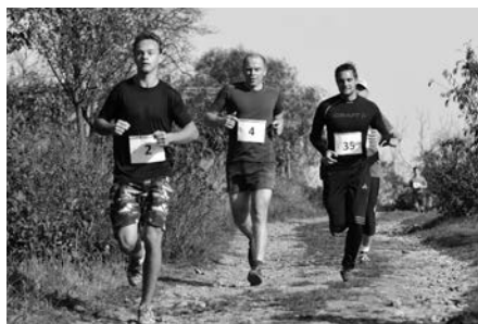
Běžci na trati