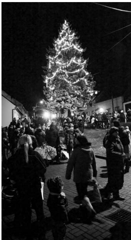
Rozsvícený vánoční strom