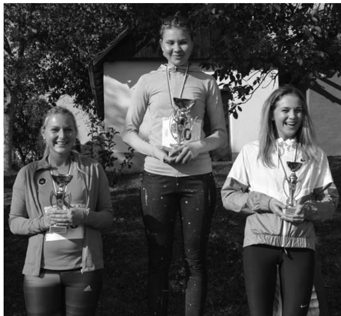
Vítězky v ženské kategorii