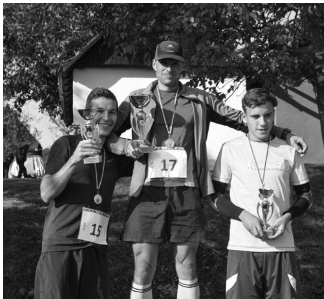
Muži na stupních vítězů