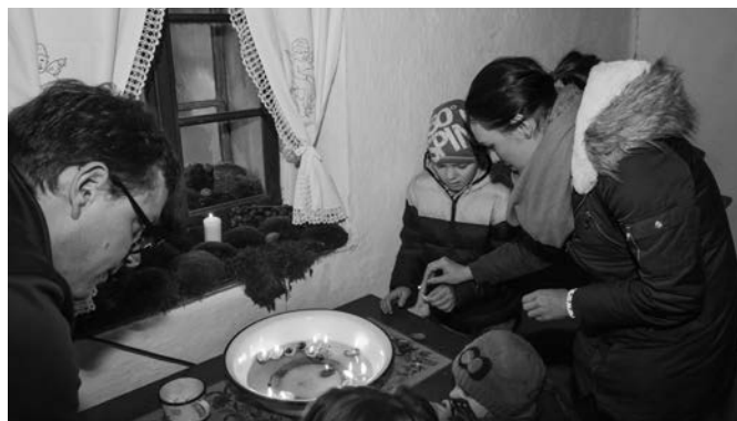
Lodičky ze skořápek