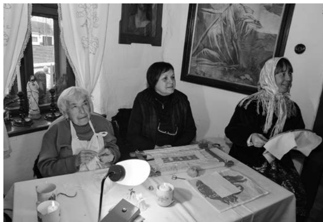
Vyšívání v muzeu pod kostelem