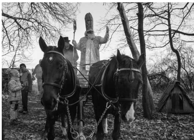
Mikuláš přijel do cíle – k myslivecké chatě

Členové mysliveckého sdružení rozhodli o její celkové rekonstrukci. Realizace je rozložena do tří etap a předpokládané náklady činí 500 000 Kč. První etapa začala již v letošním roce přípravou stavebního materiálu, připraveny jsou cihly a stavební rezivo pořízené za podpory obce Vlčnov. Druhá etapa, již náročnější, bude zahájena na jaře příštího roku. Spočívá v celkové opravě nosných prvků, stropů, výměně krovů a krytiny, výměně oken