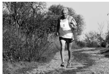
Nejstarší účastník závodu