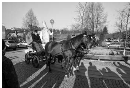
Mikuláše s doprovodem přivezlo koňské spřežení