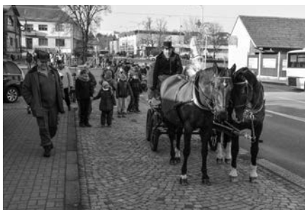
Z parkoviště U Krála pochodem do lesa