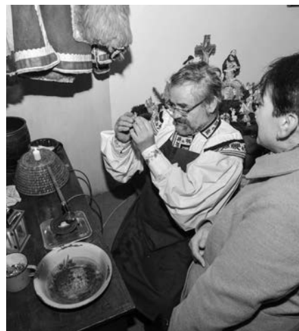
Starosta věštil z odlévaného olova