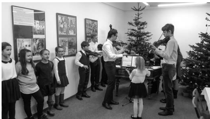
Cimbálová muzika Vlčci v galerii