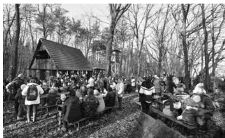
U myslivecké chaty bylo plno