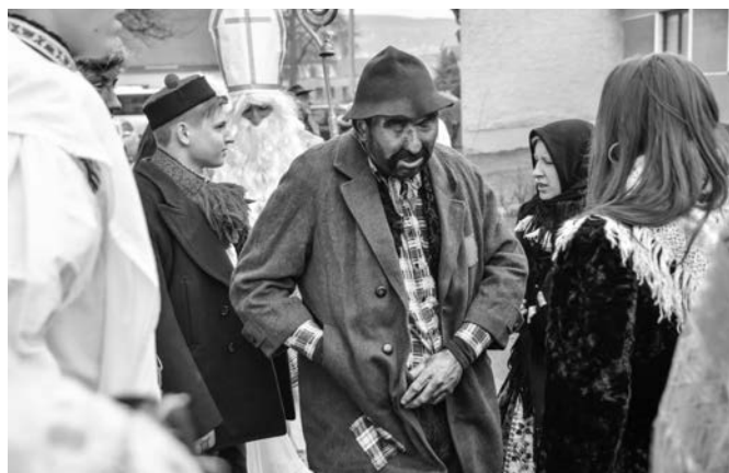
Členové souboru Vlčnovjan