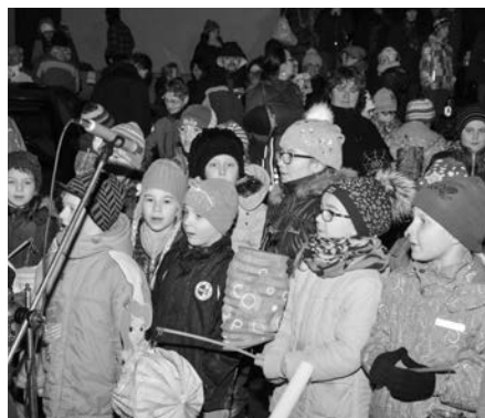
Děti z MŠ a ZŠ zazpívaly koledy