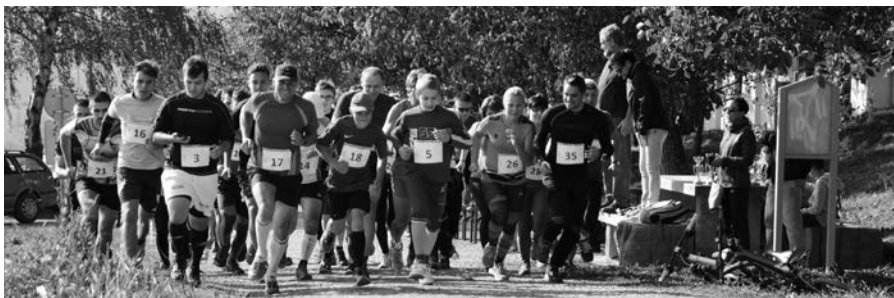
Búdový běh odstartován