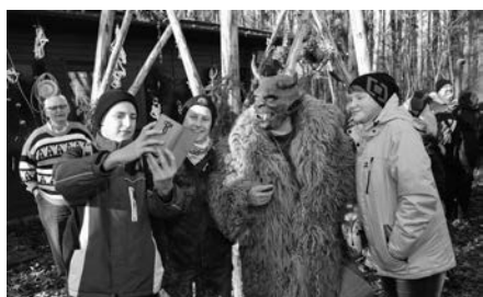
Čert byl strašidelný!