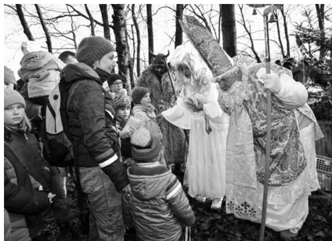
Mikuláš rozděljuje dárky