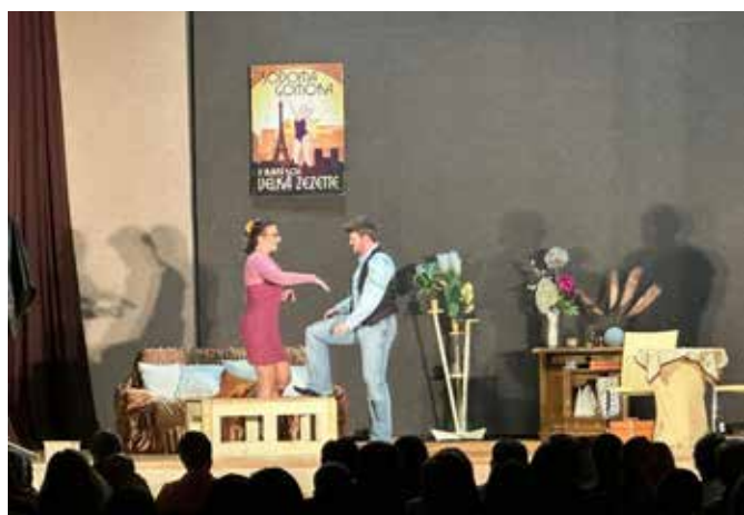
Divadlo Blic - Na správné adrese