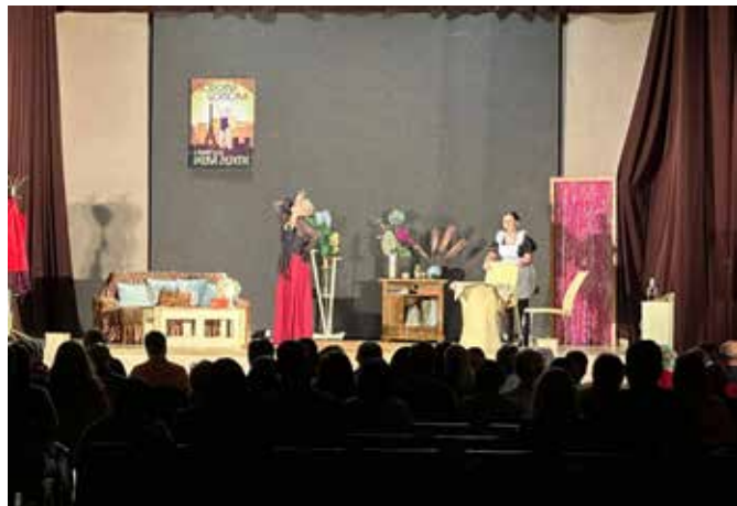
Divadlo Blic - Na správné adrese