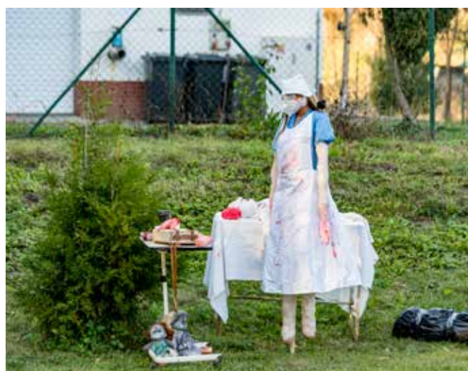
Dýňování na Dolním hřišti