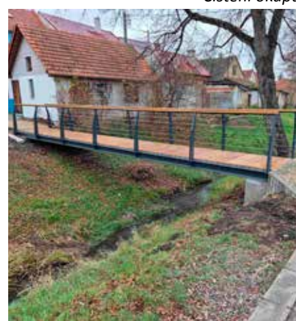
Nová lávka přes potok