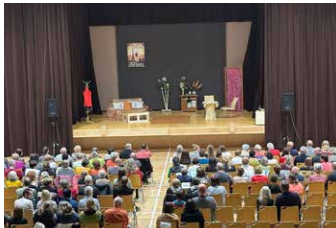
Divadlo Blic - Na správné adrese