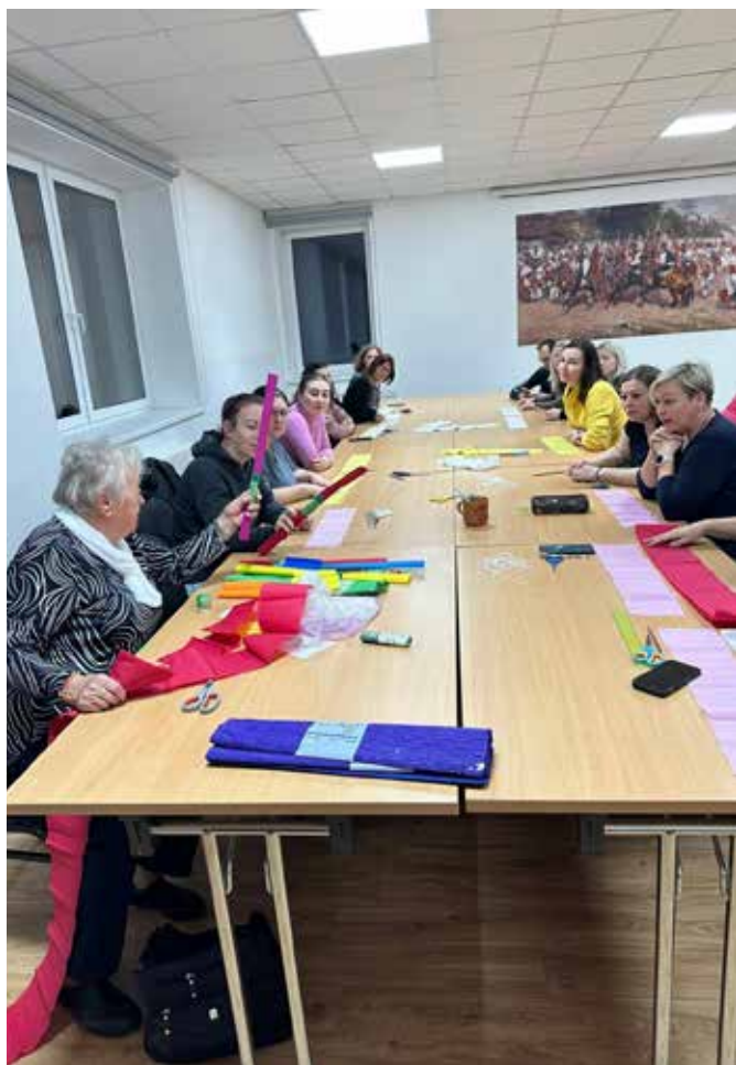
III. Workshop růžičky