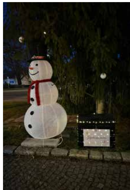
Rozsvícení vánočního stroměčku