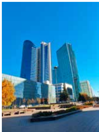
Až neladící kombinace architektury