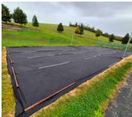
Kurt na koupališti

tyto činnosti nám pomohla zrychlit technika. Ať už náš nakladač Avant s vysavačem a vlečkou, tak i pronajatá plošina. Mezi další práce patří ořez keřů i stromů po vesnici a následný úklid větví. Tyto mohou všichni občané Vlčnova ukládat na hromadu vedle parkoviště našeho koupaliště. Není nutné je tedy doma pálit. Proběhlo i pro letošní rok poslední sečení potoků. Jedná se o velmi náročnou a zdoluhavou práci. Tu nám bohužel komplikují nezodpovědní občané, kteří sypou bioodpad na břehy potoků. Pokud najede naše nová dálkově ovládaná sekačka do hromady odpadu, který není ve vysoké trávě vidět, může dojít k jejímu výraznému poškození. Následná oprava opět zbytečně vyčerpává peníze z obecního rozpočtu. Upozorňuji všechny občany, že není možné jakýkoliv odpad ukládat na břehy potoků v celém Vlčnově. Toto jednání může být posouzeno jako založení černé skládky. Navíc v případě vydatných srážek snižuje uložený bioodpad průtok vody a může zapříčinit vylití vody z koryta do okolí.