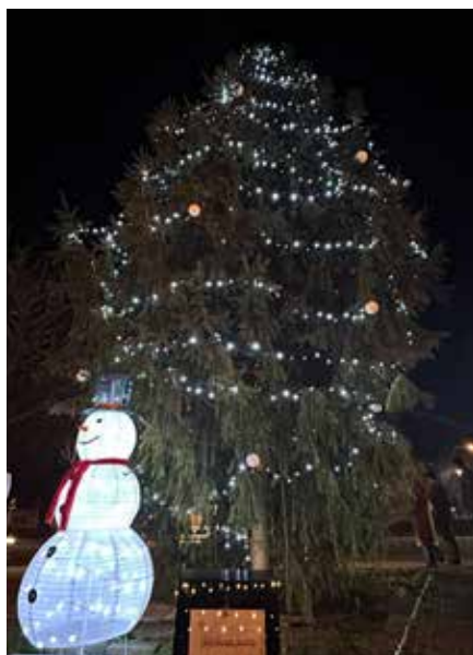
Rozsvícení vánočního stroměčku