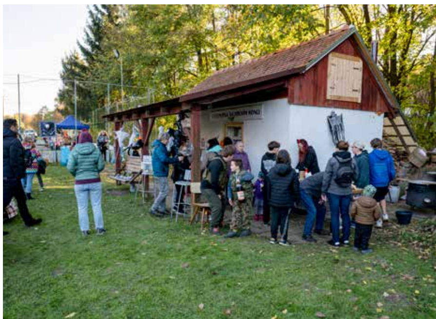
Dýňování na Dolním hřišti