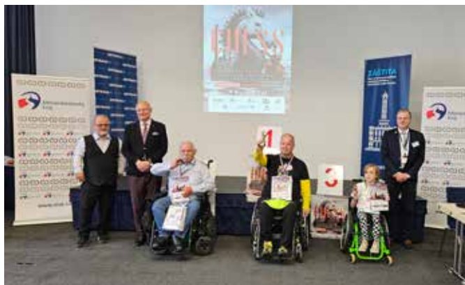
Ostrava ME IPCA