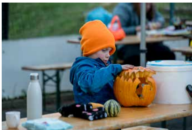
Dýňování na Dolním hřišti