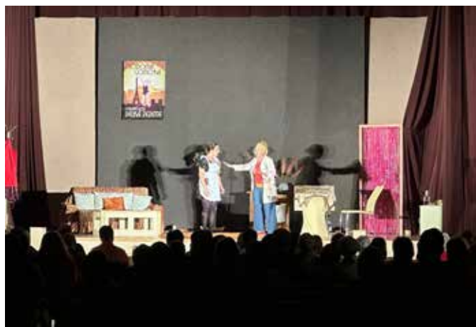
Divadlo Blic - Na správné adrese