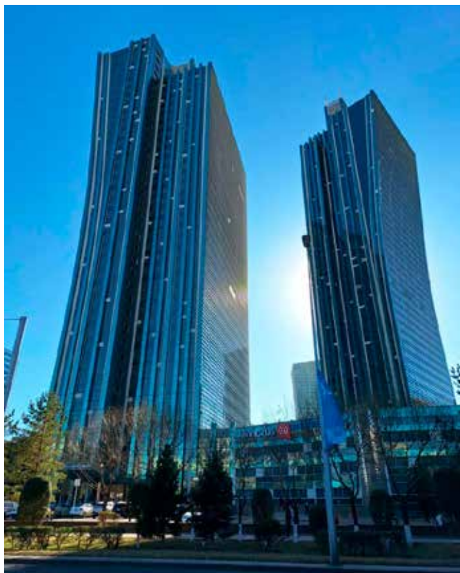
Jako v Dubaji

Centrum bylo otevřeno před 7 roky, jako stavbaře mne některé věci udivily. Příjezdová komunikace vedoucí kolem byla šířky do 5 metrů. Centrum mělo vysoké kovové oplocení s bránou šířky kolem 3 m. Dostatečné pro zabočení a jezd osobních aut i malých mikrobuseů. Řidiči autobusů se naučili, jak se do areálu centra dostat; vjeli na protější chodník, příp. až do živého plotu a s 1–2 couvnutími vjeli. Projekt nepočítal s autobusy na rozlehlém parkovišti centra? Stačila by brána metr a něco širší a vsunutá do areálu.