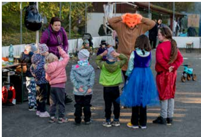
Dýňování na Dolním hřišti