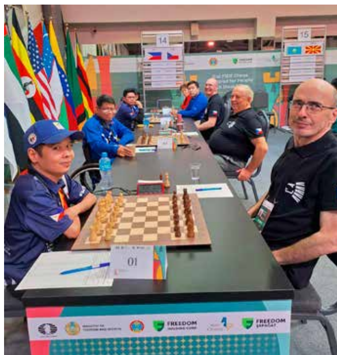
Cenná výhra 2,5-1,5 s Filipínami

Na úvodu se Severní Makedonií a výsledku 2-2 se podepsala únava z cestování. Pak jsme těsně zdolali kvalitní domácí družstvo ICCD, další těsná výhra s nasazenou sedmičkou Filipínami nás katapultovala k bojům o pódium. Jak měl někdo z nás velkou výhodu, ostatní zaváděli partii do remízového přístavu.