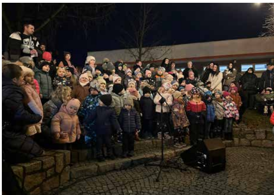
Rozsvícení vánočního stroměčku