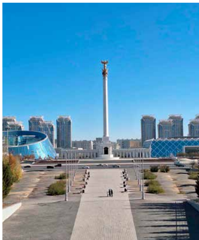
Univerzita umění (kruhová) a monument Kazak eli

Na OL byla asi stovka asistentů v modrých mikinách s nápisem volunteer, nabízeli všude pomoc. Šlo převážně o dívky ze středních kol mluvící anglicky. Ruský uměly, ruština s kazaštinou jsou dva úřední i školní jazyky země. Spíše se podivovali, že někteří cizinci mimo postsovětské země ruský znají. Mladým asi vštěpují, že se všude domluví anglicky. Země cíleně směřuje k celosvětovým kontaktům a mladí mají být jejich předvojem.