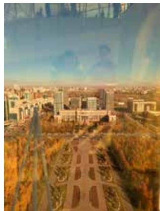
Parky a zeleň odlišná od naší

Uvádí se, že v tomto období prší cca 7 x měsíčně. My jsme zažili krátký deštěk až cestou na letiště, jinak bylo stále slunečno, s teplotami jako v ČR. Přes den 8–12 °C, jednou až 16°C. Rána již bývala mrazivá. Ročnímu srážkovému úhrnu asi v poloviční výši průměru u nás se přizpůsobuje skladba zeleně se suchu odolnými dřevinami, hluboce kořenícími. Městem protéká řeka Išim, možná trochu menší než Vltava v Praze, ale s více rozvětvenými. Je zde i dost vodních ploch, snad i parků. Tam jsem se já nedostal.