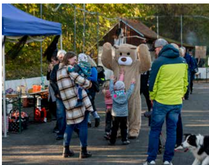
Dýňování na Dolním hřišti