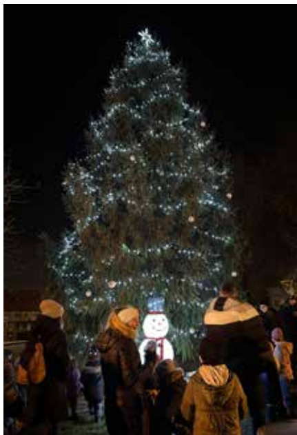
Rozsvícení vánočního stroměčku