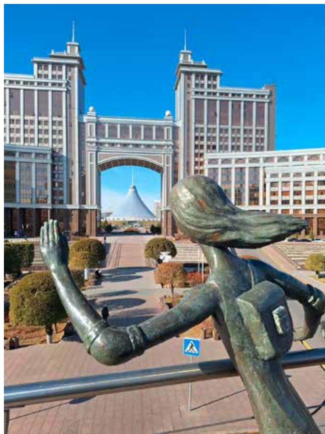
Sovětská architektura a tržnice Chan Šatyr

Nové hlavní město bylo zřízeno z důvodů bezpečnostních i geografických. Původní metropole Almaty (či Alma-Ata) leží u jižní hranice státu blízko dalších středoasijských zemí s neklidnými poměry. Severní Kazachstán tvoří většinou rozlehlé, téměř liduprázdné stepi. Jedná se o devátou největší zemi světa s 20 miliony obyvatel, které získávají impuls k všestran-