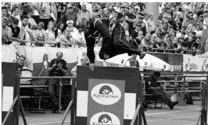
Člen týmu SDH Vlčnov M1 překonává bariéru při olympijském pokusu štafety CTIF – stříbrné ocenění