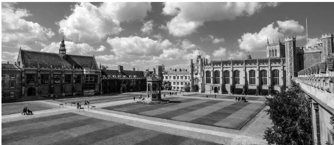
Velké nádvoří Trinity College (dole). Budovy zleva doprava jsou jídelna, ředitelova ložnice, ubytování/kanceláře a kaple