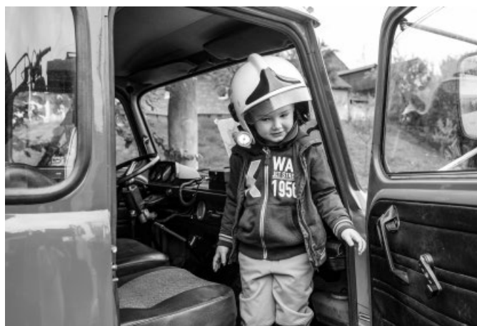
V hasičské zbrojnici