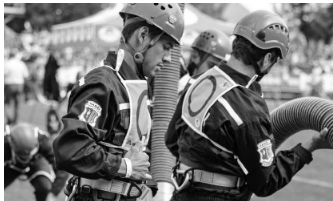
Členové týmu SDH Vlčnov M2 vytvářejí sací vedení při olympijském pokusu požárního útoku CTIF – stříbrné ocenění