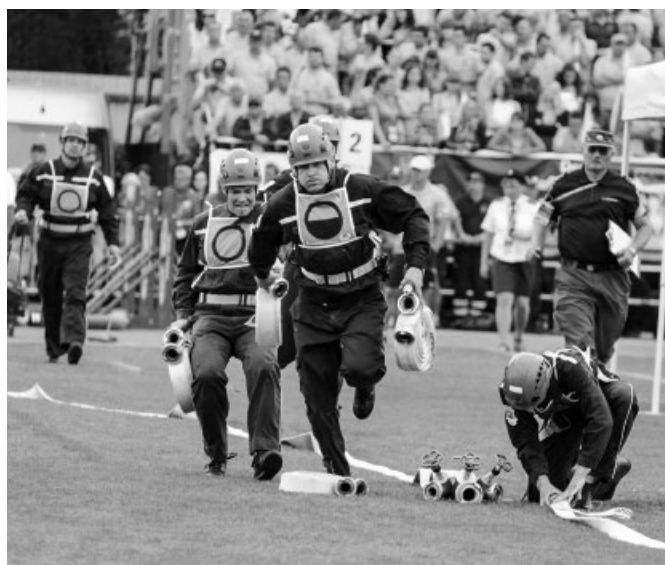
Tým SDH Vlčnov M1 vytváří druhý proud útočného vedení při olympijském pokusu požárního útoku CTIF – stříbrné ocenění