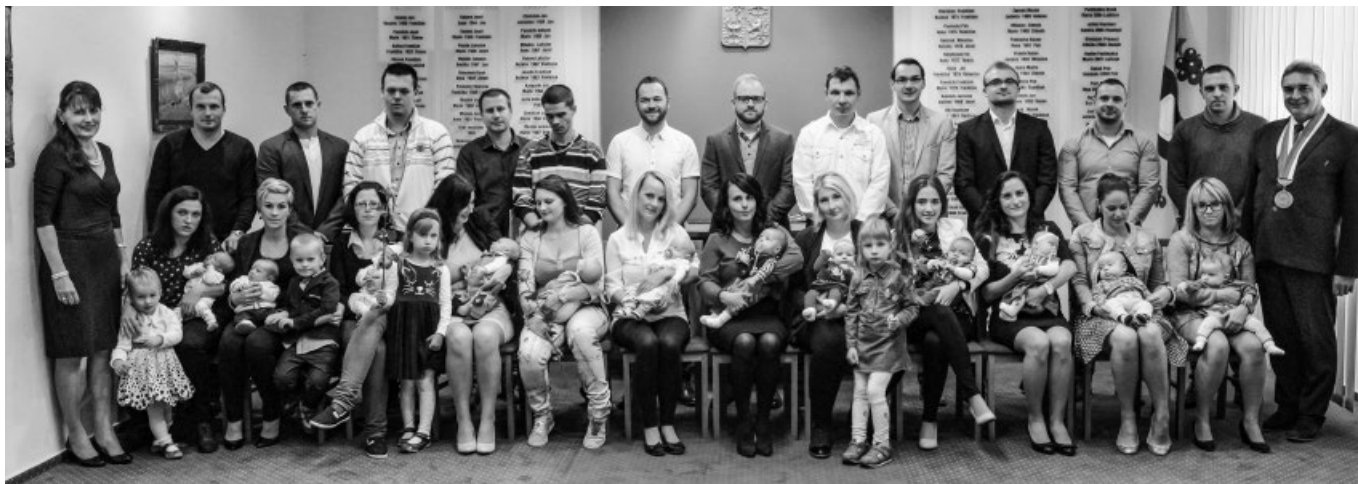
Vítání občanů 24.září 2017