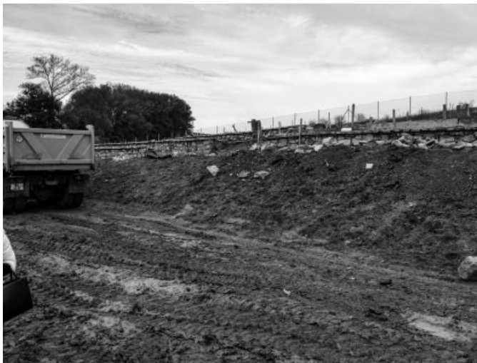
Koupaliště – budoucí terasy na opalování