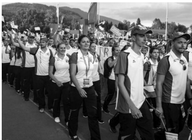
Členové a členky vlčnovské výpravy, jako součást výpravy České republiky při slavnostním defilé na zahájení olympiády ve Villachu – 12. 7. 2017