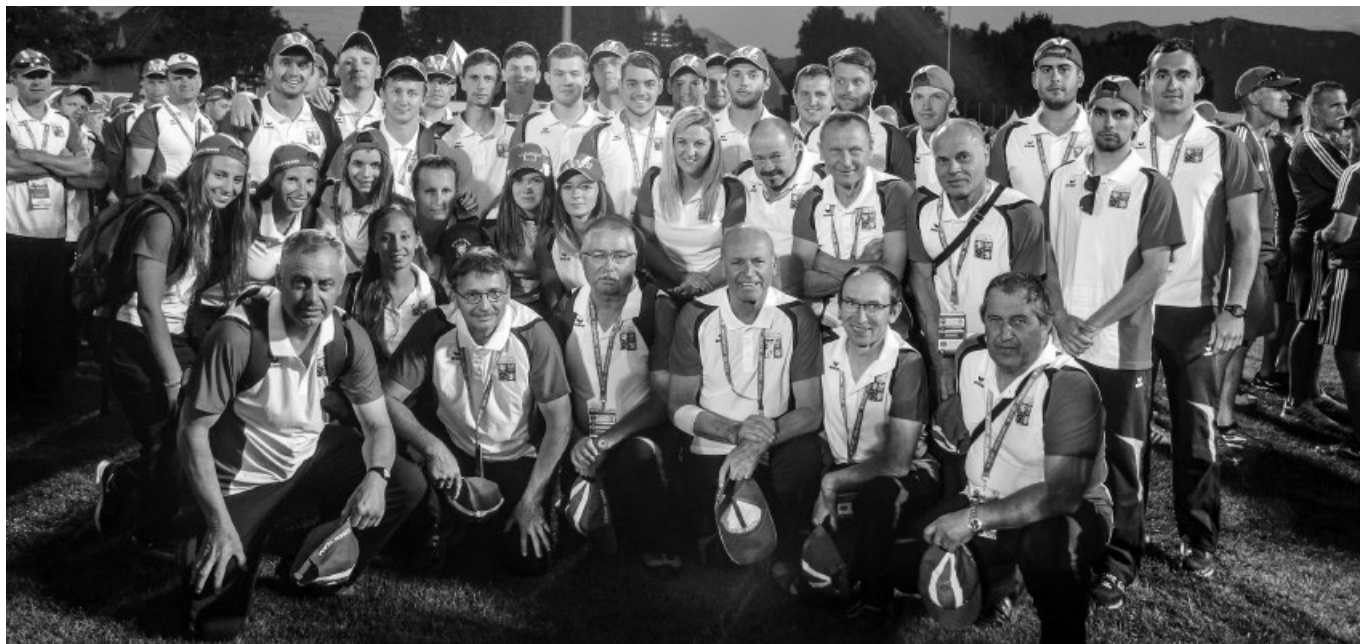
Výprava vlčnovských hasičů (M1, M2, M3 a ženy) jako součást české výpravy při ukončení hasičské olympiády

stev, získala naše děvčata lichotivé a zcela zasloužené stříbrné ocenění.