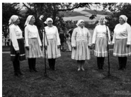
Hodové zpívání, VBU