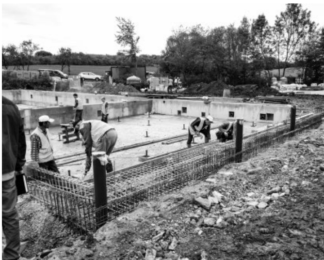
Koupaliště – plavecký bazén