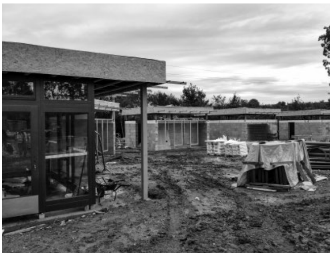
Koupaliště – plavčíkárna a toalety