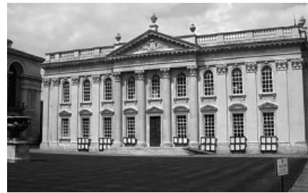
Během promoce se nesmí fotit, příkládám alespoň fotku Senate House