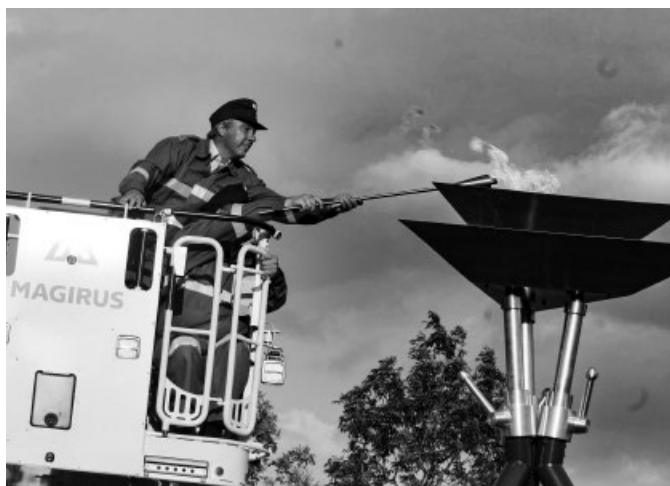
Postižený rakouský hasič na invalidním vozíku zapaluje olympijský oheň při zahájení hasičské olympiády CTIF 12. 7. 2017 ve Villachu