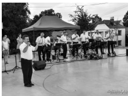
Setkání u DH