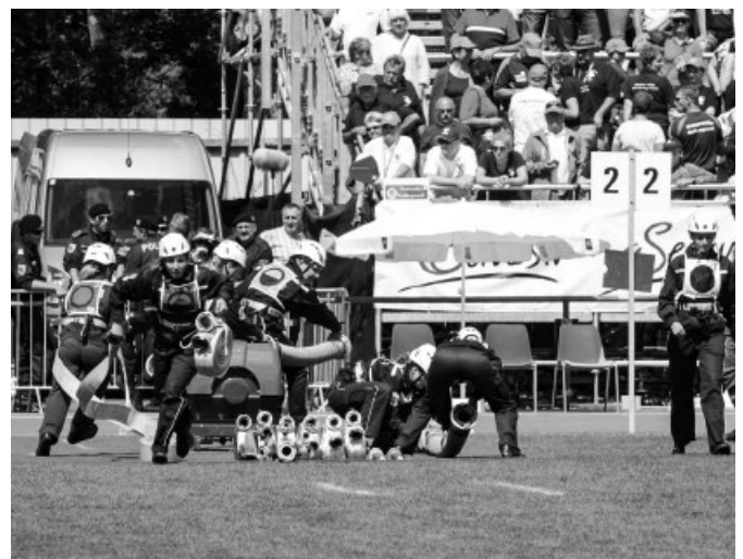
Členky SDH Vlčnov ženy rozbíhají při olympijském pokusu požárního útoku CTIF – stříbrné ocenění