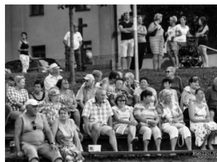
Setkání u DH