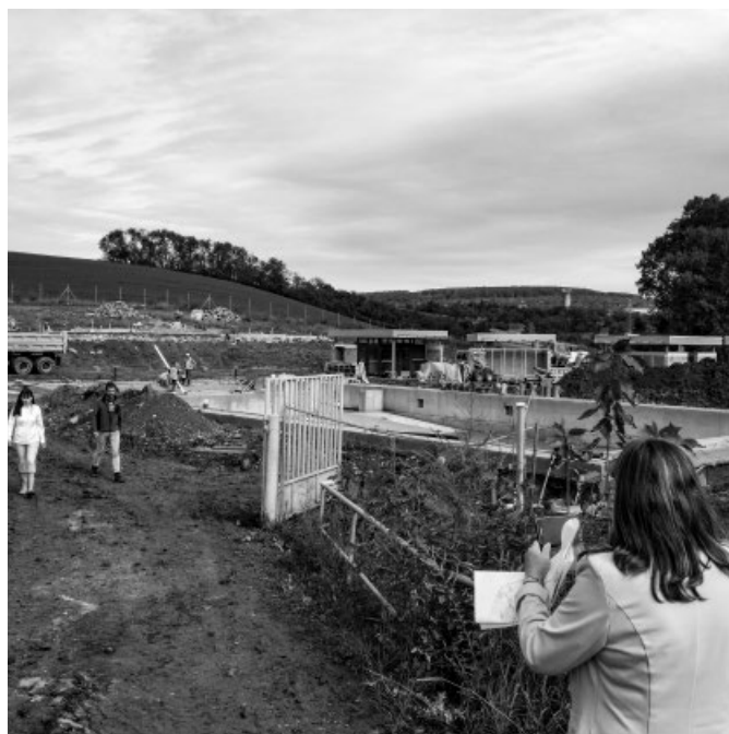
Koupaliště – celkový pohled