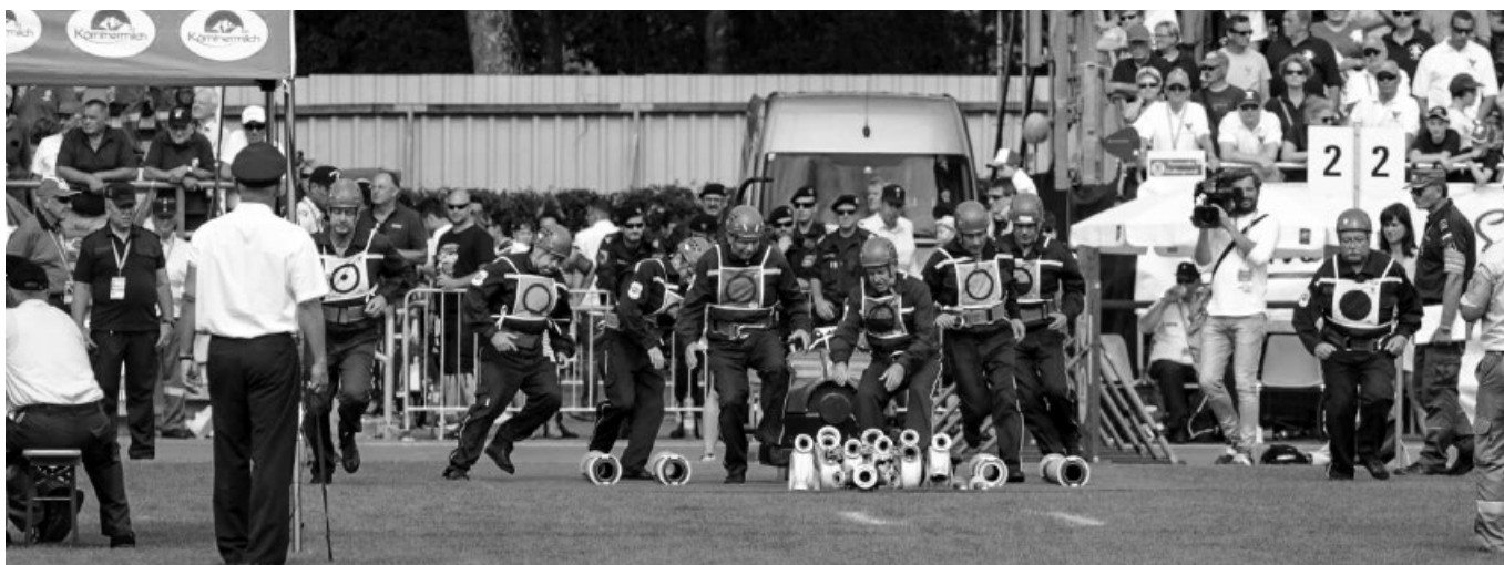
Členové nejstaršího týmu na olympiádě SDH Vlčnov M3 rozbíhají při olympijském pokusu požárního útoku CTIF – stříbrné ocenění