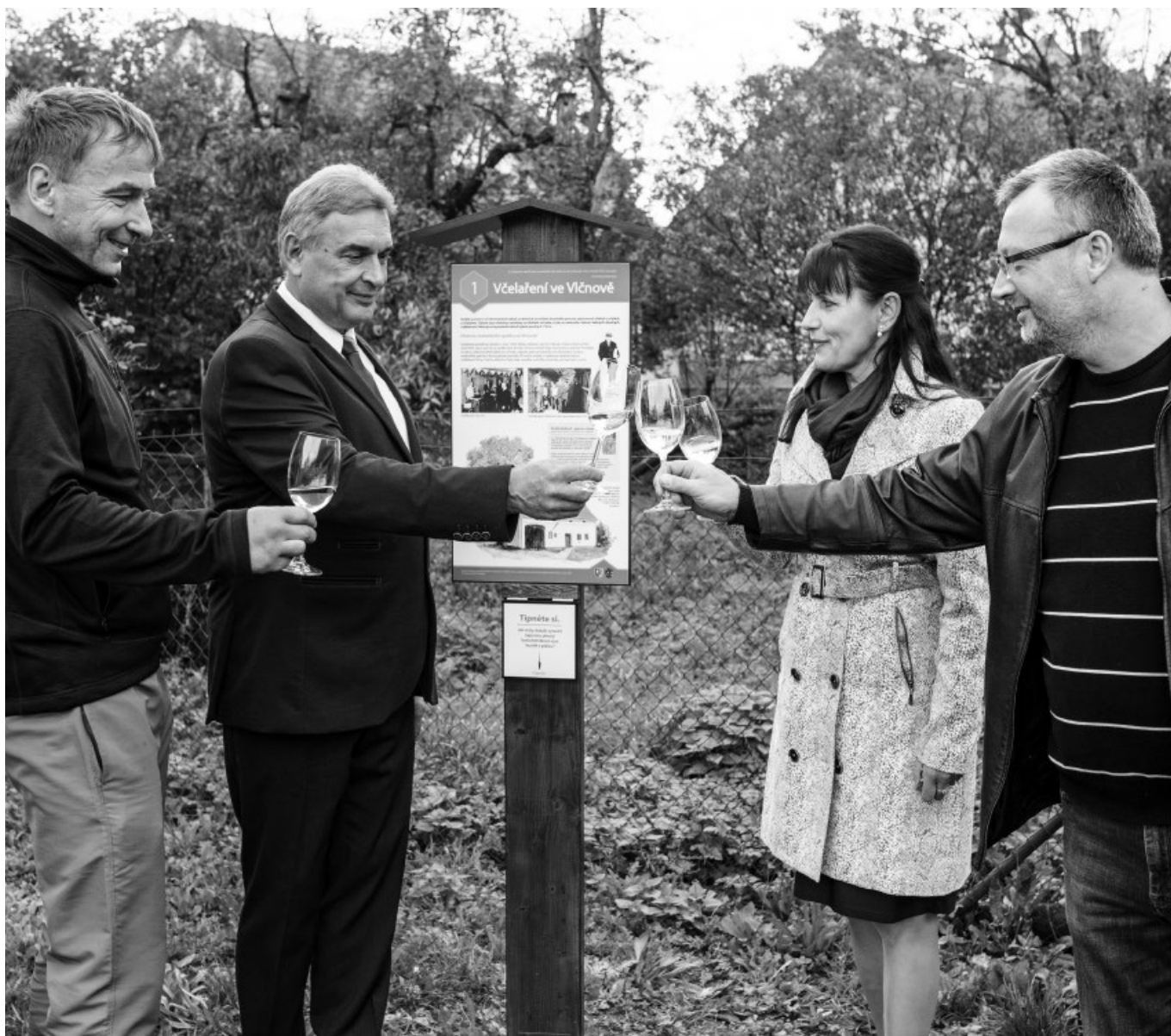
Ve Vlčnově byla slavnostně otevřena naučná stezka včelařů