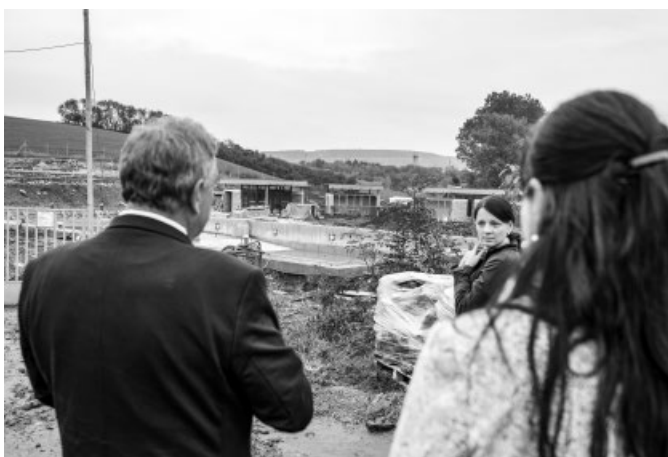
Prohlídka rekonstrukce koupaliště