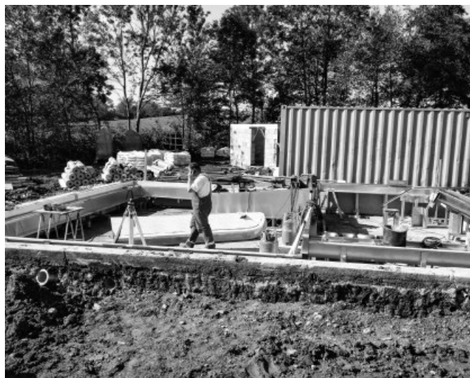
Koupaliště – dětský bazén