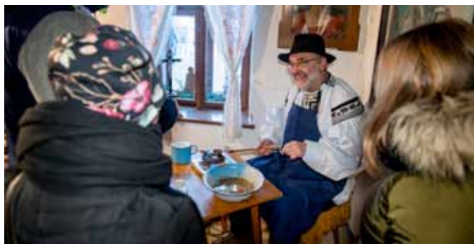
Tradiční Vánoce ve Vlčnově, 9. 12. 2023