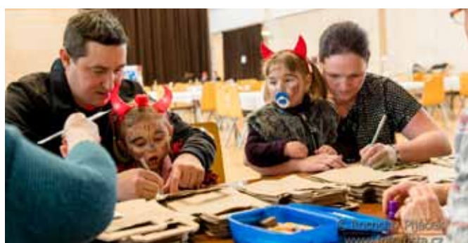
Mikulášské odpoledne, 3. 12. 2023