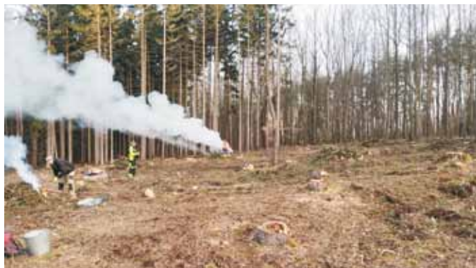
pálení v lese