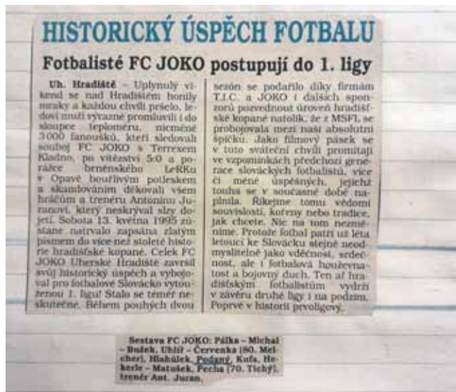
UH v první lize