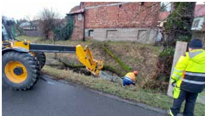
pomoc při vytažení dřeva