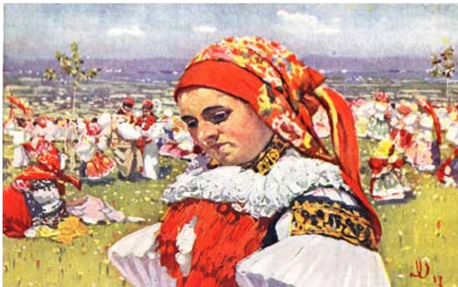
Joža Uprka - Vlčnovjanka

Dodejme, že Galerie Joži Uprky v Uherském Hradišti disponuje u nás