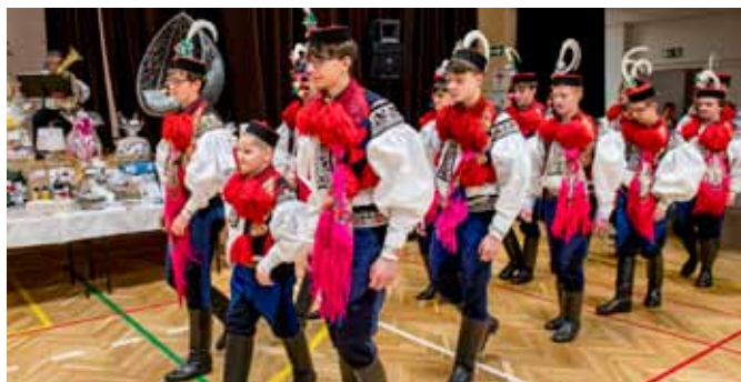
Krojový ples s představením krále, 27. 1. 2024