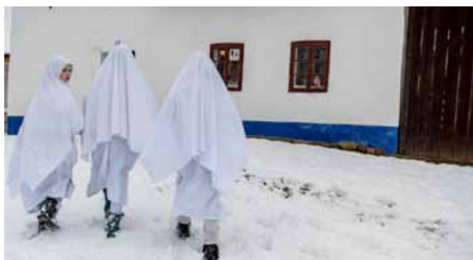
Tradiční Vánoce ve Vlčnově, 9. 12. 2023