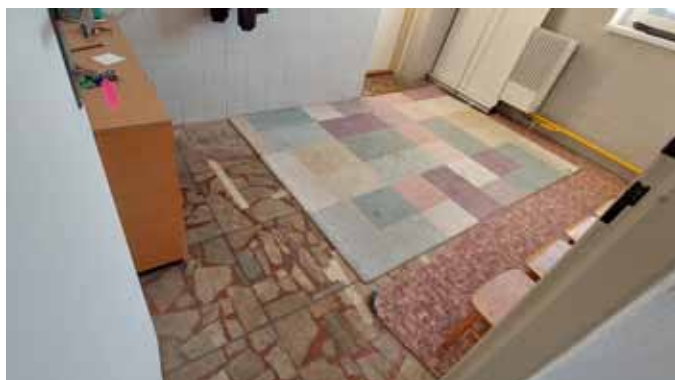
šatna Broučků před