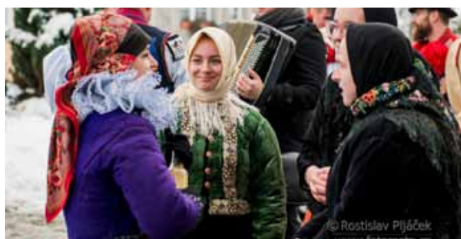
Tradiční Vánoce ve Vlčnově, 9. 12. 2023