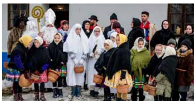
Tradiční Vánoce ve Vlčnově, 9. 12. 2023