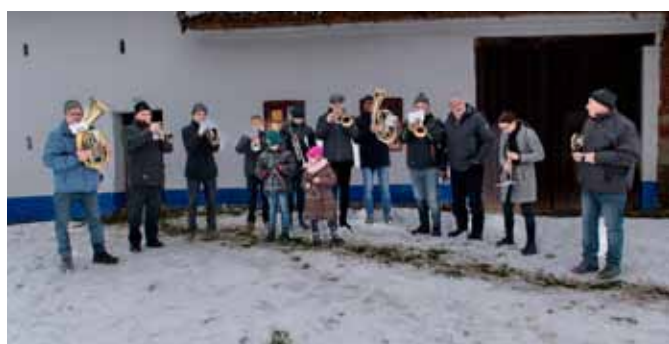
Tradiční Vánoce ve Vlčnově, 9. 12. 2023