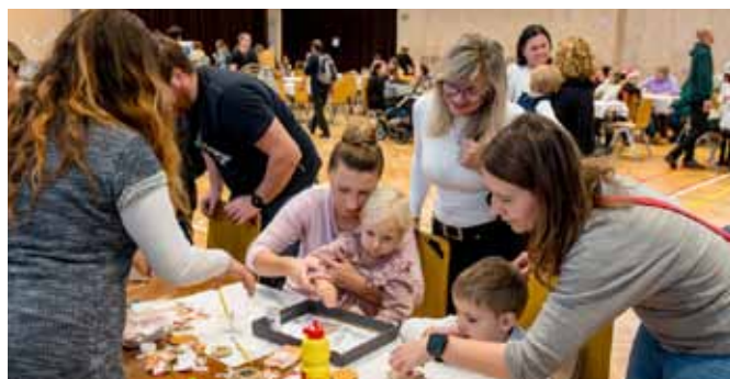
Mikulášské odpoledne, 3. 12. 2023