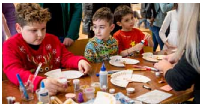
Mikulášské odpoledne, 3. 12. 2023