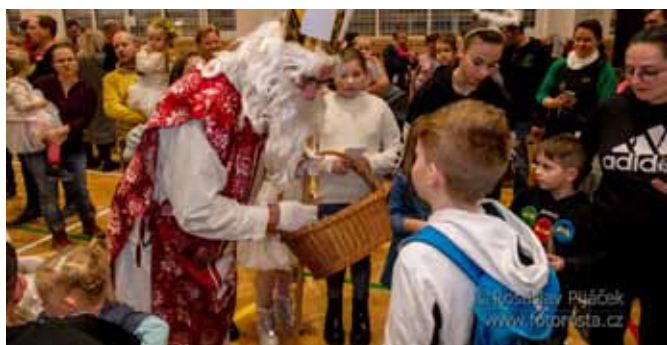
Mikulášské odpoledne, 3. 12. 2023