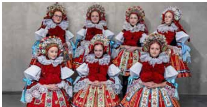
Krojový ples s představením krále, 27. 1. 2024