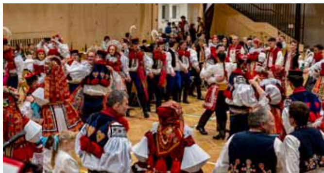
Krojový ples s představením krále, 27. 1. 2024