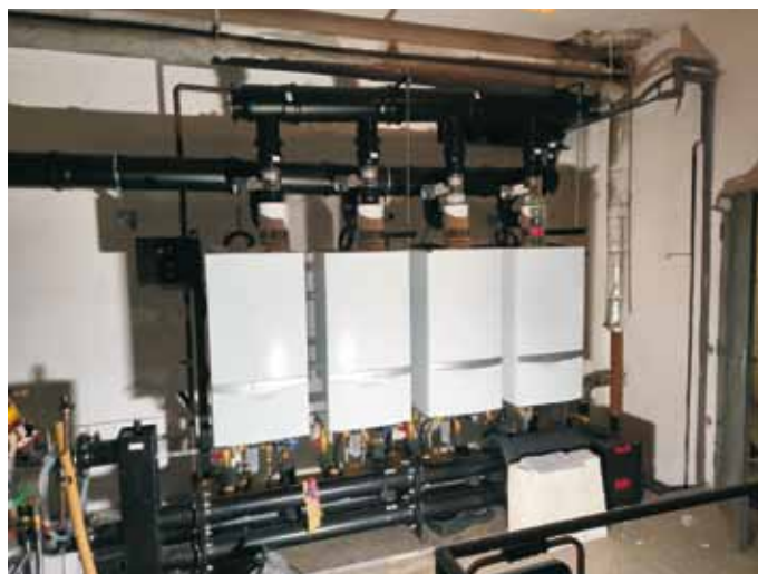
kotelna ZŠ - nové kotle