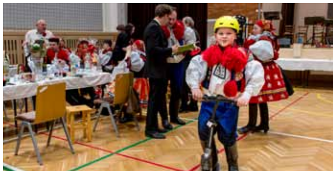
Krojový ples s představením krále, 27. 1. 2024