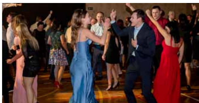
Sportovní ples, 20. 1. 2024