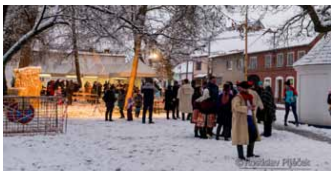
Tradiční Vánoce ve Vlčnově, 9. 12. 2023