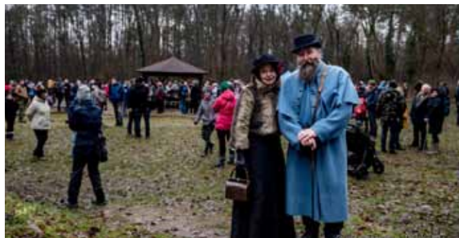
Silvestrovské setkání na Pepčíně, 31. 12. 2023