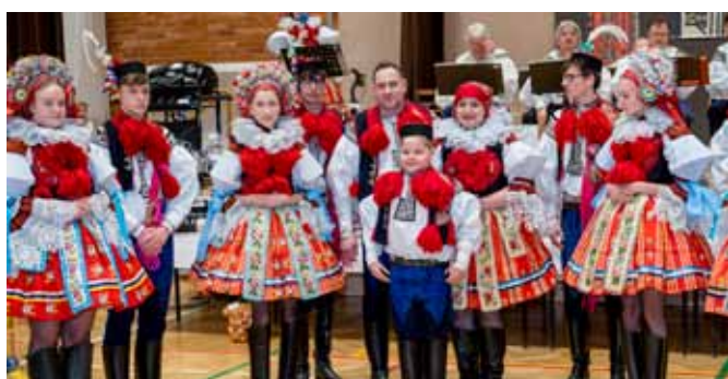
Krojový ples s představením krále, 27. 1. 2024