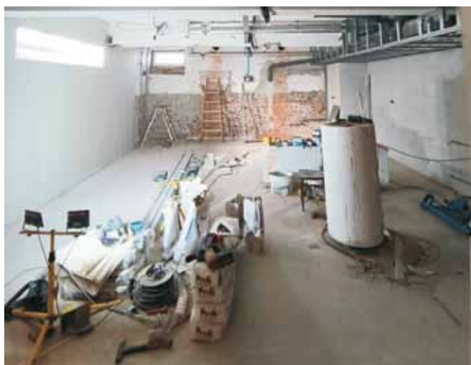
místnost ve sklepě KSK