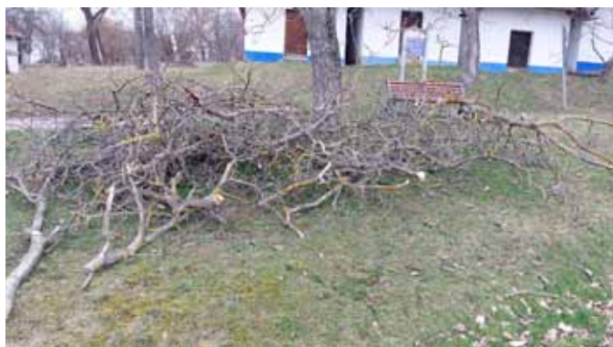
ořez ořechů budy