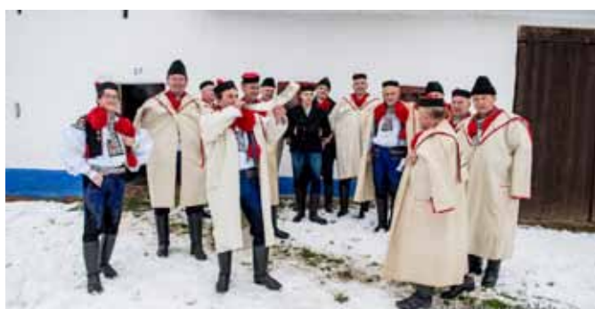
Tradiční Vánoce ve Vlčnově, 9. 12. 2023