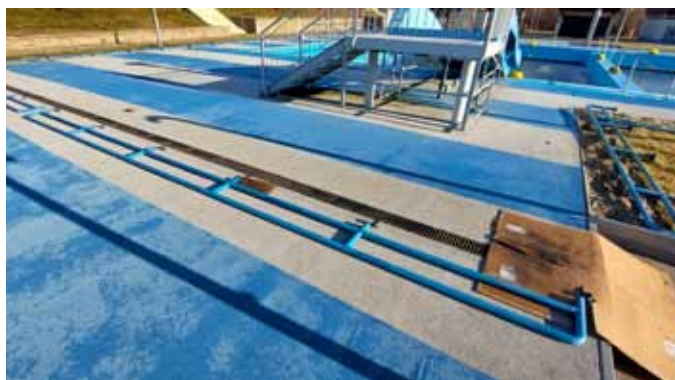
zábradlí na koupališti