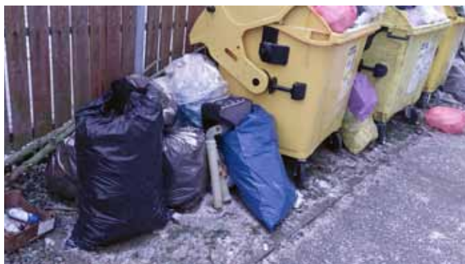
tak takto ne