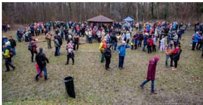
Silvestrovské setkání na Pepčíně, 31. 12. 2023