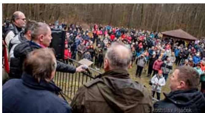
Silvestrovské setkání na Pepčíně, 31. 12. 2023