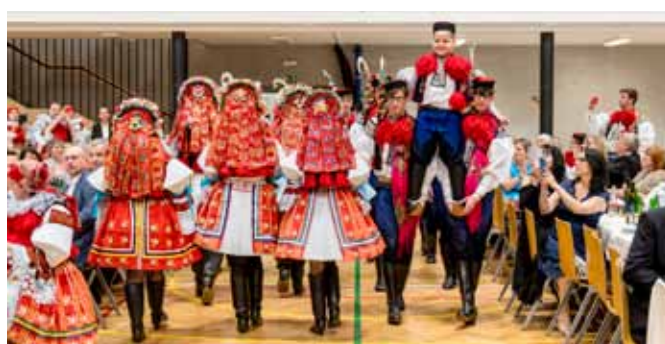
Krojový ples s představením krále, 27. 1. 2024