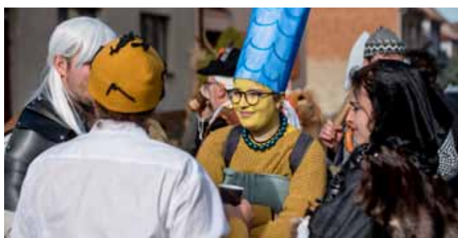
Fašanková obchůzka, 10. 2. 2024