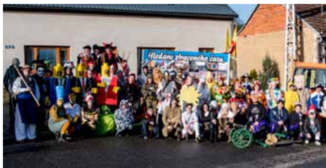
Fašanková obchůzka, 10. 2. 2024