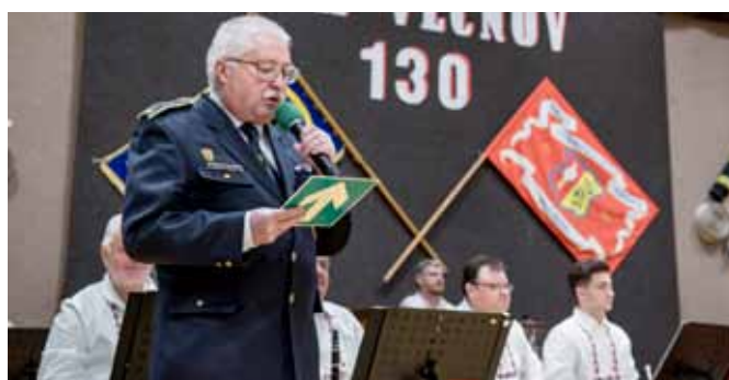
Hasičský bál, 3. 2. 2024