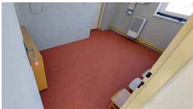
šatna Broučků po