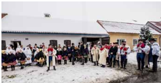
Tradiční Vánoce ve Vlčnově, 9. 12. 2023