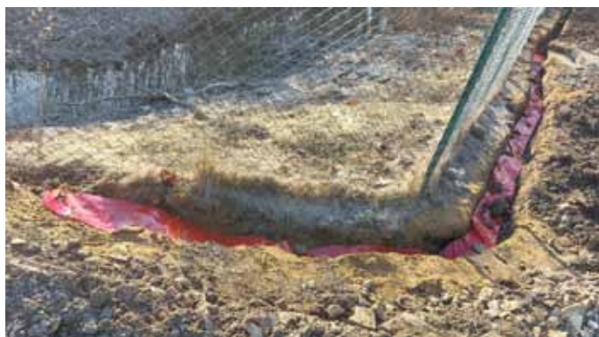
výkop na koupališti