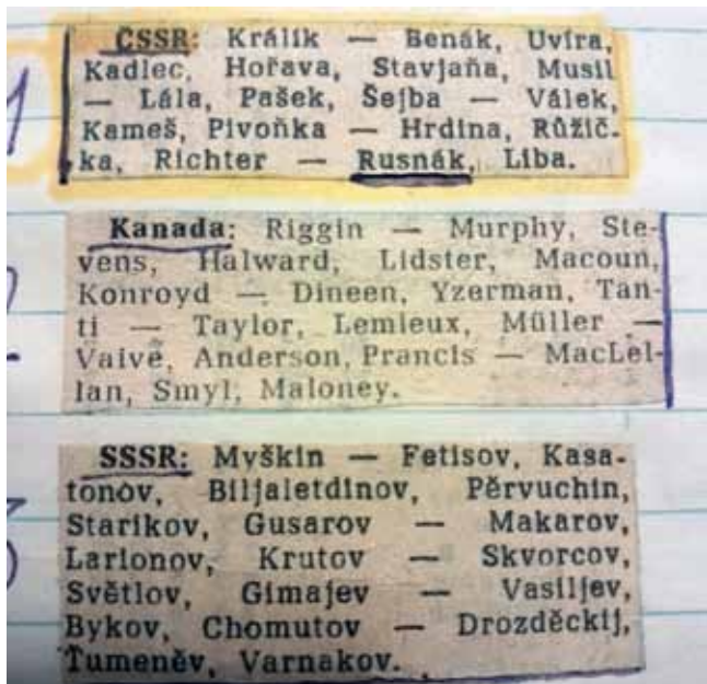
Sestavy v hokeji MS 1985

A potom bylo mistrovství světa v hokeji, nevím kde, a já sem napsal Vichnarovi, komentoval hokej. Lesti by mě něco nemohl, že má ten přístup do kabin. Ale poslal mně, čoveče, podepsanú celú fotku našich – hokejisty. Že sa omlúvá, ale jinde takový přístup do kabin nemá. A fandil mně, že mám takový zájem.