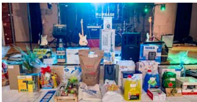
Sportovní ples, 20. 1. 2024