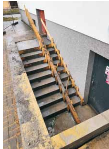
nové schody u KSK