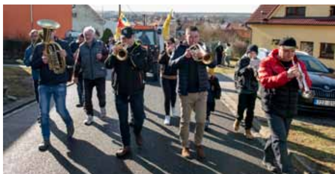
Fašanková obchůzka, 10. 2. 2024