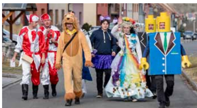
Fašanková obchůzka, 10. 2. 2024