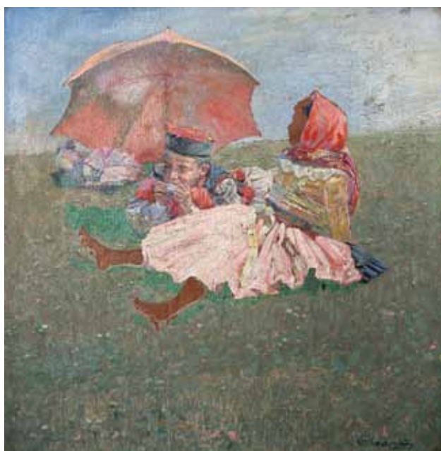
Otto Ottmar - S deštníkem