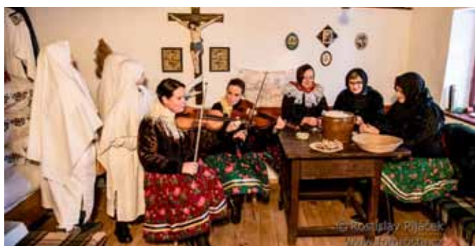
Tradiční Vánoce ve Vlčnově, 9. 12. 2023