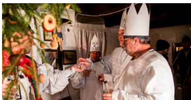
Tradiční Vánoce ve Vlčnově, 9. 12. 2023