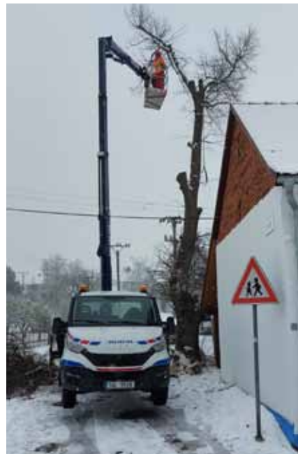
kácení lípy u včelařů