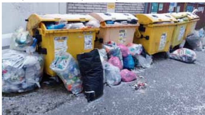
tak takto ne