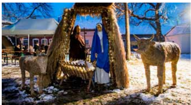
Tradiční Vánoce ve Vlčnově, 9. 12. 2023