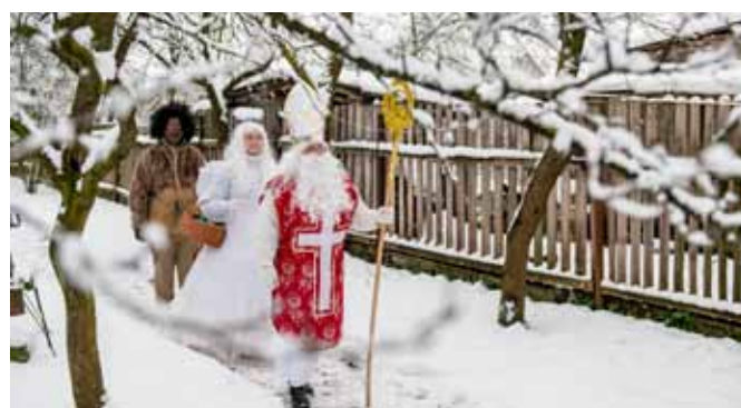
Tradiční Vánoce ve Vlčnově, 9. 12. 2023