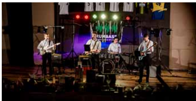
Sportovní ples, 20. 1. 2024