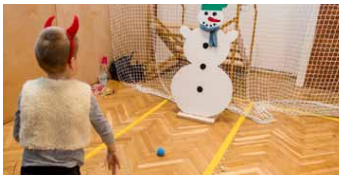
Mikulášské odpoledne, 3. 12. 2023