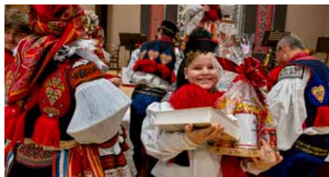
Krojový ples s představením krále, 27. 1. 2024