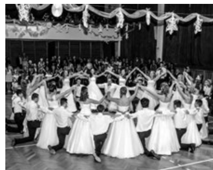
Polonézu tancovali žáci 9. třídy