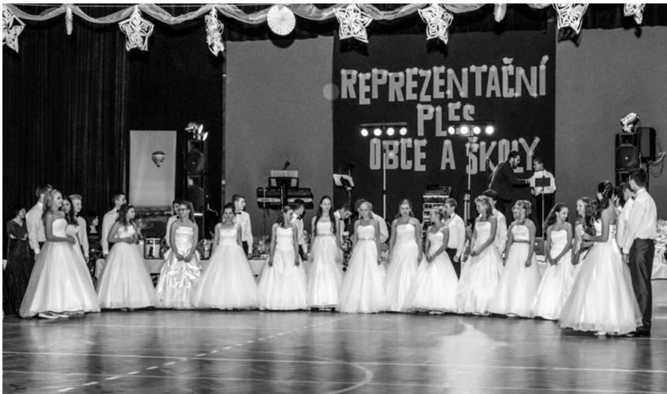
Hlavní účastníci plesu