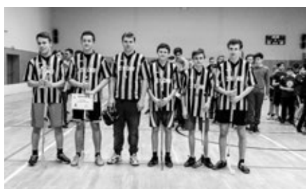
Starší žáci obsadili ve florbalu 3. místo