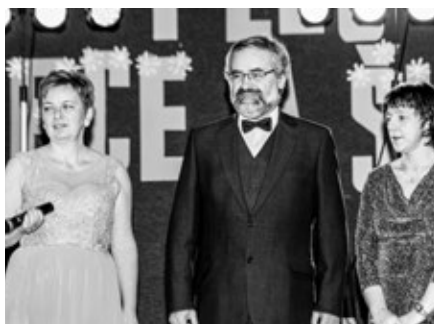
Ples uvedla ředitelka školy, starosta obce a předsedkyně SRPŠ