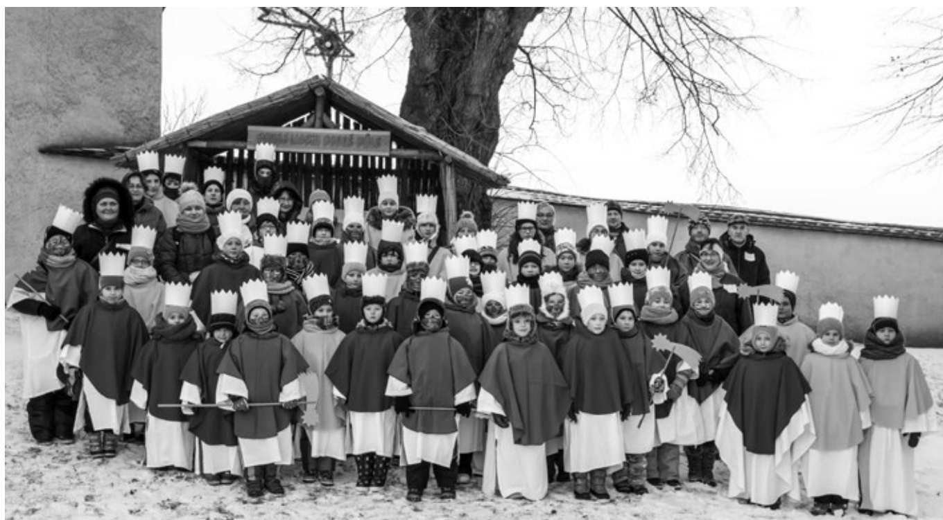
Koledníci tříkrálové sbírky ve Vlčnově

Rozpečetěno 315 z 315 (100%) úředně zapečetěných pokladniček.