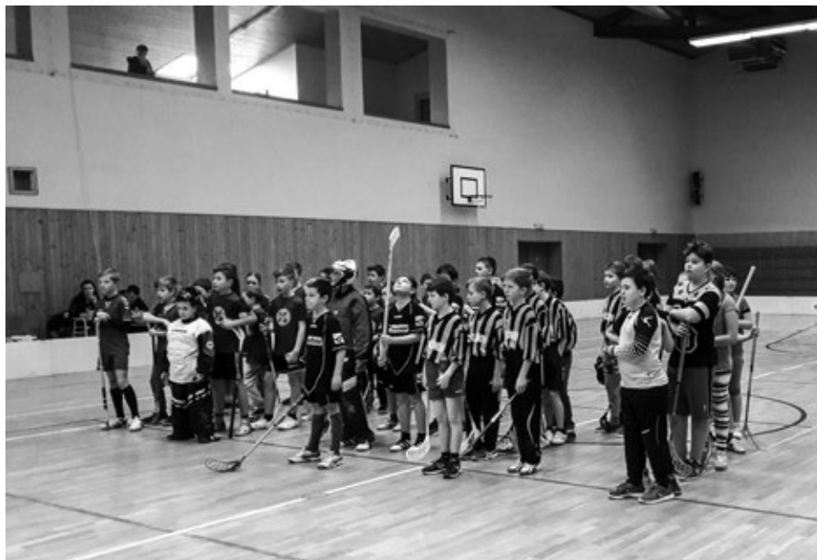
Mladší žáci ZŠ Vlčnov ns florbalovém turnaji v Bánově obsadili 4. místo