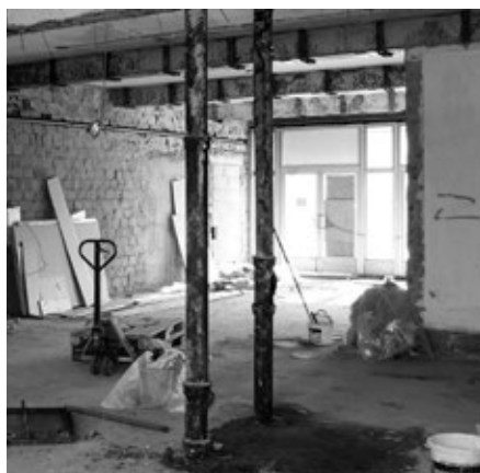
Krček KSK, původní stav po převzetí a začátek rekonstrukce (vpravo)