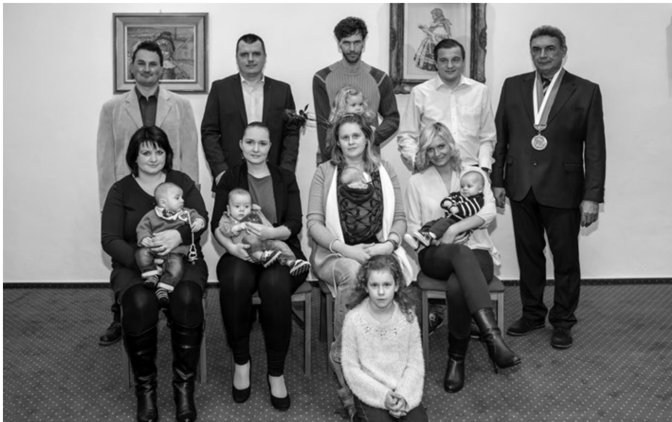
Vítání občánek, březen 2017