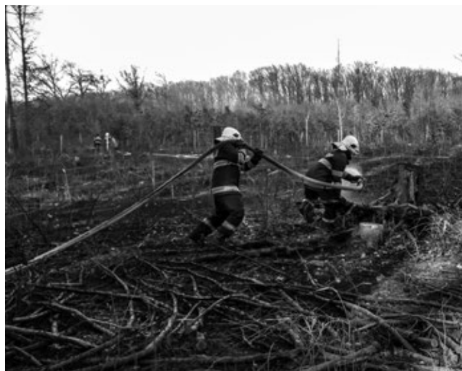
Požár v lese nad búdama