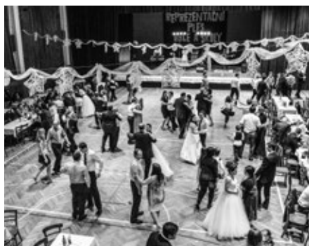
Návštěvnost byla vysoká