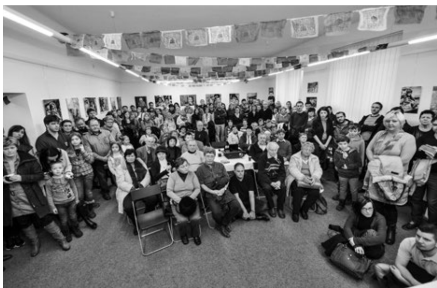
Vernisáž výstavy Úsměvy Nepálu – Galerie při vernisáži