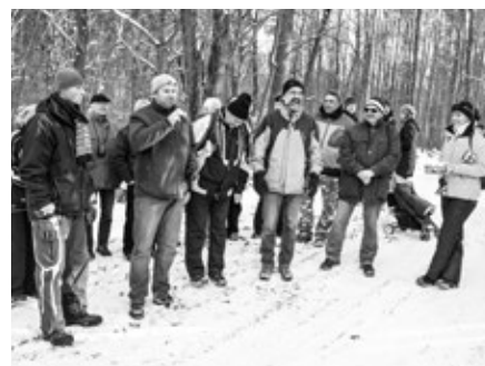
Tradičně se setkali na Pepčíně zástupci obcí