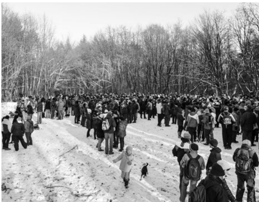
Setkání na Pepčíně – krásné počasí vylákalo na Pepčín množství lidí