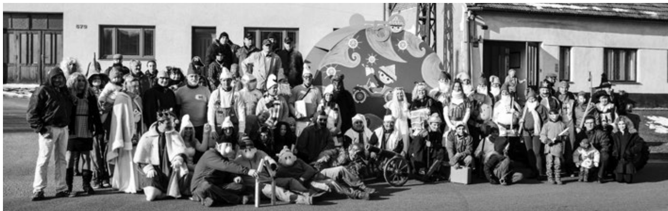
Masopust na téma 50 let Večernička