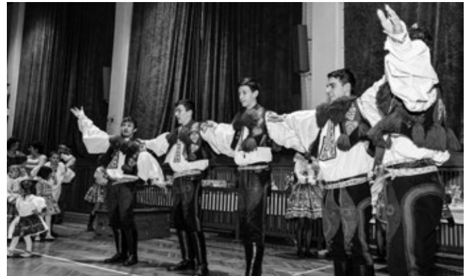
Dětský krojový ples