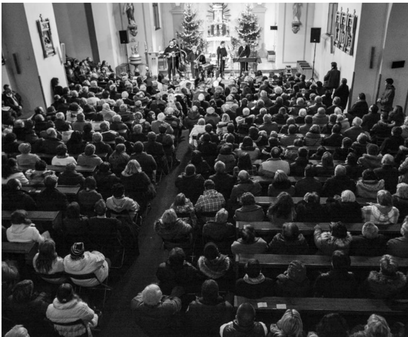
Vánoční koncert Hradištanu – zaplněný kostel