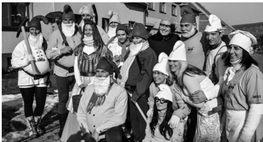
Masopust na téma 50 let Večernička