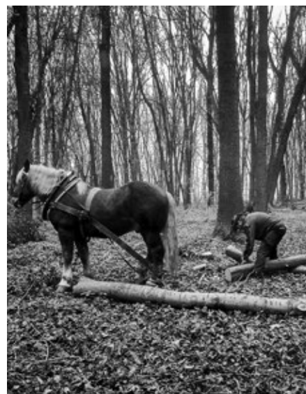
Stahování dřeva z Hájku