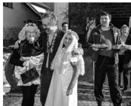
Masopust na téma 50 let Večernička