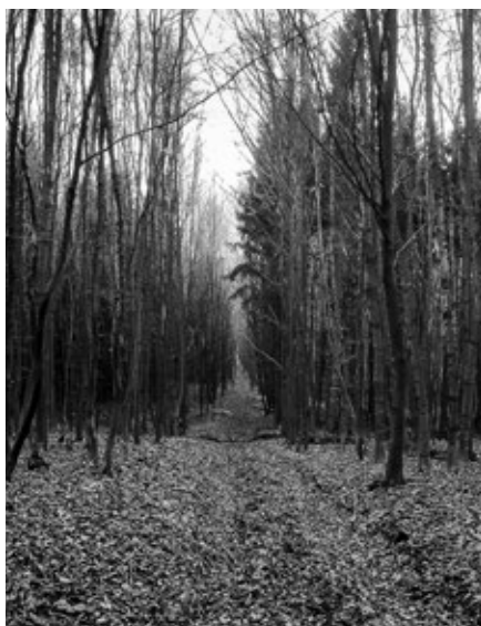
Přírodní rezervace Vlčnovský háj

Ročně se těží přibližně 400 m 3 dřeva. Vzniklé plochy pro mýtních těžbách představují asi 0,70 ha. Tyto plochy se musí do dvou let zalesnit množstvím cca 7000 ks sazenic.