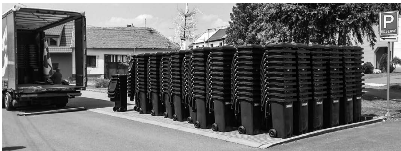
Pořízení odpadových nádob