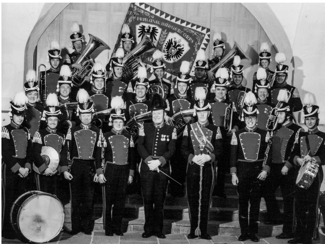
Dechová hudba z Halleinu