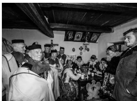
V domě č. 57