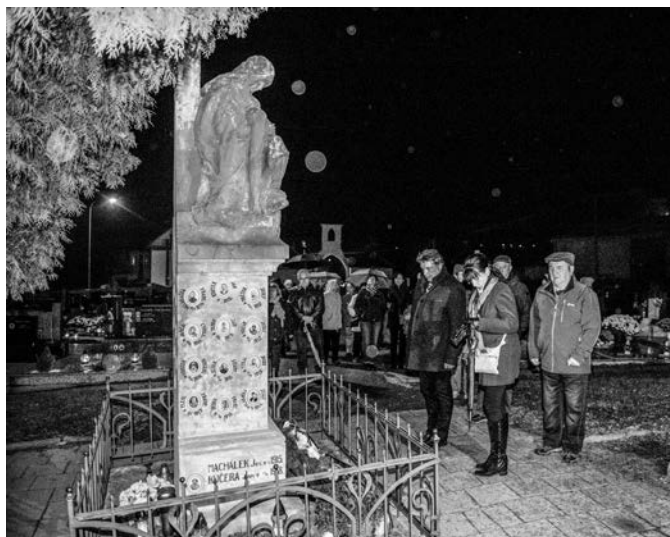
Kladení věnců u pomníku obětem 1. světové války