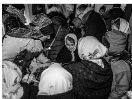
Koledníci v muzeu