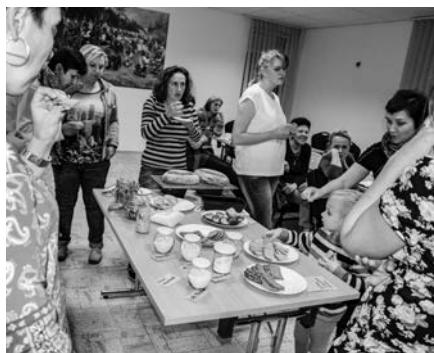
Povídání o kvásku

Pokud máte nápad o čem bychom si mohli pobesedovat a ukázat něco zajímavého, přivítáme rádi Vaše návrhy.