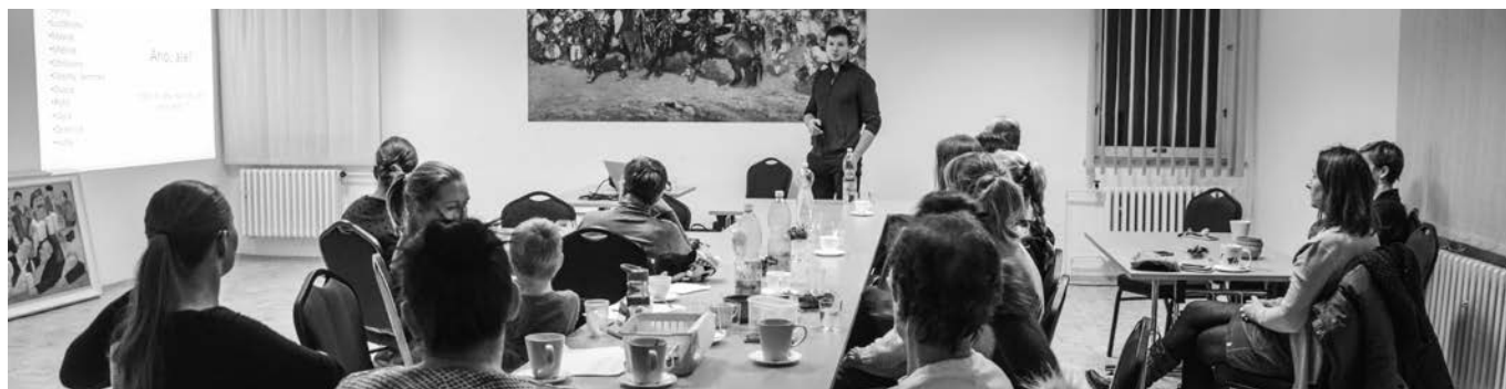
Povídání o tom, jak jest jak se patří