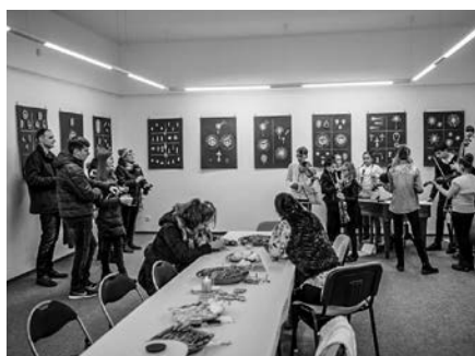
Vystoupení CM Vlčci na Galerii