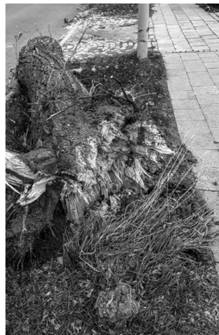
Lipa na horním konci vyrácená při vichřici