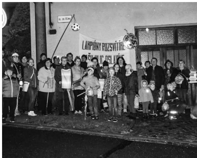
Ulice 28. října (Srabe) oslavila 28. říjen