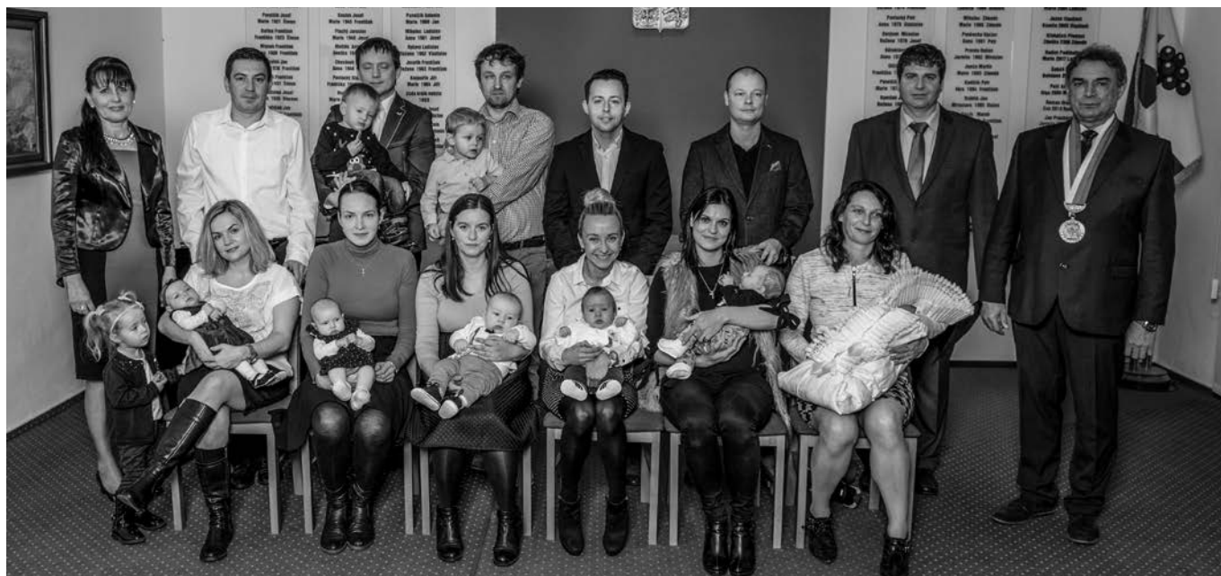
Vítání občánků, prosinec 2018