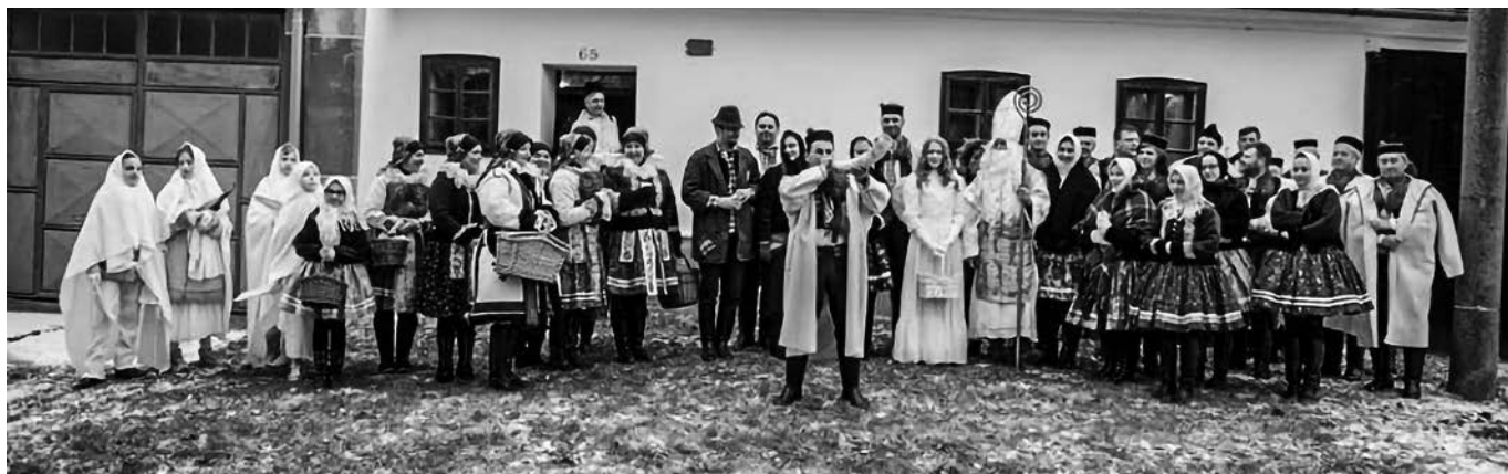
Tradiční Vánoce – účinkující