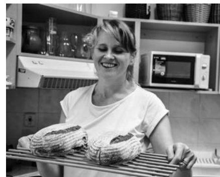
Povídání o kvásku