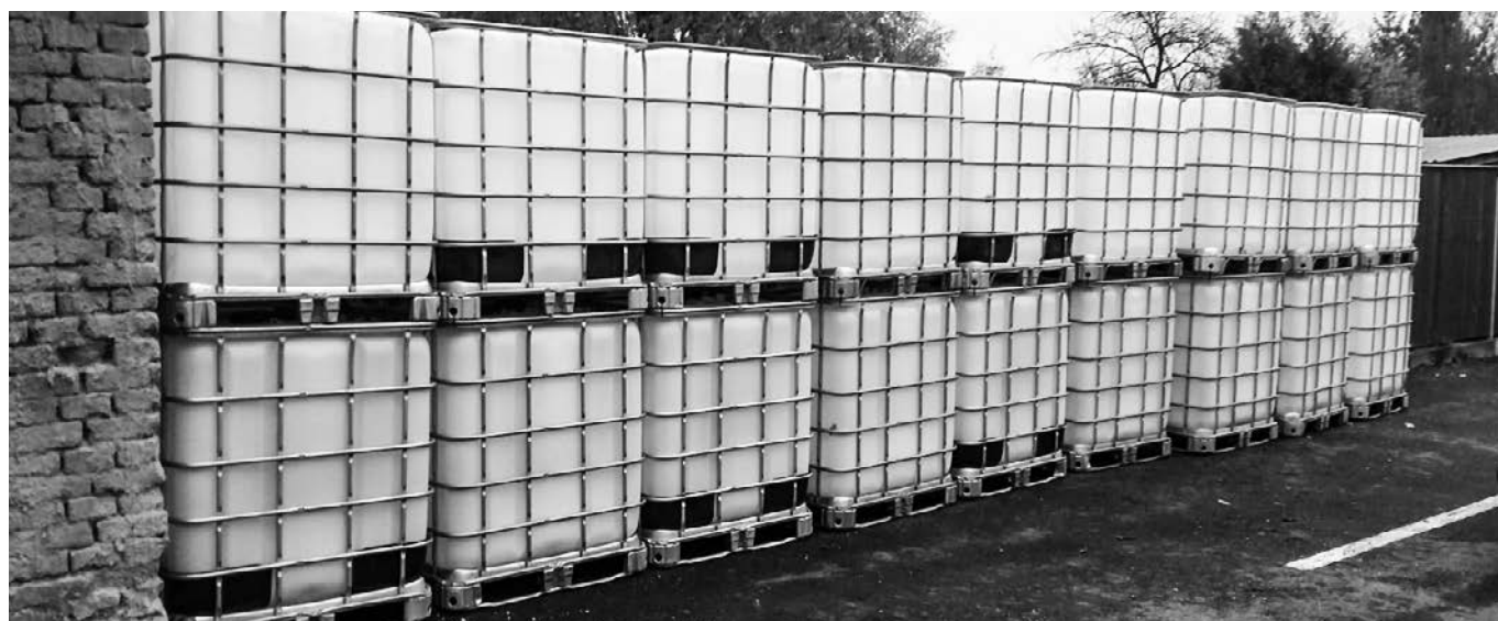
Pořízení akumulačních nádrží na dešťovou vodu