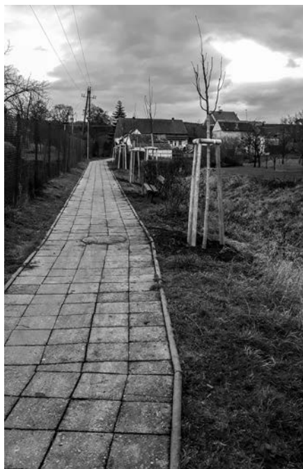
Alej jeřabin, směr Rybníček