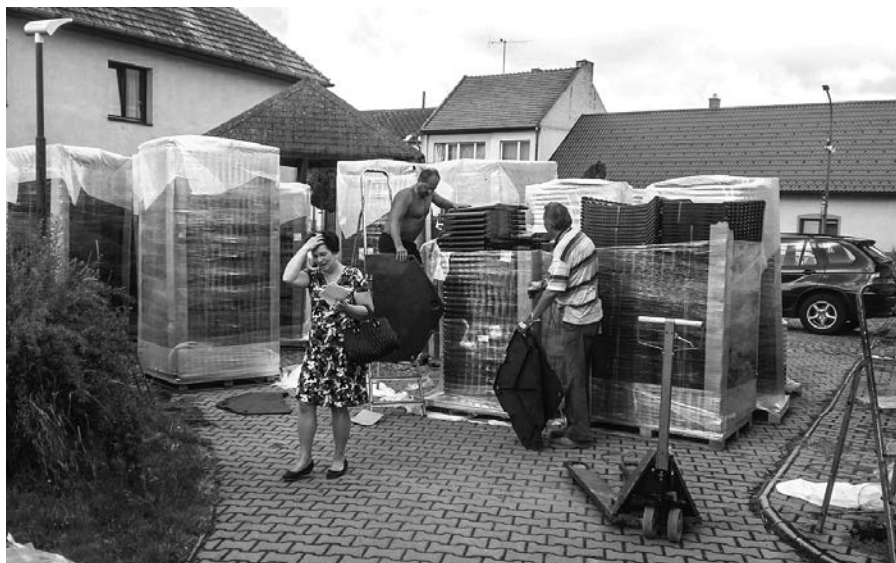
Pořízení kompostérů 2017

Děkujeme všem občanům mikroregionu Východní Slovácko za jejich zájem a spolupráci při realizaci všech společných aktivit, nejen ekologických. Věříme, že se nám i v budoucnu bude dařit hledat a uskutečňovat nové užitečné projekty.