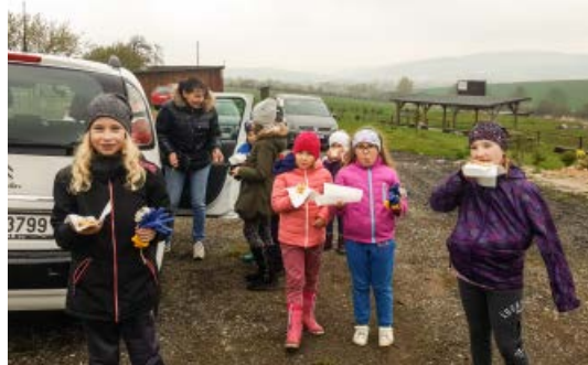
Svačina od paní místostarostky – nejlepší buchta na světě