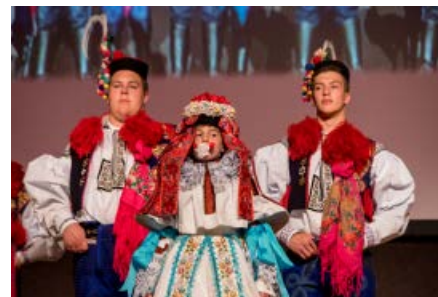
Předání vlády králů