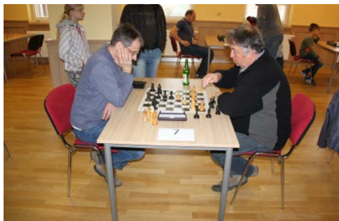
Šachový turnaj v Suché Lozi