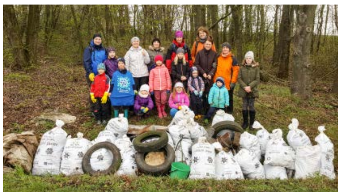
Toto všechno jsme posbírali!