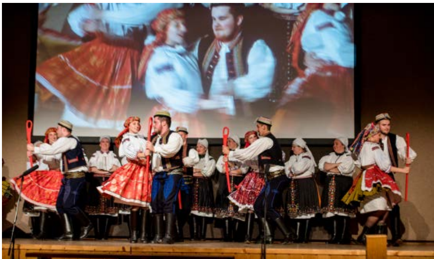
Pod šable, aj pod obušky