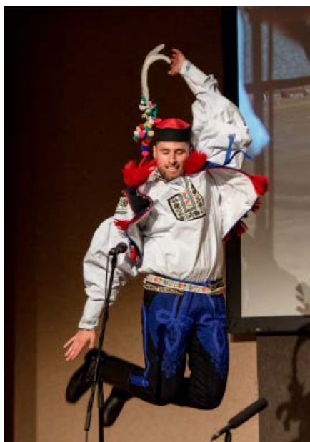
Verbíří z Uherskobrodsko