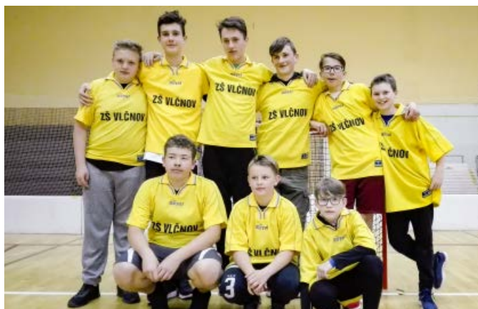
Turnaj ve florbalu, Bánov, družstvo žáků ZŠ Vlčnov