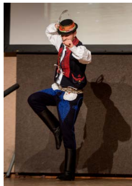
Verbíří z Uherskobrodsko