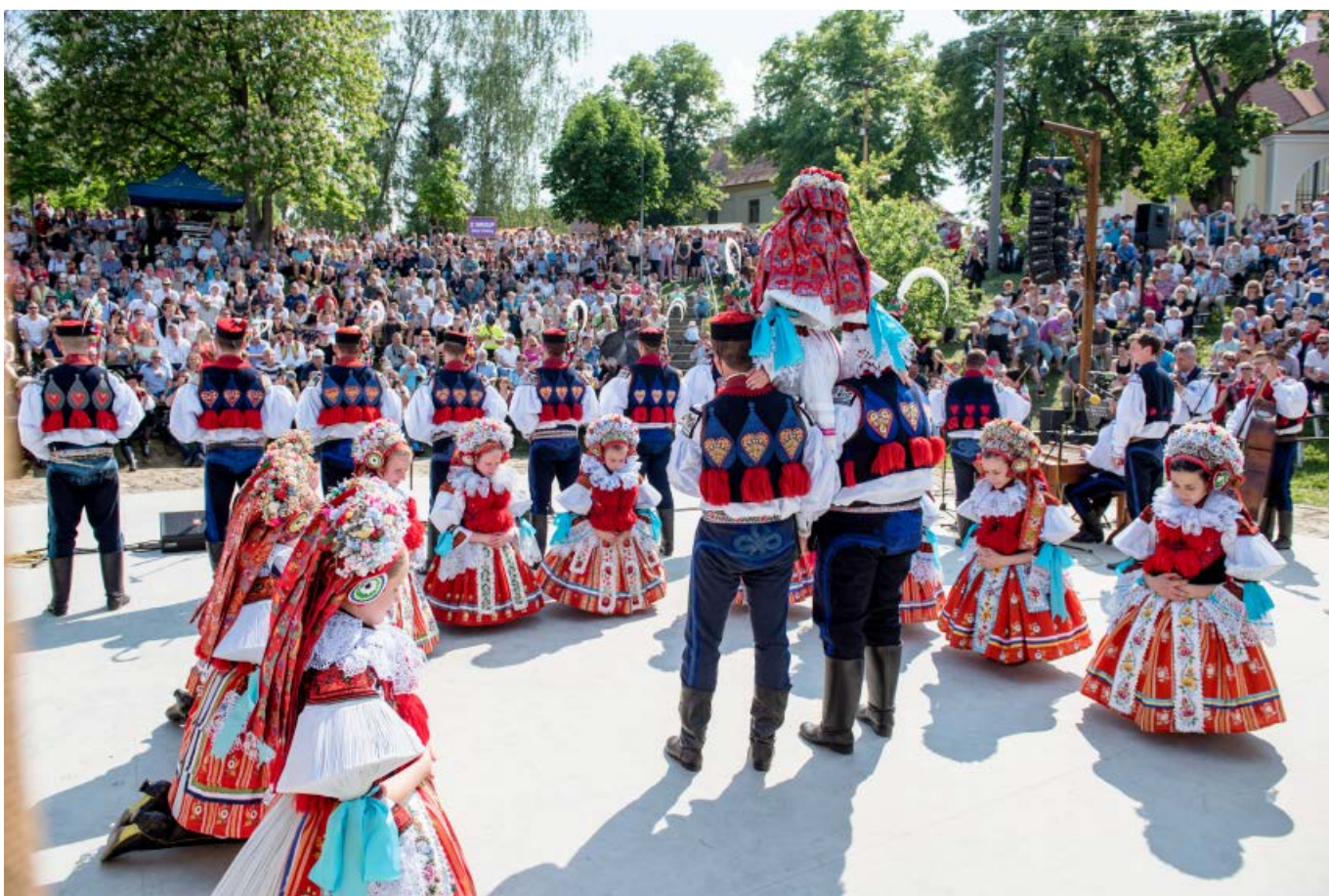
Závěrečné představení krále - pořad Královský vínek