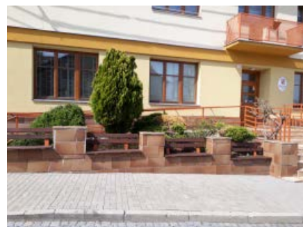
Předzahrádka u obecního úřadu, původní stav nahoře, dole současný stav.