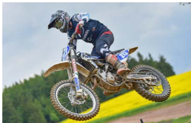
Závod v Dalečíně

www.ceskatelevize.cz/ivysilani/10207469169-svet-motoru/219471291269062-nm-cr-v-motokrosu-pacov