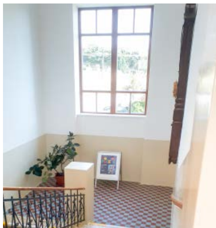
... po výměně okna a úpravě stěn