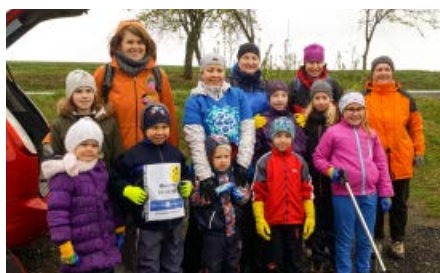
Hurá, poďme na to!

Děkujeme všem, kterým není lhostejné naše okolí a doufáme že se z této akce stane tradice. Příští rok ji určitě opět zopakujeme, pokud tedy víte o nějakém prostoru ve Vlčnově, který by si určitě zasloužil uklidit, neváhejte a dejte nám vědět.