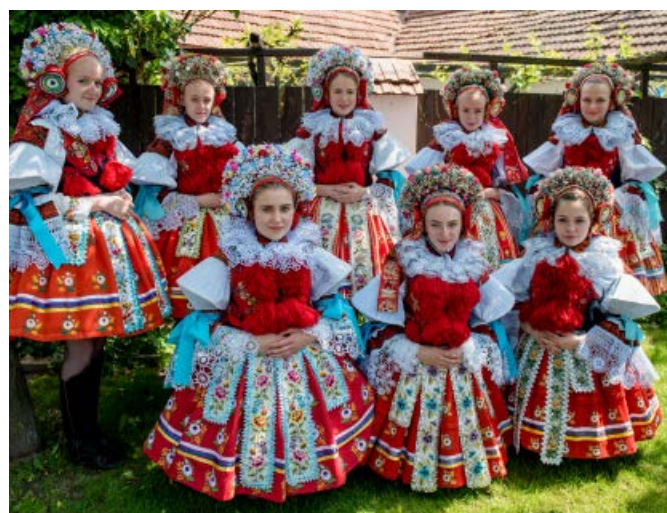
Družice ročníku 2001