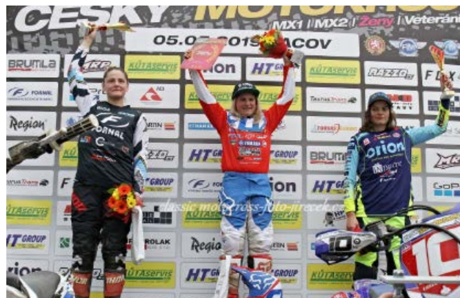
Stupně vítězů, Pacov