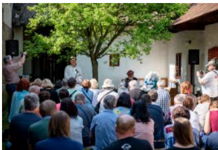
Setkání ve dvoře, čp. 57