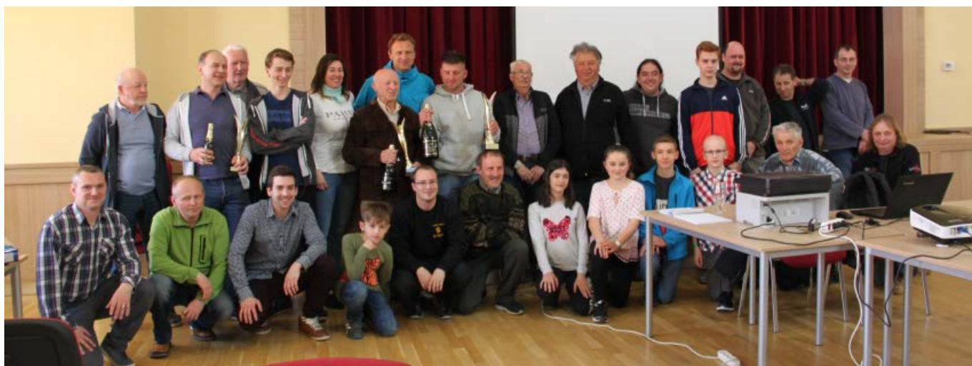
Šachový turnaj v Suché Lozi