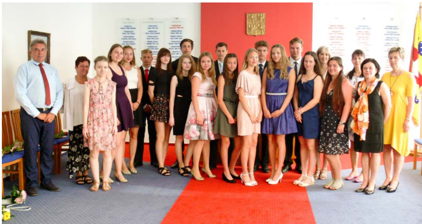
Přijetí žáků deváté třídy v obřadní síni obecního úřadu