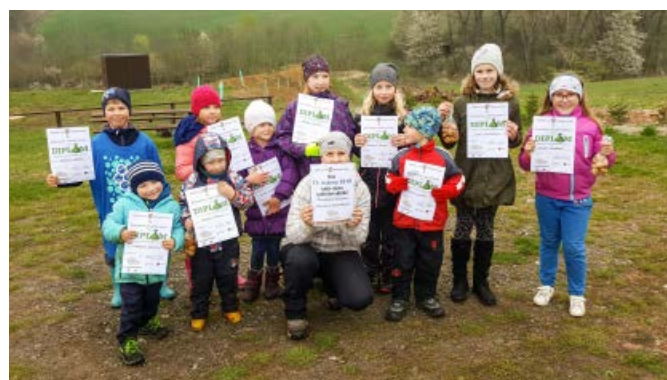
Diplomy pro nejlepší uklízeče