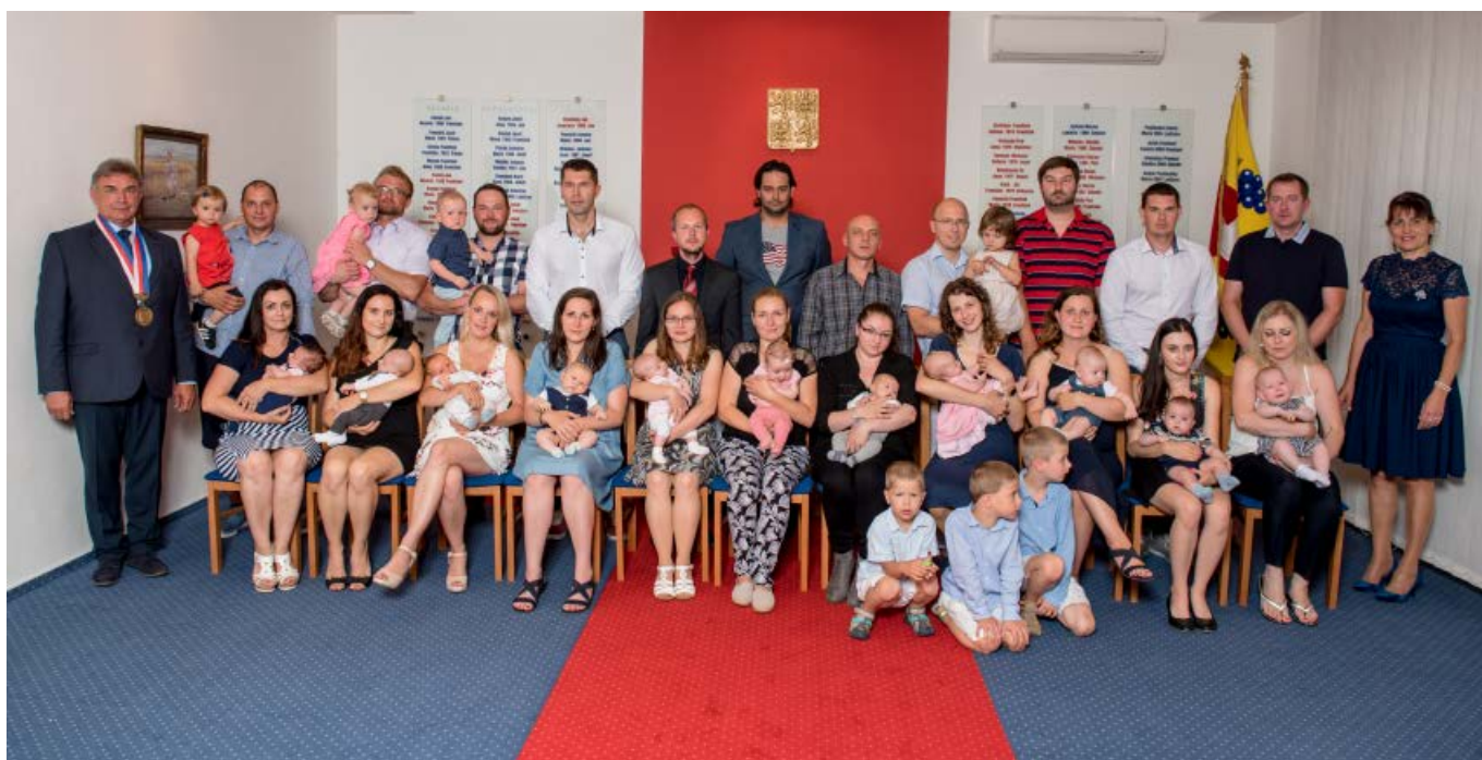
Vitání občánek, červen 2019