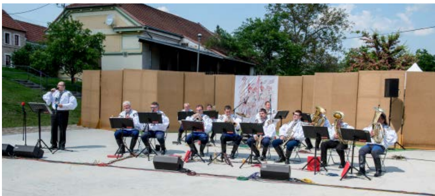
Vitajte ve Vlčnově - koncert DH Vlčnovjané