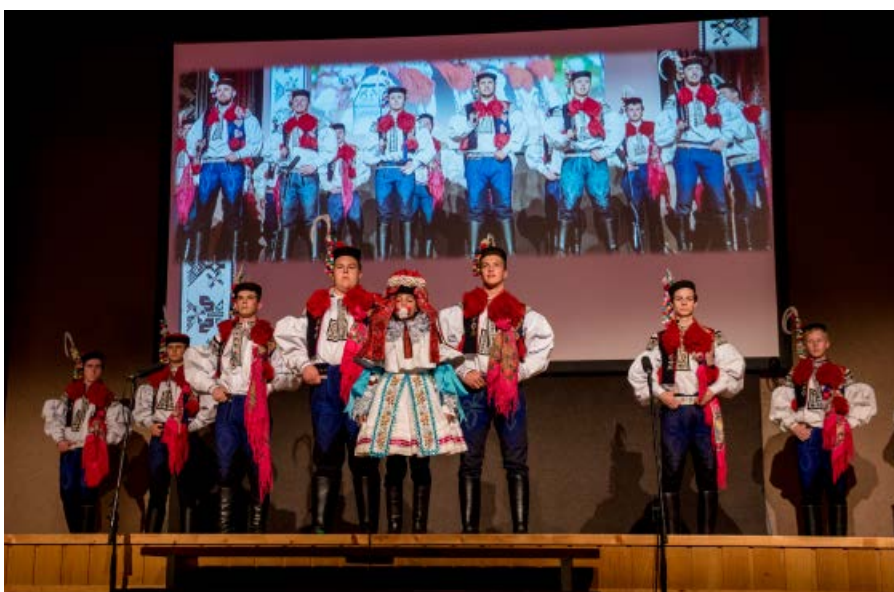
Předání vlády králů