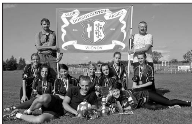
Bronzový kolektiv dorostenek SDH Vlčnov s vedoucími i trenéry