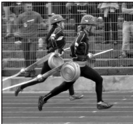
Synchronní „proudařky“ SDH Vlčnov při stříbrném požárním útoku