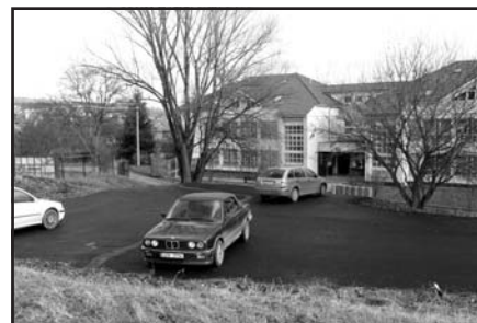
Parkoviště pro obyvatele bytů v nástavbě MŠ