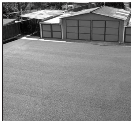
Parkoviště na dvorku za měšťankou