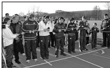
Zástupci sportovních kolektivů SDH Vlčnov