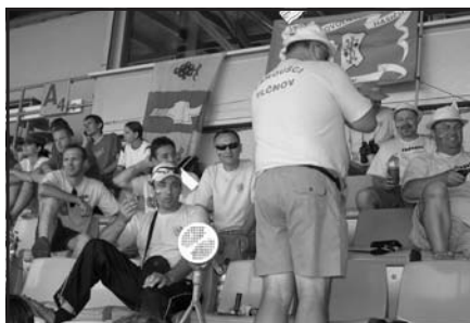
Vlčnovští fanoušci v akci