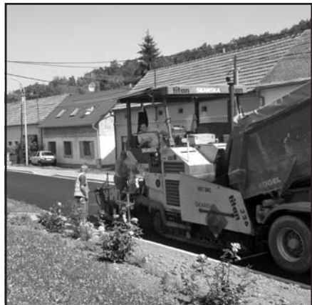
Hlavní dodavatel SKANSKA