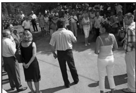
Slavnostní zahájení výstavby ČOV