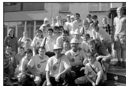
Výprava fanoušků SDH Vlčnov na olympiádě