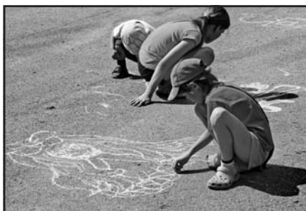
Výtvarná soutěž Živá voda