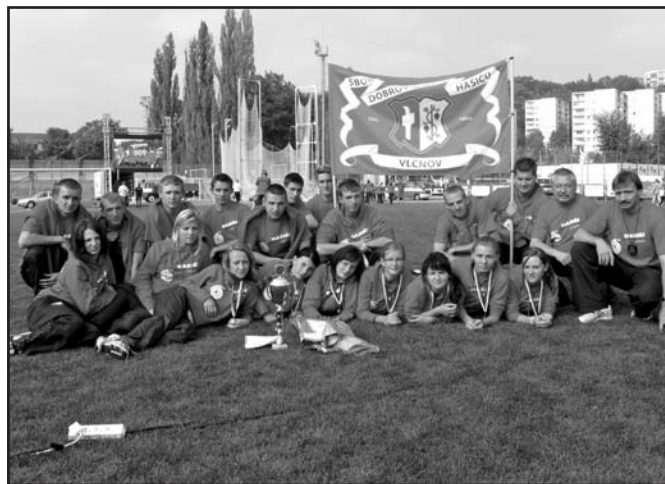
Bronzový kolektiv dorostenek SDH Vlčnov s vedoucími i trenéry