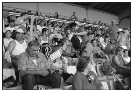
Vlčnovští fanoušci v akci

Pro úplnost: v mužích a v absolutním pořadí se olympijskými vítězi stali Rakušané před Italy a Slovinci na třetím místě. V kategorii žen vyhrály Slovinky. Krásného úspěchu dosáhli v kategorii profesionálů výběr hasičů HZS ČR z Hradce Králové, kteří se stali olympijskými vítězi.