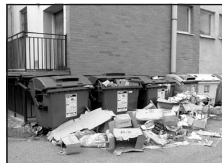
tříděný odpad v nedávné minulosti