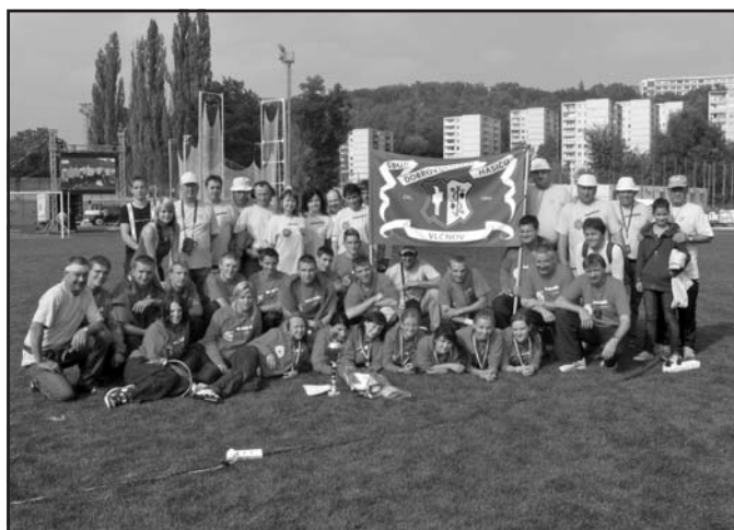
Celá vlčnovská výprava na mistrovství – muži, ženy a fanoušky