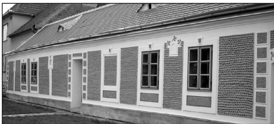
Rodný dům Joži Úprky v Kněždubě