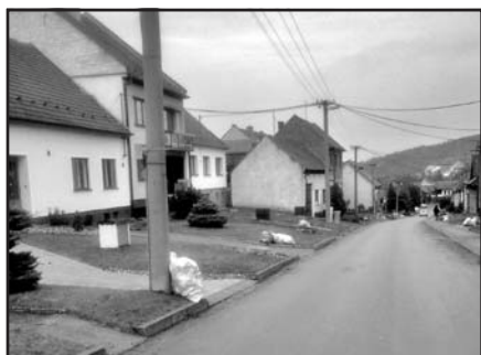
tříděný odpad dnes