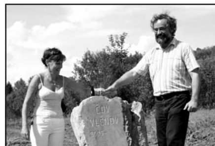
Poklepání základního kamene ČOV