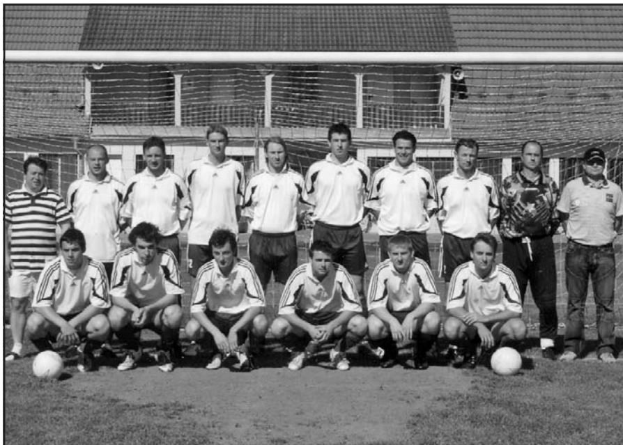
Mužstvo A před posledním zápasem se Suchou Lozí