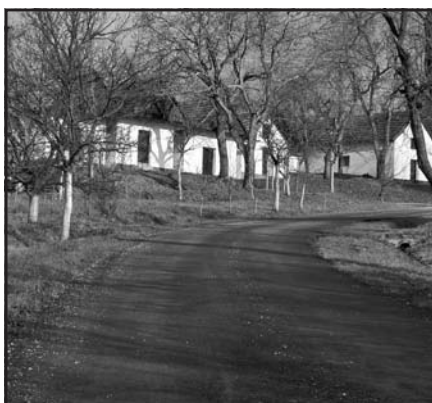
Nový povrch silnice ke kapličce ve vinohradech