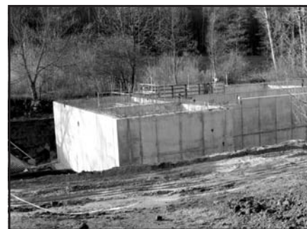
Realizace výstavby ČOV