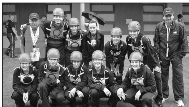
Spokojené družstvo žen i s vedoucími po olympijském vystoupení