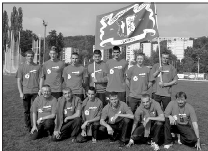
Družstvo mužů SDH Vlčnov s vedoucími i trenéry