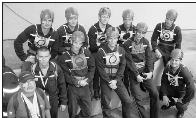
Družstvo mužů s vedoucím před vstupem na olympijskou plochu