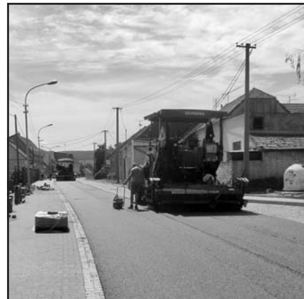
Silnice III/4957, Vlčnov–Veletiny