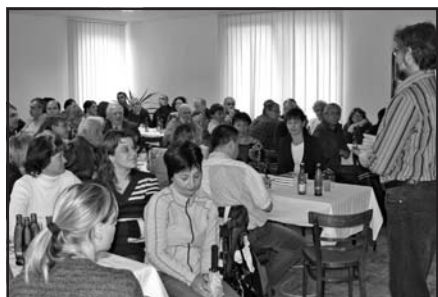
Starostky a starostové Česko-Polských regionů