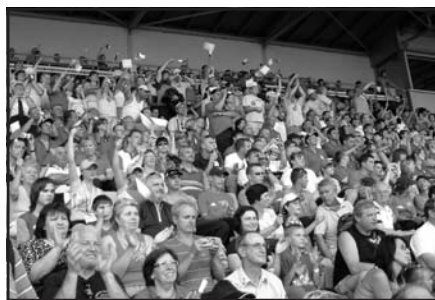
Vlčnovští fanoušci na olympiádě