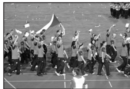
Zahájení olympiády a naši muži a ženy