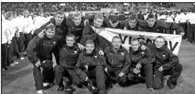
Družstvo mužů s vedoucími při slavnostním ukončení olympiády