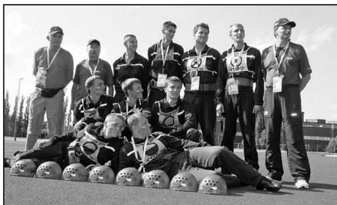
Hrdé a úspěšné družstvo mužů s vedoucími po ukončení pokusů