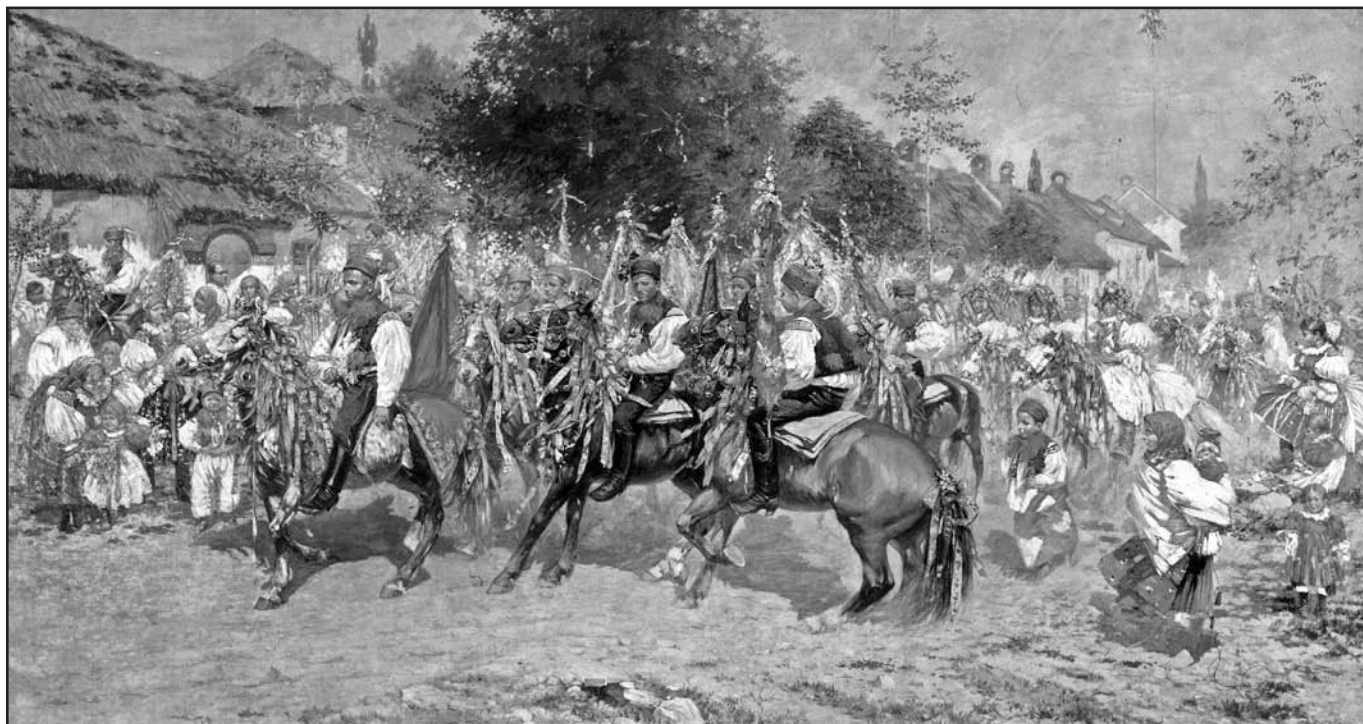
Jízda králů ve Vlčnově, Joža Úprka

Vlčnovský zpravodaj – vydává Rada obce Vlčnov nákladem 700 ks, IČ: 291 561; MK ČR E 10127; prodejní cena 3,- Kč.