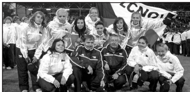
Družstvo žen při slavnostním ukončení olympiády