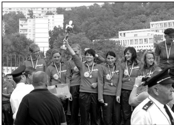
Stříbrný tým žen SDH Vlčnov při vyhlášení požárních útoků