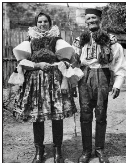
Dědáci Kuželé při jejich zlaté svatbě roku 1957

Brambory a řepu jsme měli v pěkně kvelbeném sklepě, v němž byly též látečky s mlékem na kyšku, smetana se sbírala žufanem. Později si naši pořídili odstředivku na odstředování mléka. Chodili k nám odstředovat sousedé a známí, plat byl v odstředěném mléce. Smetana se odstředovala v maslence. Později si maměnka netížila a prodávali sladkou smetanu v Brodě zákaznicím. Plnotučné mléko se jedlo zřídka. Za šopou byla malá zahrádka na zeleninu. Nad šopou se větvila kulovačka, která měla velmi sladké plody. Z kulovačky se dalo snadno přelézt na střechu. Poněvadž střechy souvisely jedna s druhou, chodíval jsem jako kočka po kálenicích přes čtyři chalupy