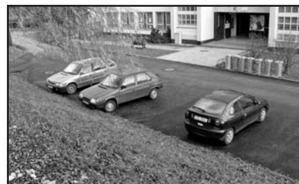
Parkoviště u MŠ