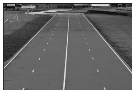
Pohled na tartanovou hasičskou cvičnou dráhu