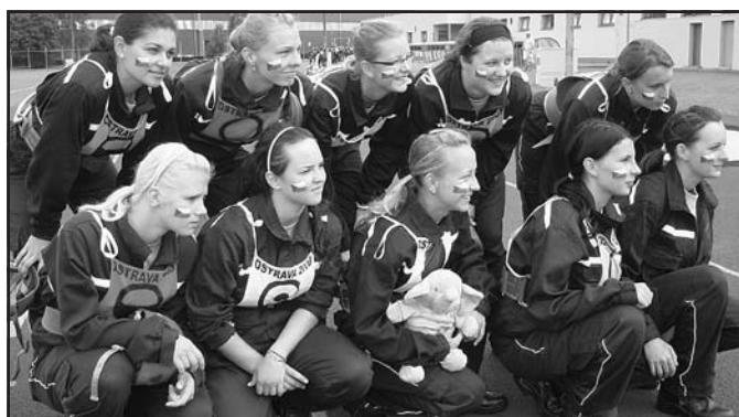
Družstvo žen před pokusem na olympiádě