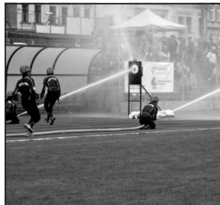
Nástřik „proudařek“ SDH Vlčnov při stříbrném požárním útoku