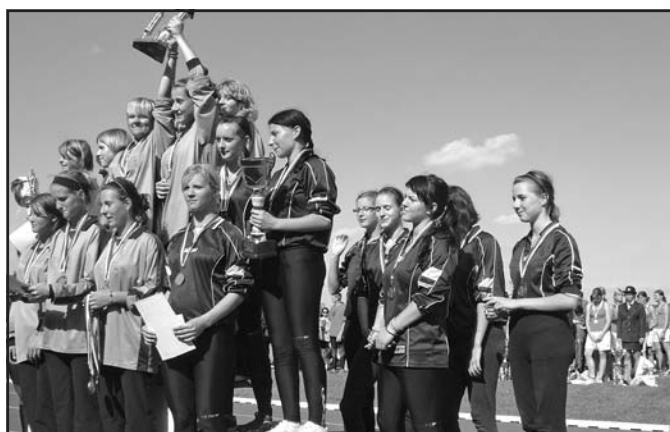
Dorostenky SDH Vlčnov na stupních vítězů