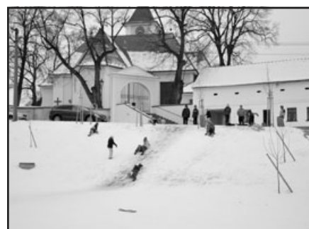
Zima v amfiteátru