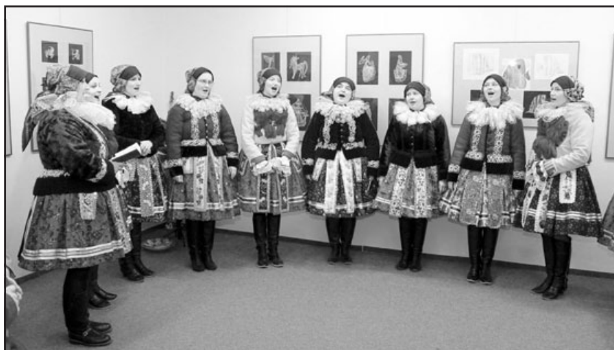
VBU při vernisáži výstavy Paličkováný svět