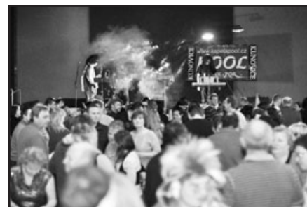
Pofašanková maškarní veselice