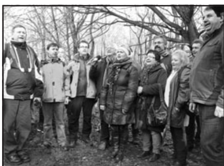
Silvestrovské setkání na Pepčíně