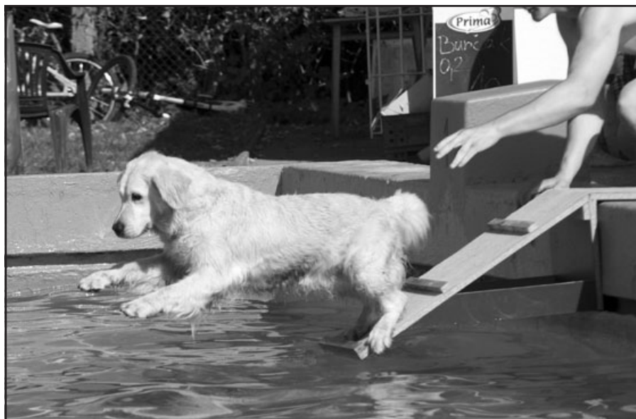
Plavecké psí závody na koupališti