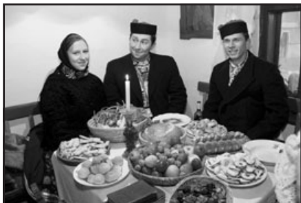
Vánoce ve Vlčnově