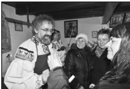
Vánoce ve Vlčnově