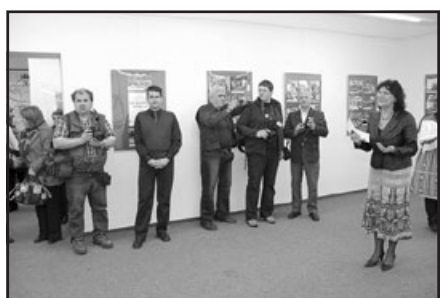
Kde sme boli my, boli ste i vy