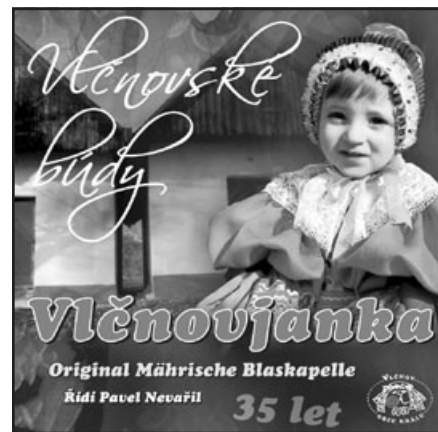
Titulní stránka CD