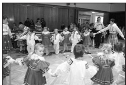
Dětský krojový ples