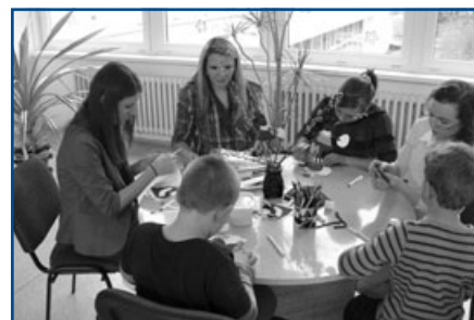
Příprava Velikonoc v ZŠ Vlčnov