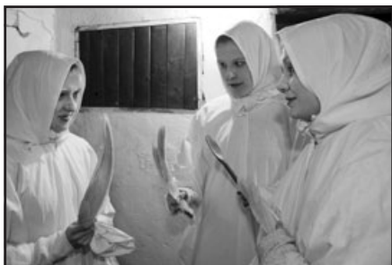
Vánoce ve Vlčnově