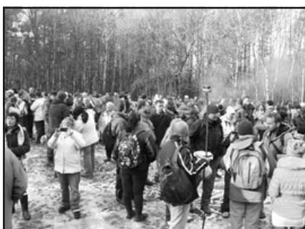
Silvestrovské setkání na Pepčíně