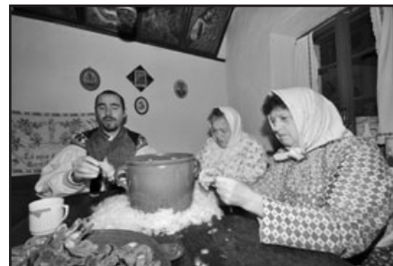
Vánoce ve Vlčnově