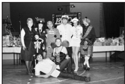
Pofašanková maškarní veselice