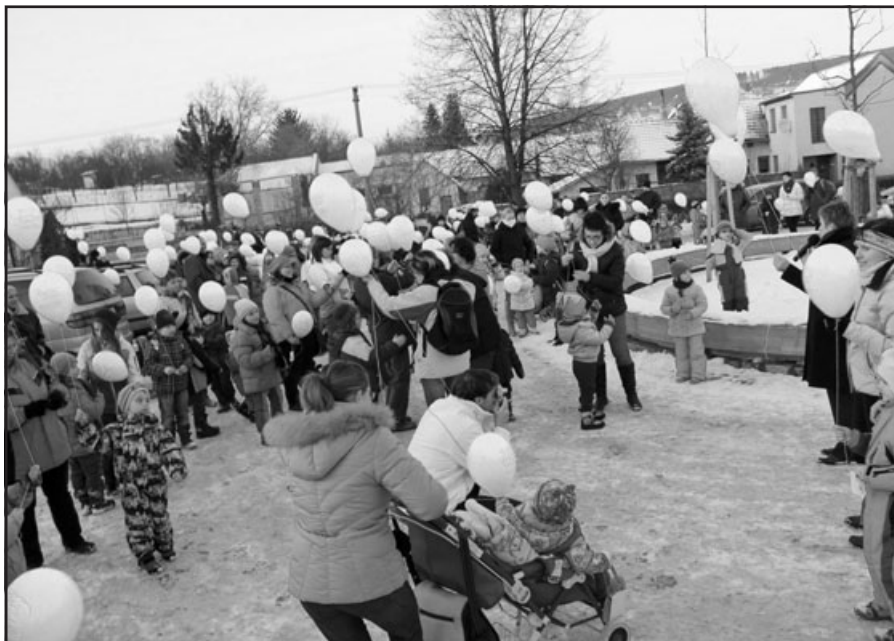
Vypouštění balonků pro Ježíška