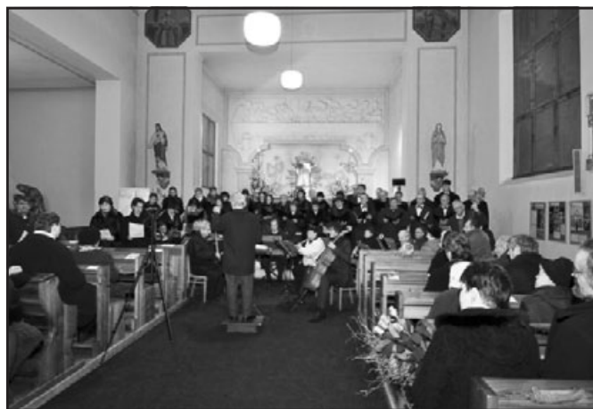
Vánoční koncert v kostele sv. Jakuba