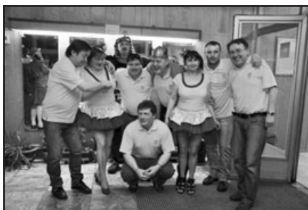
Pofašanková maškarní veselice