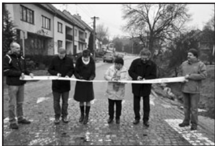
Kolaudace silnice 28 října