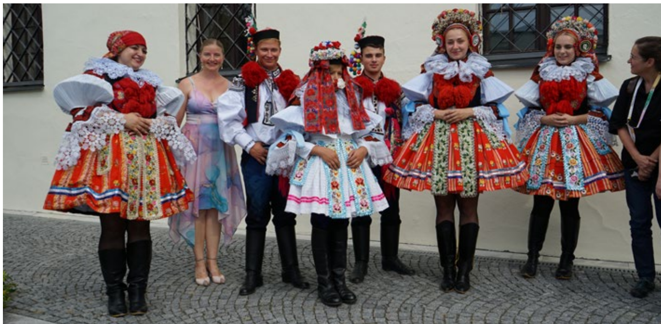
Muzeum J. A. Komenského v Uherském Brodě, předvedení oblékání krále