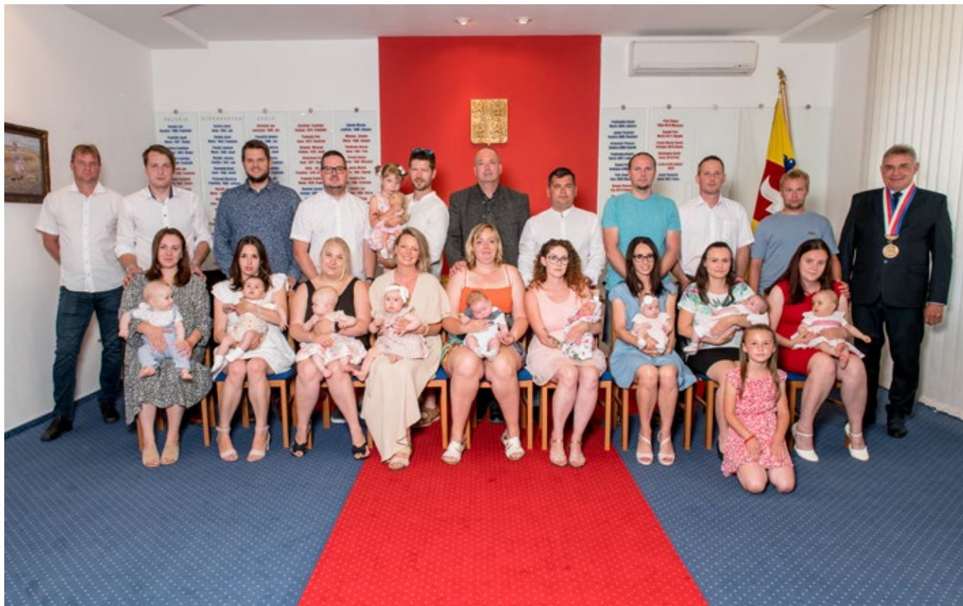
Vitání občánek 26. 6. 2022, Vlčnov