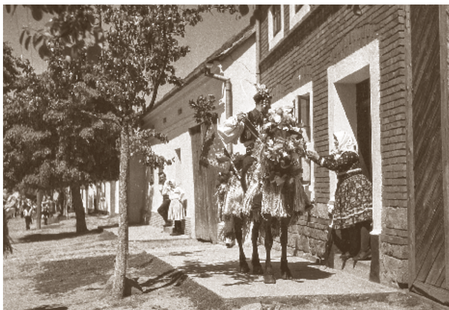
Z jízdy králů.