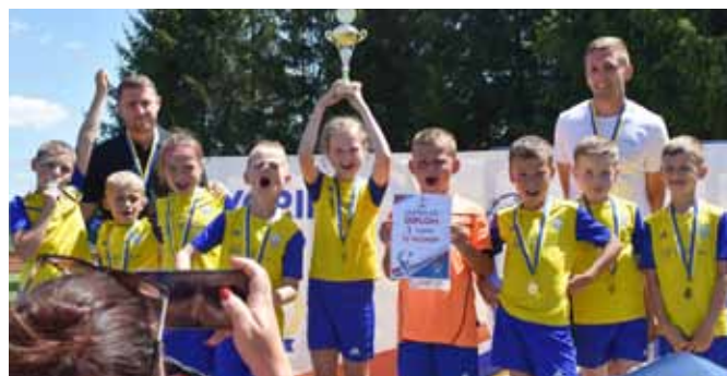
3. místo Javořina CUP starší přípravka