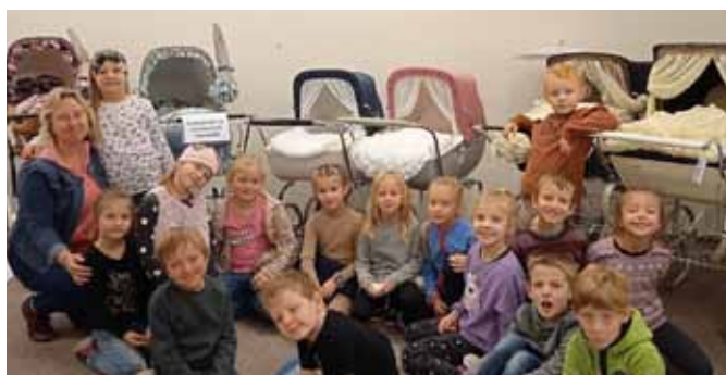
Výstava historických kočárků