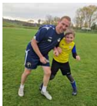
rodice vs. děti 1