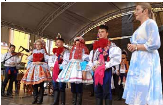
Slavnosti vína Uh. Hradiště, přehlídka krojů Od Buchlova k Javořině