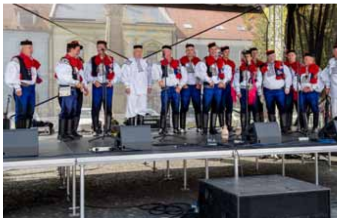
Slavnosti vína Uh. Hradiště, Mužský sbor Vlčnov