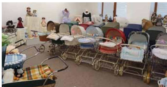
Výstava historických kočárků