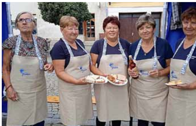
Slavnosti vína Uh. Hradiště, Mažoretky Emča - obsluha stánku Východního Slovácka