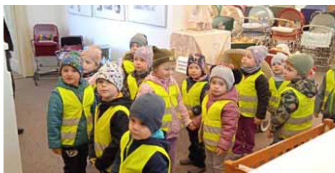
Výstava historických kočárků