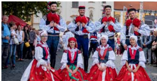
Slavnosti vína Uh. Hradiště, Vlčnovjan