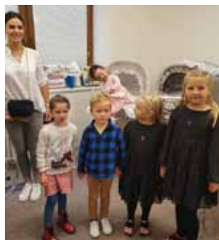
Výstava historických kočárků