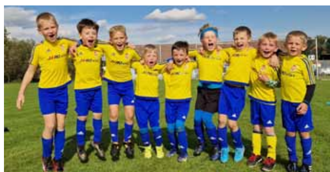
mladší přípravka po vítězství nad Orlem Uherský Brod