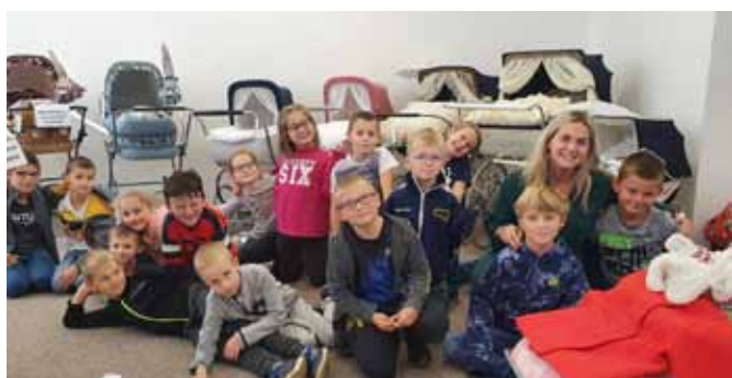
Výstava historických kočárků