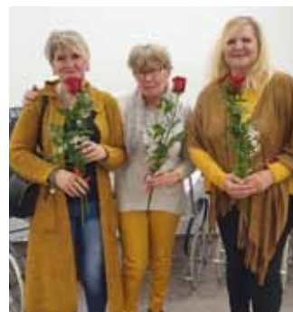
Výstava historických kočárků