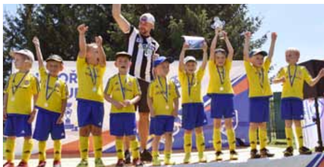
2. místo Javořina CUP mladší přípravka