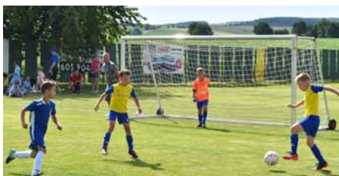
Javořina CUP 1