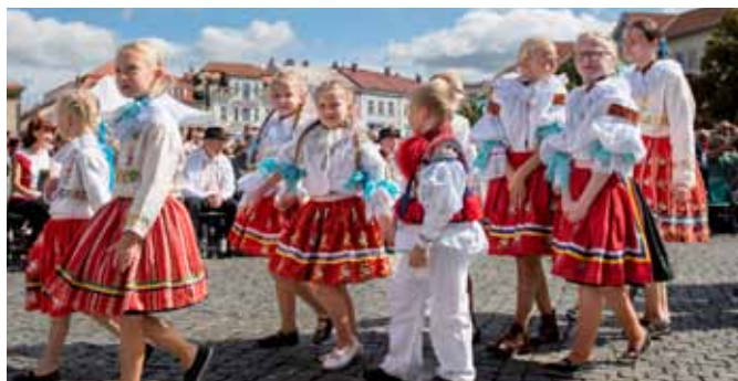
Slavnosti vína Uh. Hradiště, Vlčnovjánek