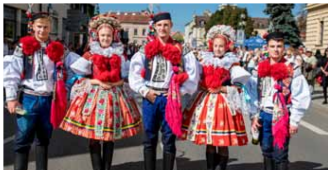
Slavnosti vína Uh. Hradiště, zástupci letošní jízdy králů