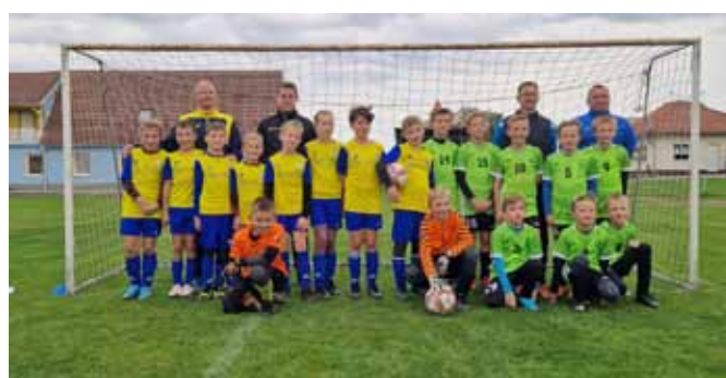
starší přípravka po utkání s FK Javořina