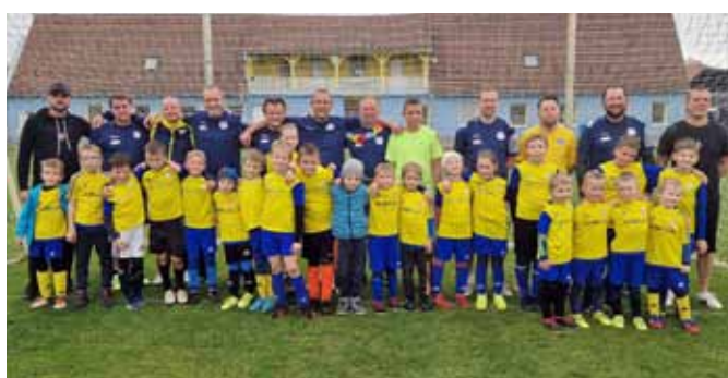
Přípravka-rodice vs. děti