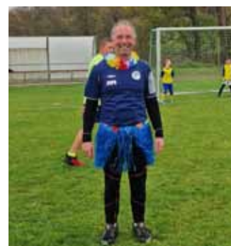
rodice vs. děti