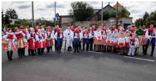
Slavnosti vína Uh. Hradiště, Vlčnovjané v průvodu