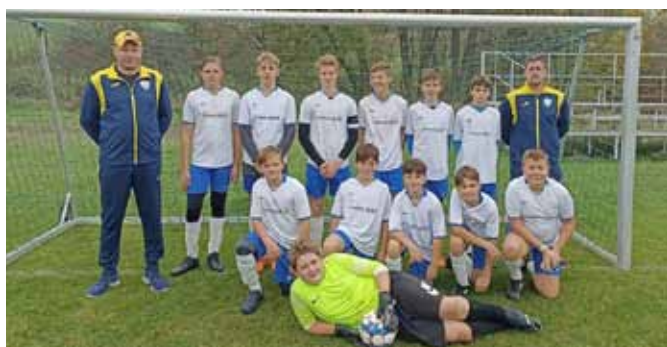
žáci podzim 2022