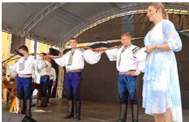
Slavnosti vína Uh. Hradiště, přehlídka krojů Od Buchlova k Javořině