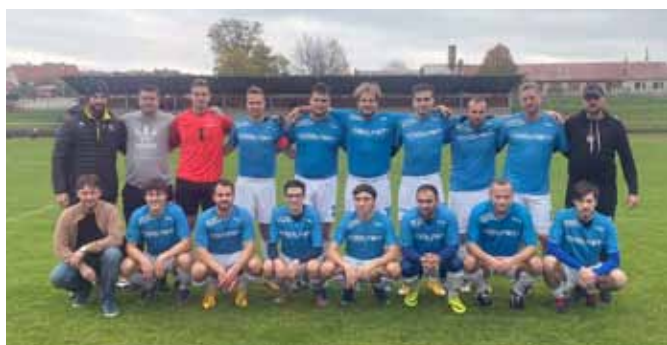
A mužstvo podzim 2022