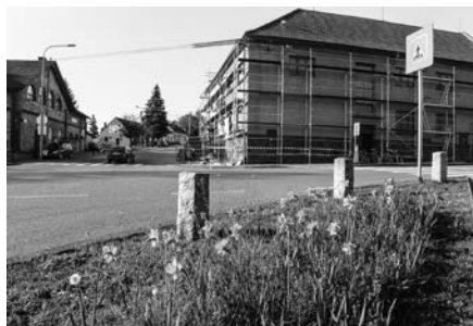
Rekonstrukce fasády obecního úřadu