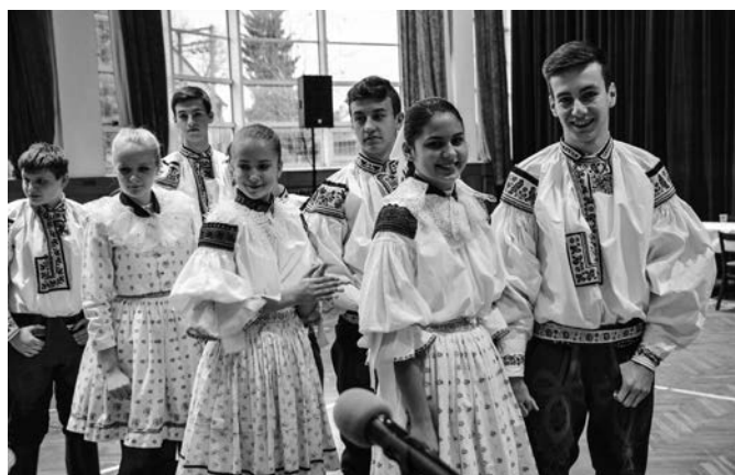
Detský krojový ples