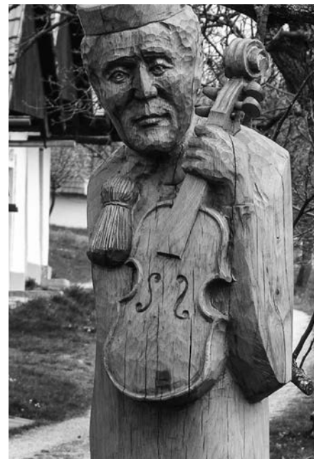
Socha houslisty v búdách