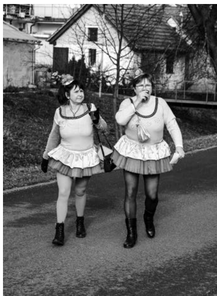
Masopustní průvod – téma Olympiáda