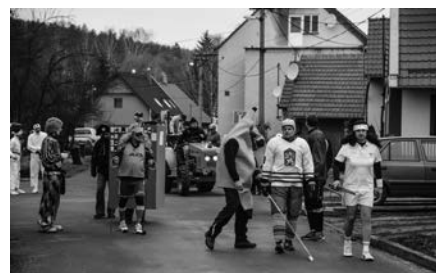
Masopustní průvod – téma Olympiáda