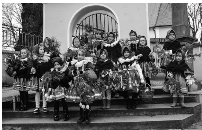
Královničky před kostelem