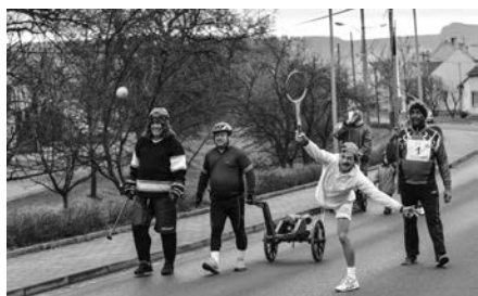
Masopustní průvod – téma Olympiáda