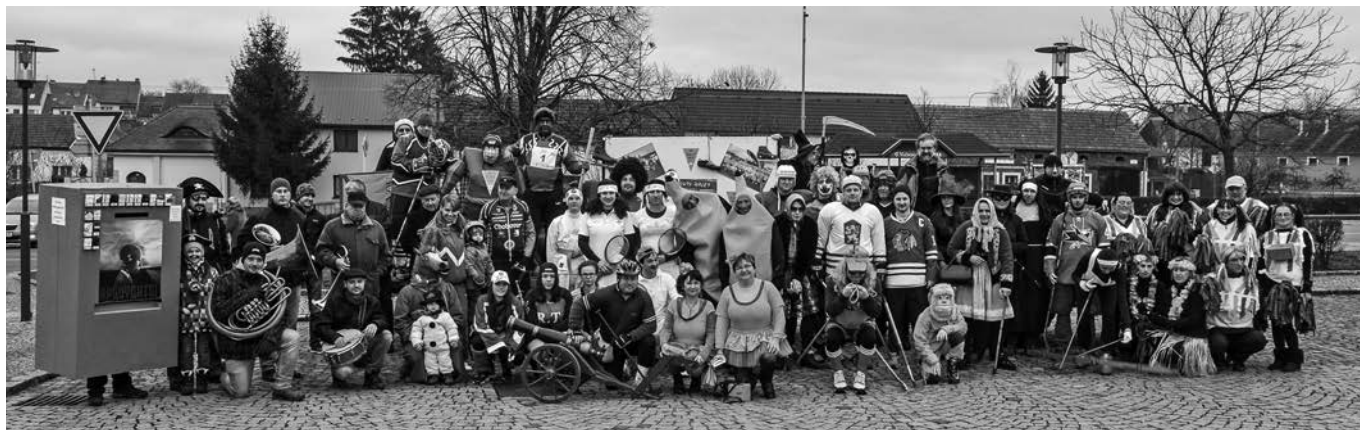
Masopustní průvod – téma Olympiáda