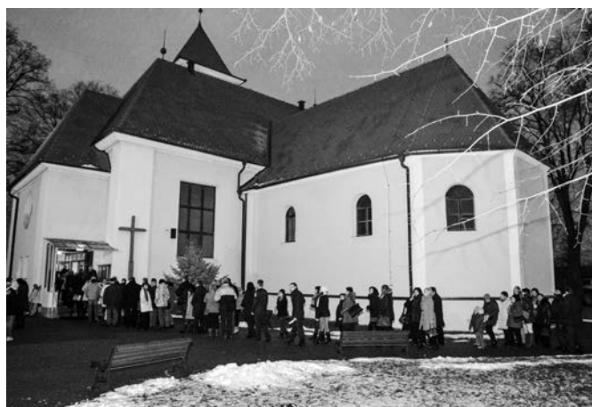
Vánoční koncert Hradištanu – u kostela před koncertem