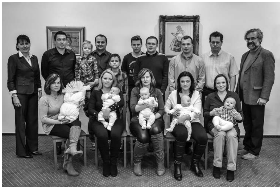
Vítání občánků, březen 2016