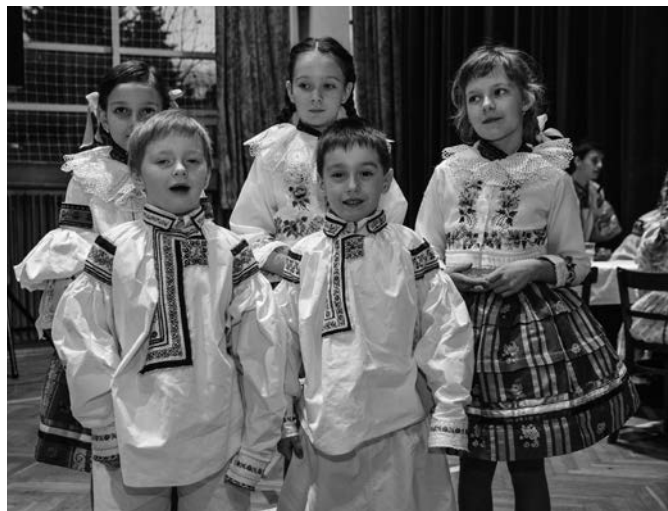
Dětský krojový ples