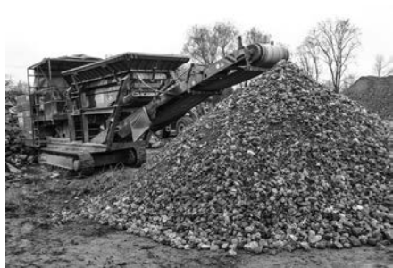
Nadrcená stavební suť