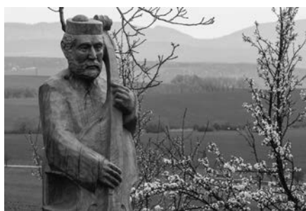
Socha basisty v búdách