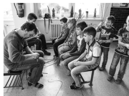
Velikonoční dílničky v základní škole