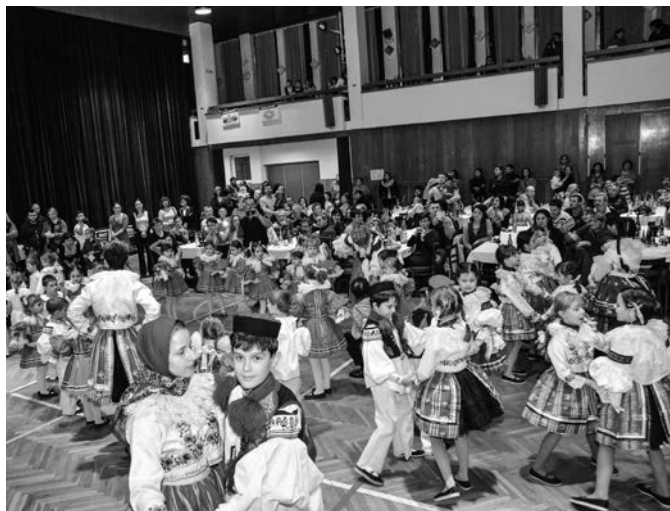
Dětský krojový ples