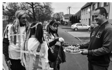
Masopustní průvod – téma Olympiáda