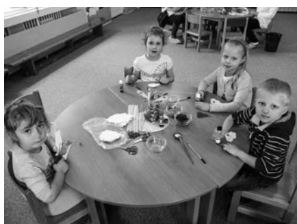
Velikonoční dílničky v základní škole