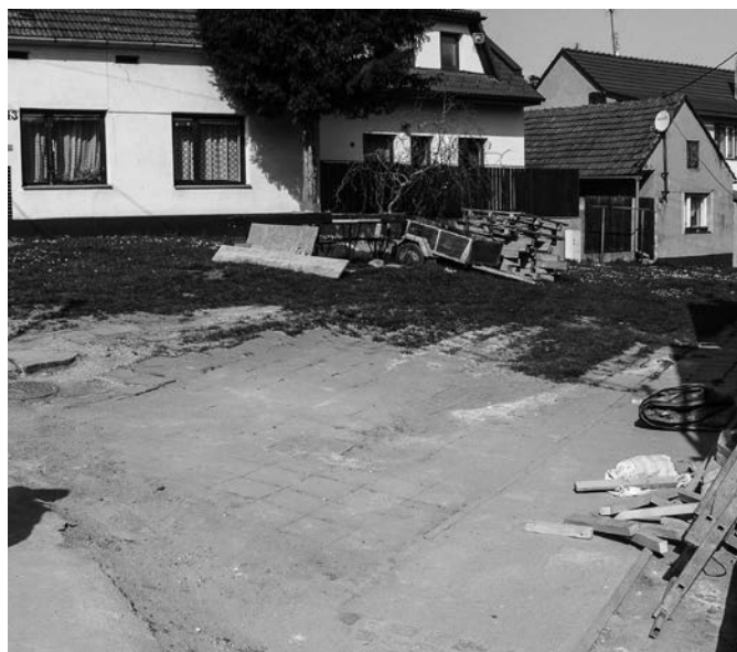
Dolní chaloupky před rekonstrukcí