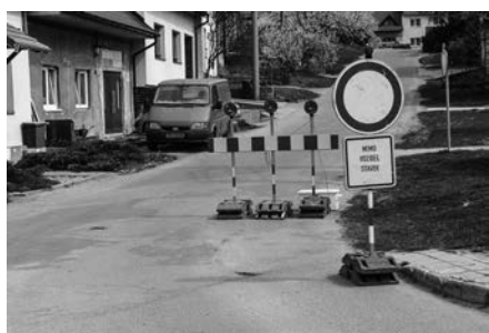
Začala rekonstrukce ulice Podedvorská