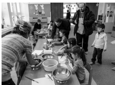
Velikonoční dílničky v základní škole