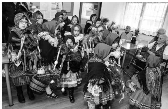
Královničky v charitním domě