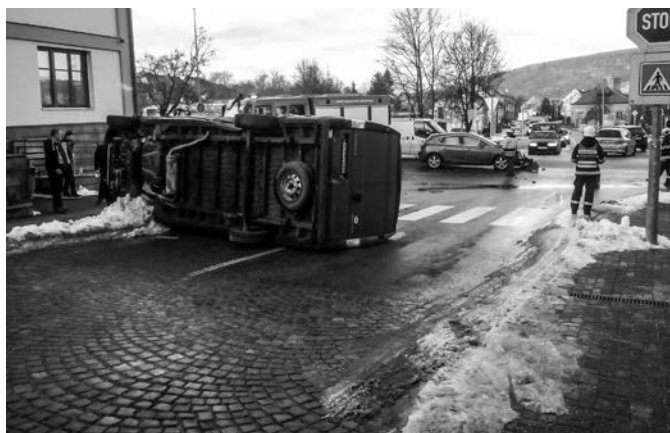
Autohavárie pred obecným úradom