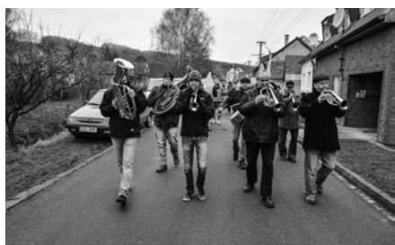
Masopustní průvod – téma Olympiáda