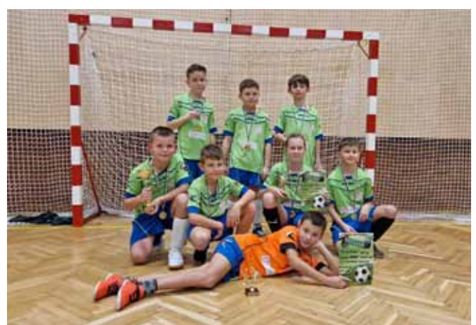
Starší příprava HASTEKO Zimní liga ve Vlčnově 3. místo