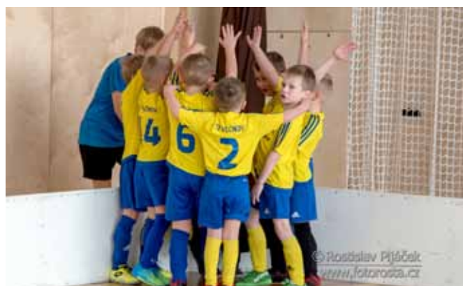
Školička - alias Vlčnovští drtiči