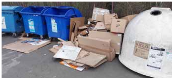
Stále se opakující prohřešky občanů