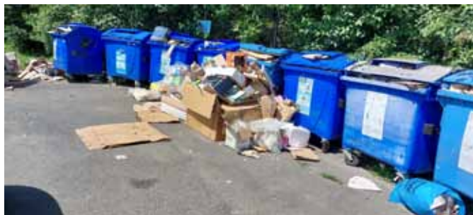
Takto to dál nejde