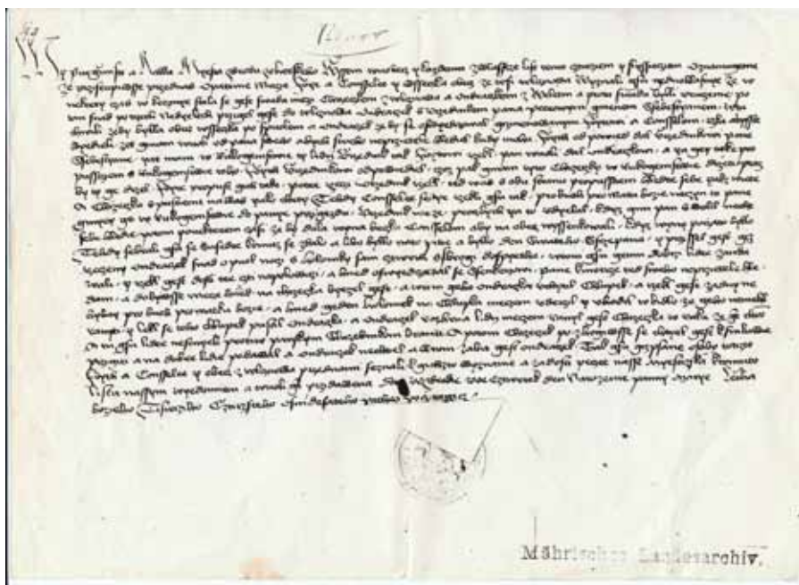
Zápis z vyšetřování konfliktu mezi vlčnovskými a veletinskými poddanými z roku 1485

O tom, že Vala byla vyšší, dokládá i starý obecní záznam kde je doslovně psáno: „...zůstává uprostřed obce pahrbek, jež by se mohl od občanů roz-