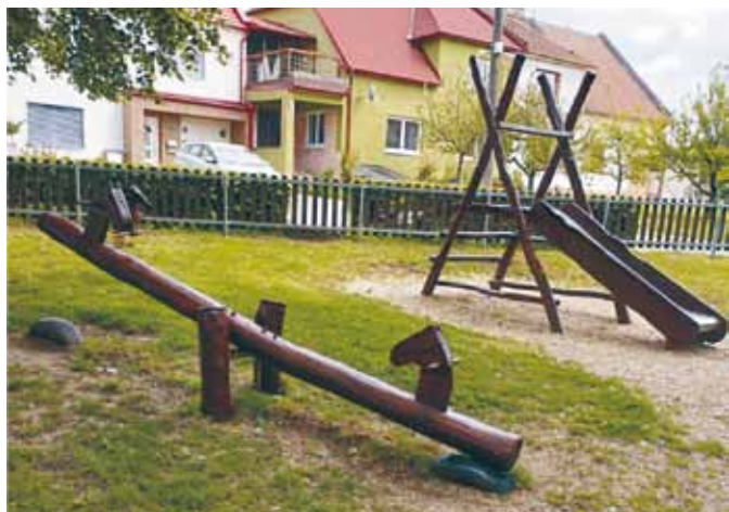
Hřiště po renovaci