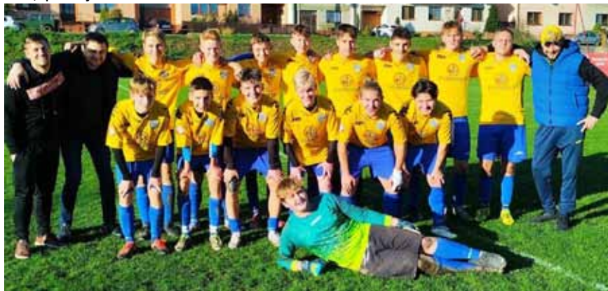
Dorost - poslední zápas na podzim proti Jalubí.