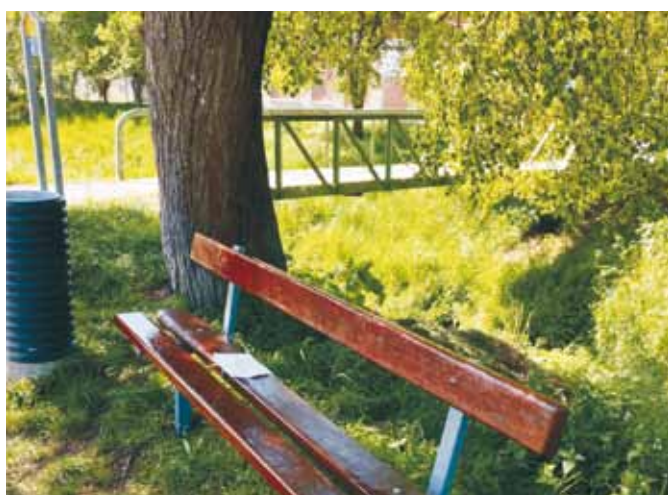
Lavička na dolním konci po opravě