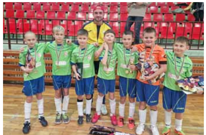
Starší příprava - Javořina CUP