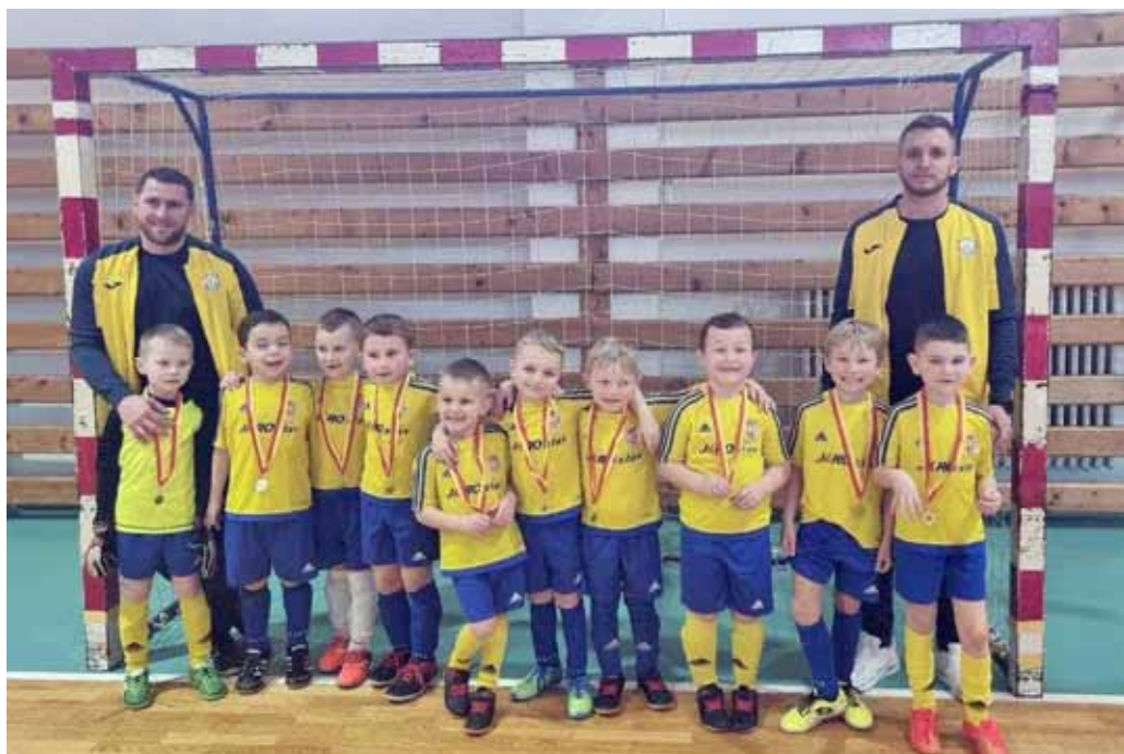
Školička - obhajoba vítězství na turnaji v Bojkovicích