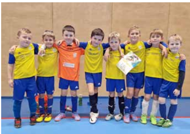
Ml. příprava na Vánočním turnaji ve Strání