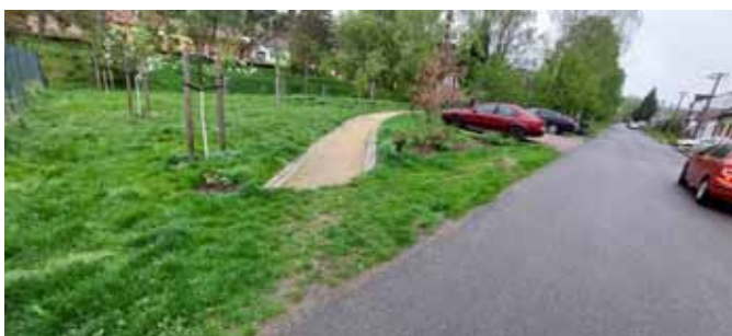
Chodník před dokončením