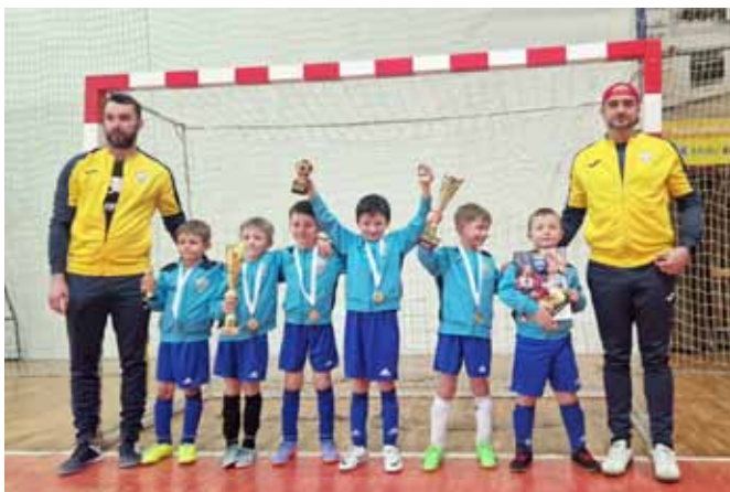
Vítěz Hasteko ligy - mladší příprava TJ Vlčnov