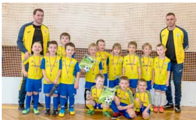
Školička - 2. ročník ZEMEK-TECHNIK CUP