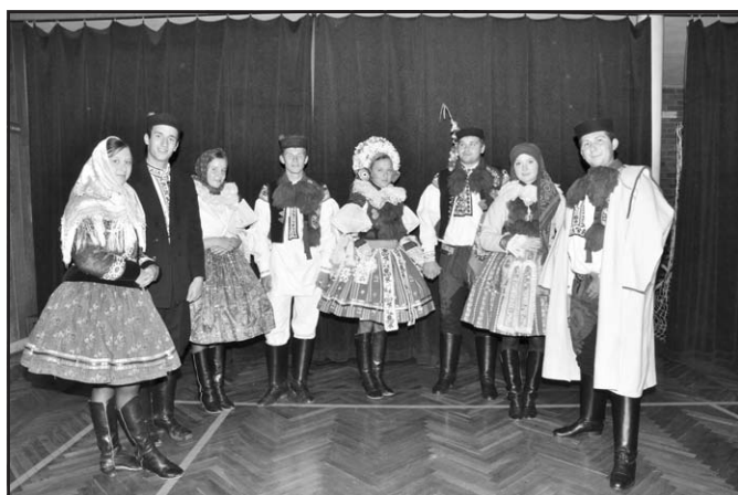
Přehlídka variant vlčnovských krojů