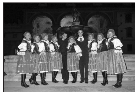
Valdštejnská jízdárna – moderátoři a my