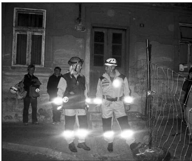
Cvičení a soutěž kynologů