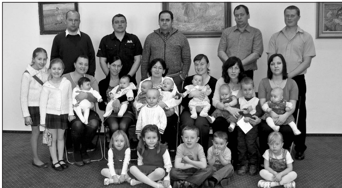
Vítání nových občánků Vlčnova – březen 2012