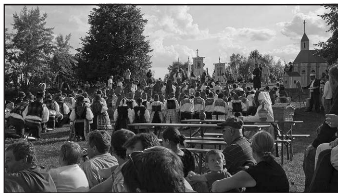
Vlčnovjan ve Strážnici