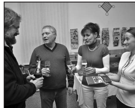
Křest knihy Vzpomínky z Vlčnova

Při fyzické návštěvě si můžete vybrat ze 13 351 titulů knih (4103 naučných a 9248 knih krásné literatury – stav k 31.12.2011) nebo z 26 odebíraných časopisů. Pokud vámi hledanou knihu v knihovně nenajdete, ráda vám ji knihovnice objedná z jiné knihovny v republice (MVS – meziknihovní výpůjční služba). Služba je bezplatná, zaplatíte jen poštovné. Rovněž bezplatně vás knihovna upozorní (mailem nebo SMS zprávou), že se do knihovny vrátila kniha, o kterou jste měli zájem a vy si ji můžete vyzvednout. V knihovně je 6 počítačů s internetovým připojením, určených pro veřejnost. K počítačům je připojena barevná laserová tiskárna, knihovna disponuje kvalitní černobílou kopírkou. Knihovnice vám na požádání zalaminuje (zataví do průhledné fólie) obrázek či text. Přístup na internet je zdarma, kopírování, tisk a laminování se platí, ceník najdete na stránkách knihovny. V loňském roce knihovnu navštívilo 4046 návštěvníků (243 z nich jsou registrovaní čtenáři knihovny), kteří si vypůjčili 10 309 knih