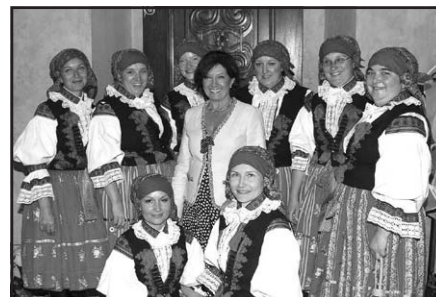
Valdštejnská jízdárna – Marie Rottrová a my