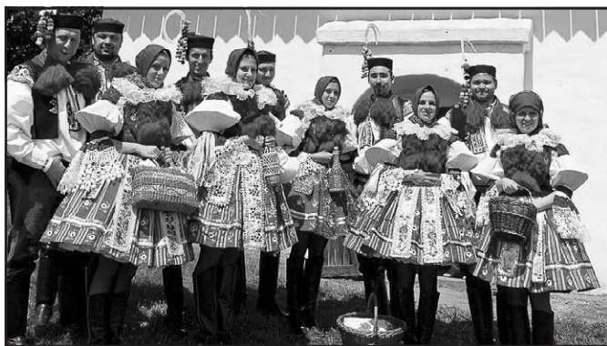
Vlčnovjan ve Strážnici