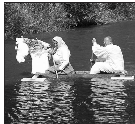
27. srpna 2011 – Neckiáda ve Vnorovech