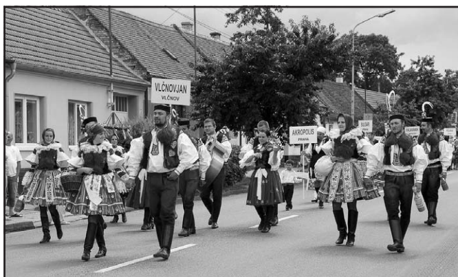
Vlčnovjan ve Strážnici