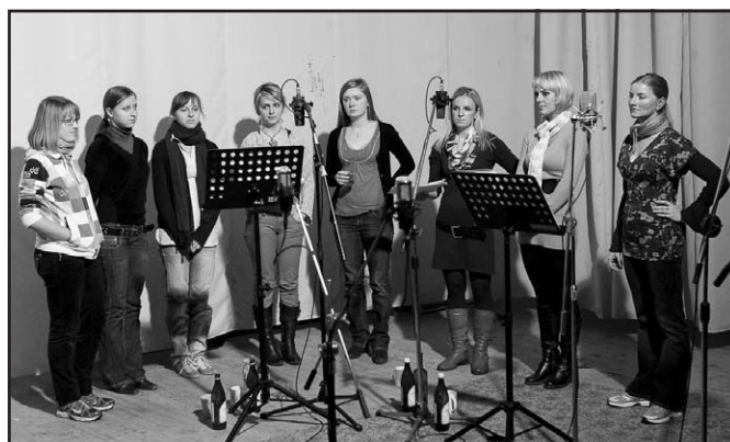
Členky Vlčnovjanu v nahrávacím studiu