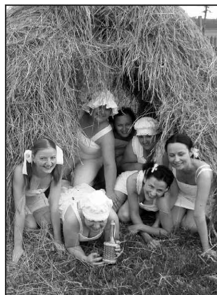
Zpívání s baranem-Vacenovice