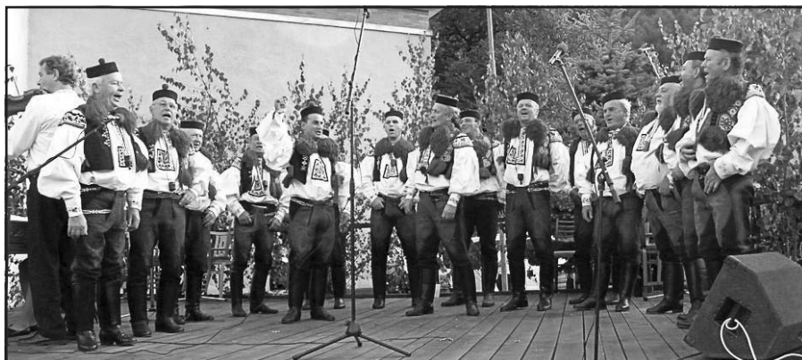
28. srpna 2011 – první zahraniční zájezd, Lúky pod Makytou, Slovenská republika

25. září Košt vdolečků v hospodářské usedlosti č.p. 65.