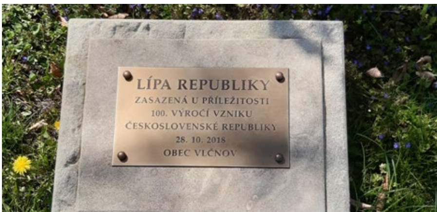
Lípa republiky zasazená v roce 2018 má pamětní desku