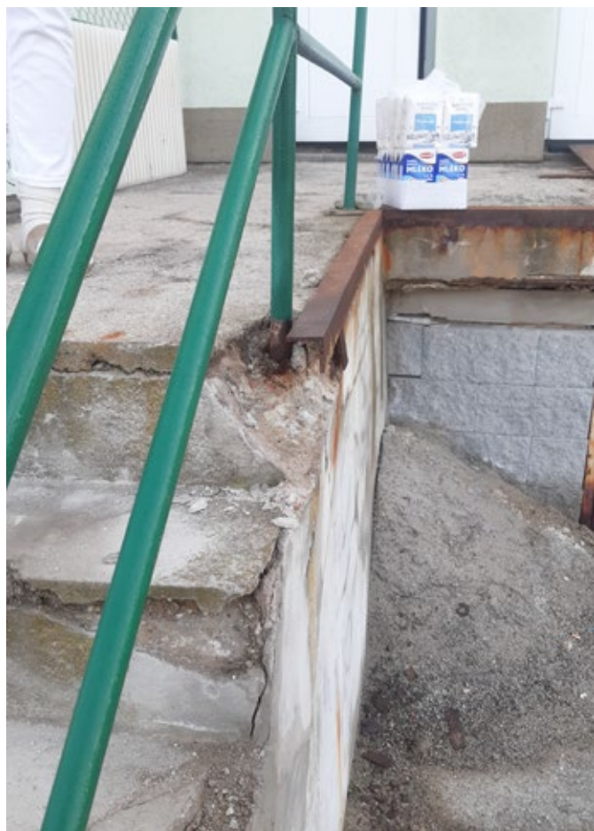
Původní rampa u školní kuchyně