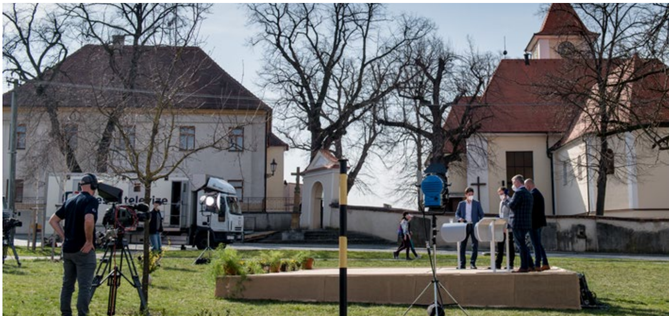
Natáčení probíhalo v parku naproti kostela