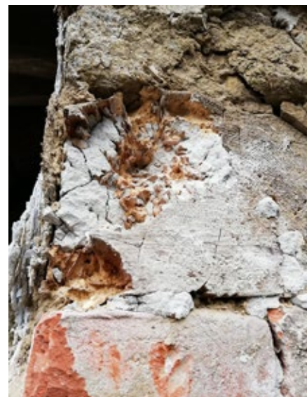
Roh domu bude nutné nově podezdít na kámen a vápenotrasovou maltu, nově vyzdít stěny a spojit se současným zdravým zdivem