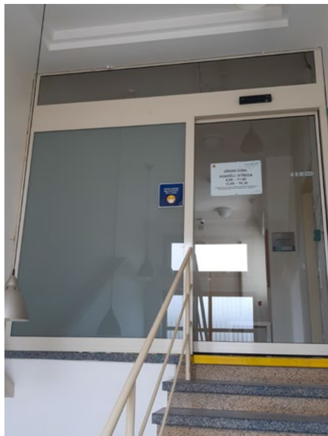
Nové elektronické vstupní dveře na OÚ