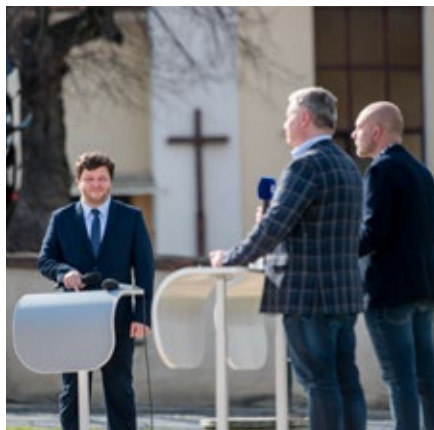
Rektor Univerzity T. Bati