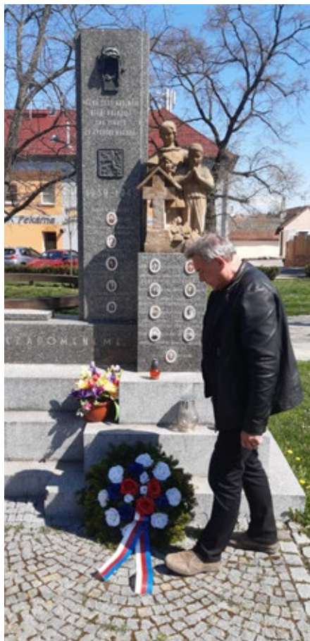
Jako každý rok, i letos na výročí osvobození 26. dubna jsme uctili památku padlých spoluobčanů položením věnců k pomníkům a k pamětním deskám v obci