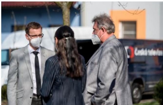
Hejtmán zlínského kraje se zástupci obce