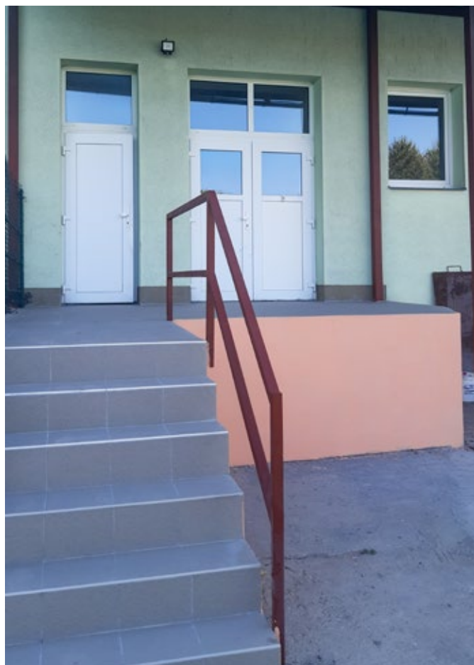
Rampa u školní kuchyně po opravě