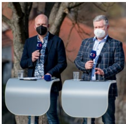
Televizní moderátory ve Vlčnově