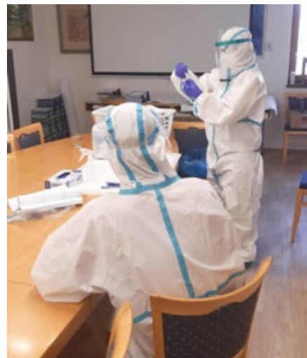
Tak jako na všech pracovištích i na obecním úřadě se pravidelně testuje