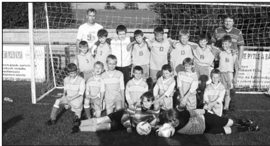
Příprava v roce 2009

Jak se postupně vytvářela fotbalová příprava, tak se i upravoval herní systém. Hra na celé hřiště, normální fotbalové branky, s počtem hráčů 10 + 1, s možností střídání pouze 5 hráčů, kteří se nemohou vrátit do hry a s hrací dobou 2×30 minut tu vydržel až do sezóny 2006/2007. V této sezóně OFS Uherské Hradiště, jako jeden z posledních OFS, přešel na nový herní systém fotbalových příprav. Z velkého hřiště se, v jarní části sezóny 2006/2007 přešlo na minifotbal, který se hrál na šíři fotbalového hřiště, branky 2×5 m, s počtem hráčů 7+1, střídání hokejovým způsobem s hrací dobou 2×25 minut.