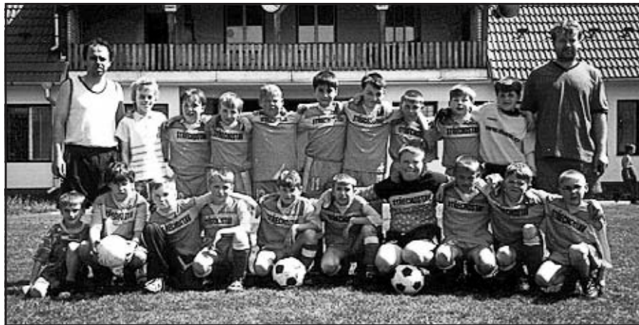
Příprava v roce 2002