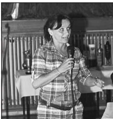
Prezentace Asociace sportu pro všechny