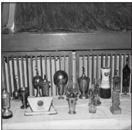
Ukázka fotbalových trofejí TJ Vlčnov

Vzpomínkový pořad mohl být uspořádán díky finančním příspěvkům těchto firem: Z-GROUP, a. s., ČSAD INVEST, a. s.,