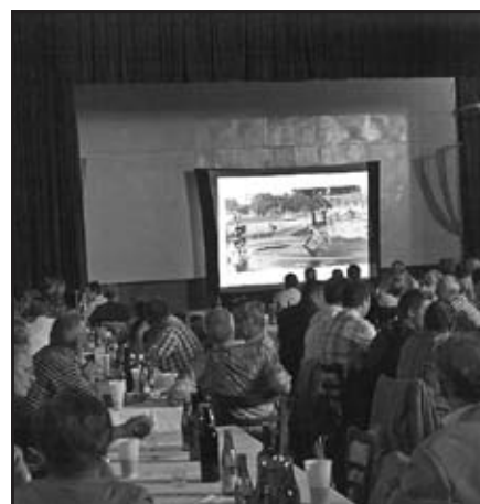
Jeden ze snímků o vlčnovské házené