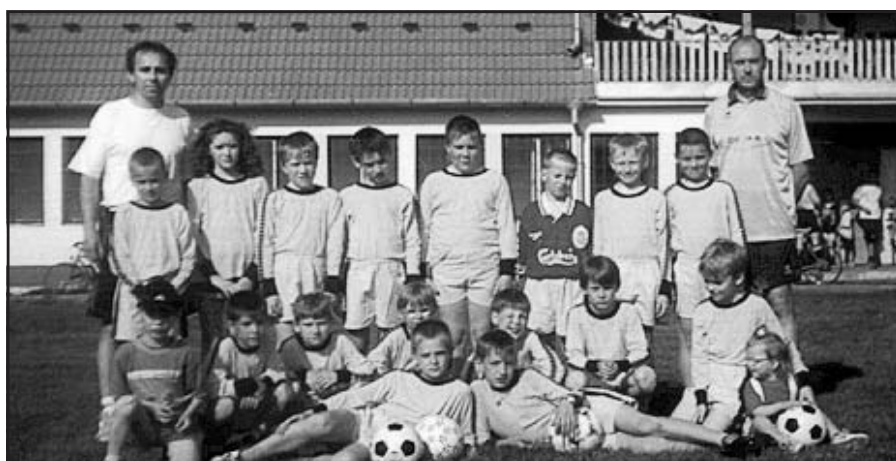
Příprava v roce 2000