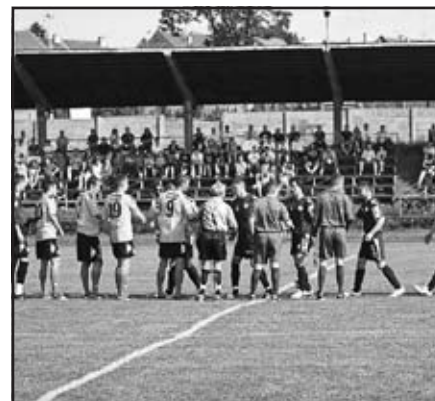
Sobota 26. 6. 2010