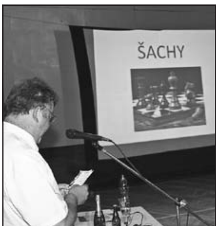
Prezentace šachového oddílu