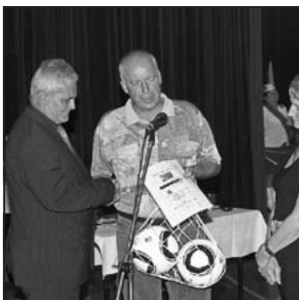
Hosté z Dahlehu (SRN)