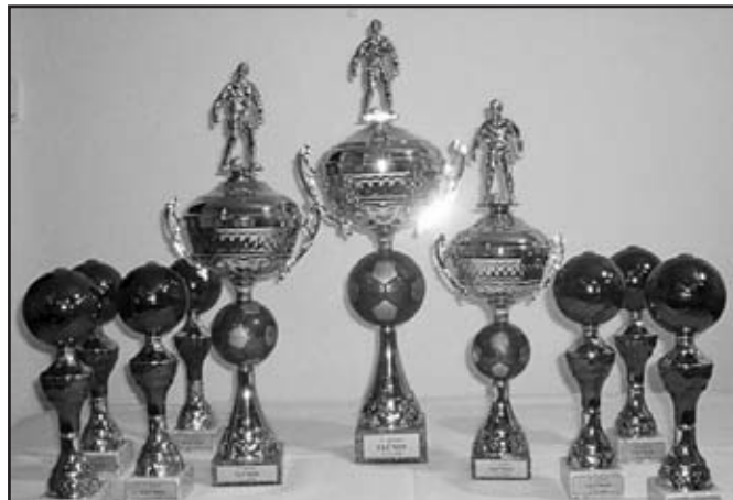
Turnaj „O pohár starosty Vlčnova“, ceny