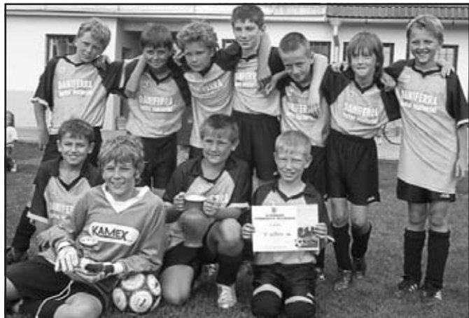
„O pohár starosty Vlčnova“, II. ročník, 2. místo