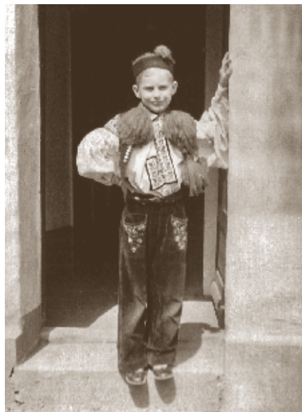
Při návštěvě Vlčnova v místním kroji, kolem roku 1944

Těsně po válce jsem byl jako podvyživené dítě poslán na dva měsíce do ozdravovny,