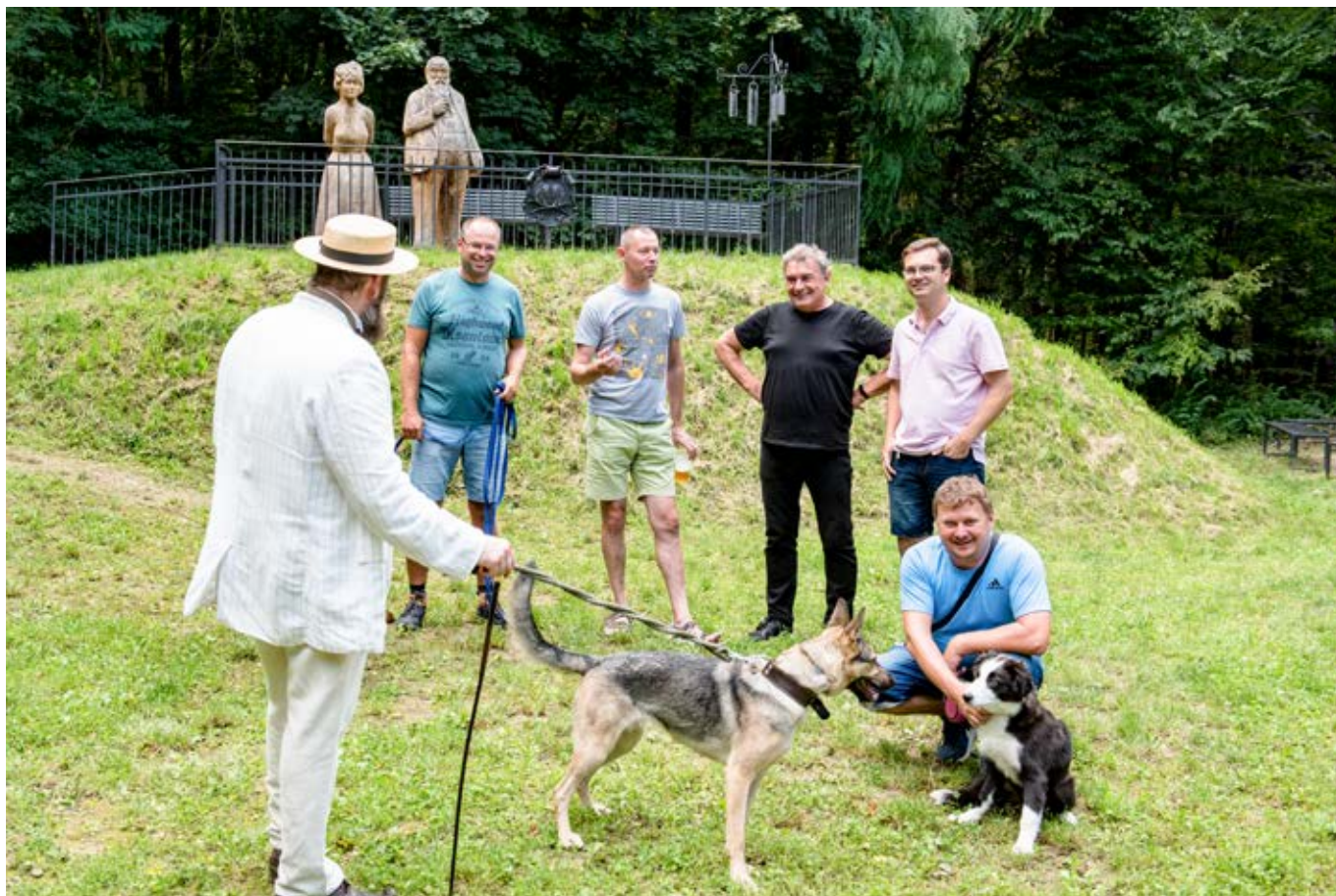
Setkání se zúčastnili starostové okolních obcí