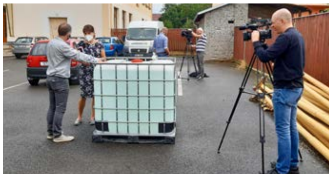
Při přebírání 1 000 l dezinfekce byly přítomny i televizní štáby