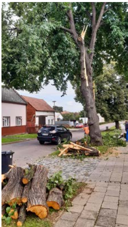
Polámaná stoletá lípa