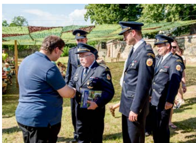
Rozloučit se přišli i vlčnovští hasiči