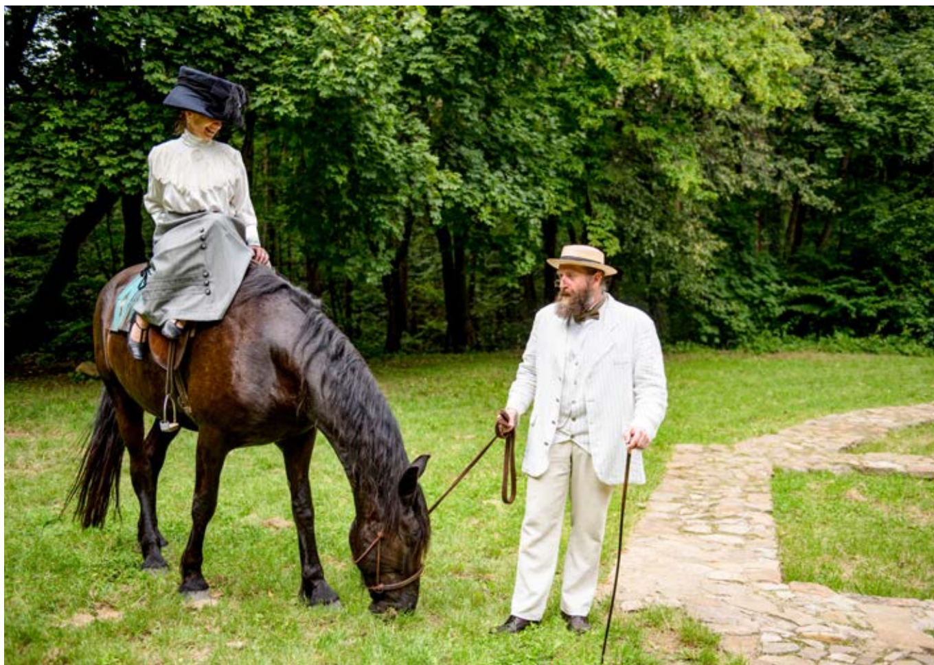
Na návštěvu přišel i pan hrabě s paní hraběnkou