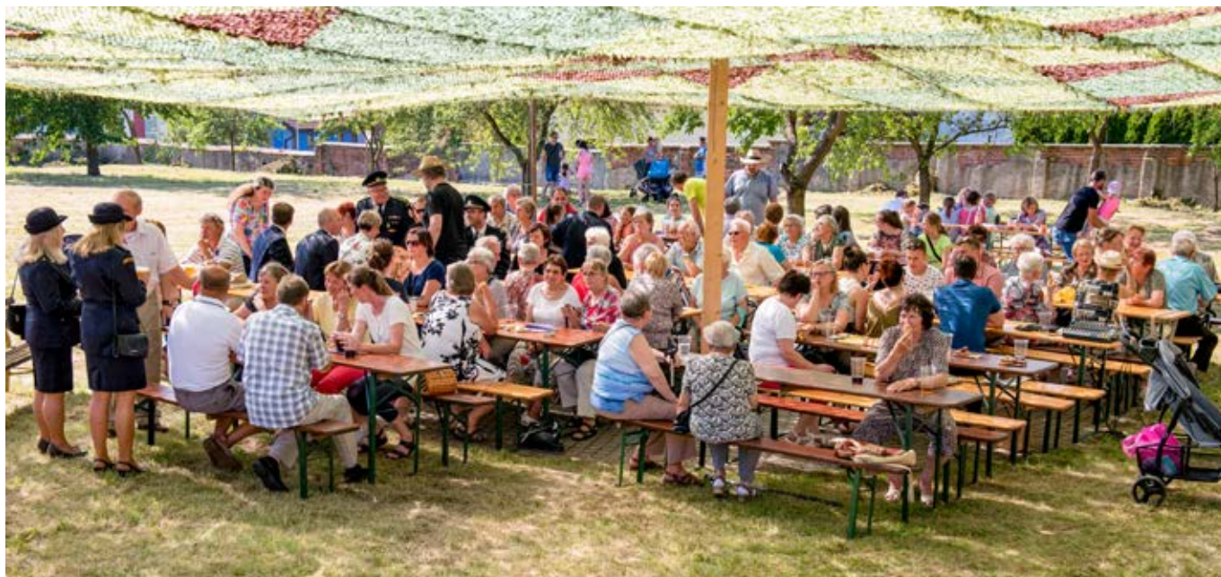
Posezení na farní zahradě