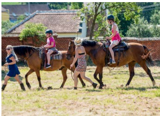
Děti si užívaly projíždky na koních