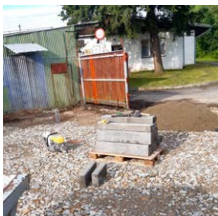
Rozšíření sběrného dvora – při realizaci