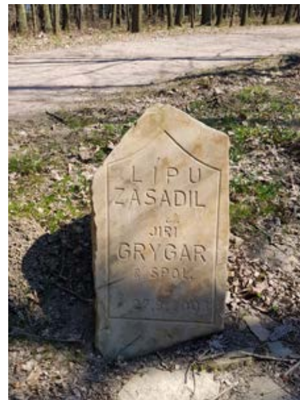
Čtvrtý „kameň“