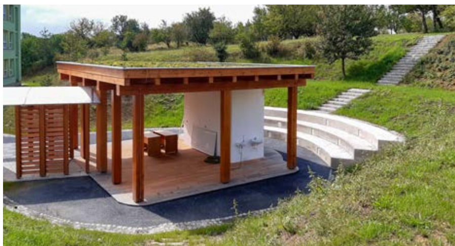
Zelená třída v zahradě ZŠ