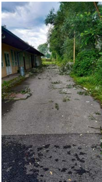
Spoušť před zubní ambulancí