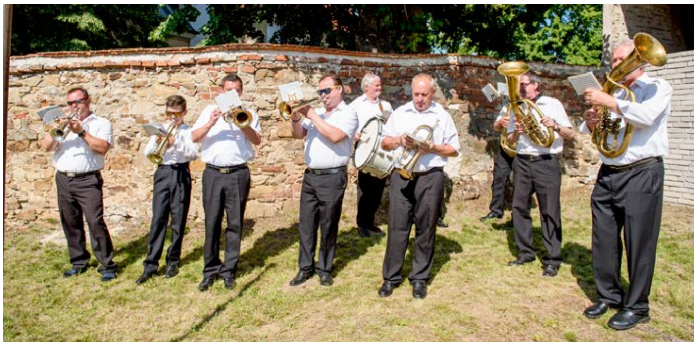
Rozloučit se přišla i DH Vlčnovjané