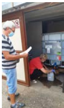
Dezinfekční roztok byl rozdáván občanům