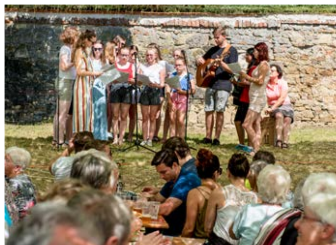
Vystoupení vlčnovské školy