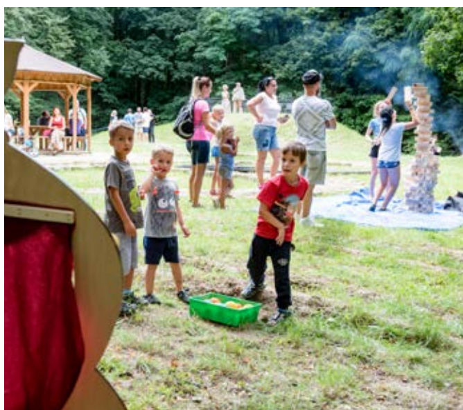
Pěší pouť z Vlčnova na Antoníněk