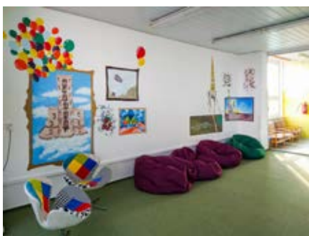
Nová relaxační místnost