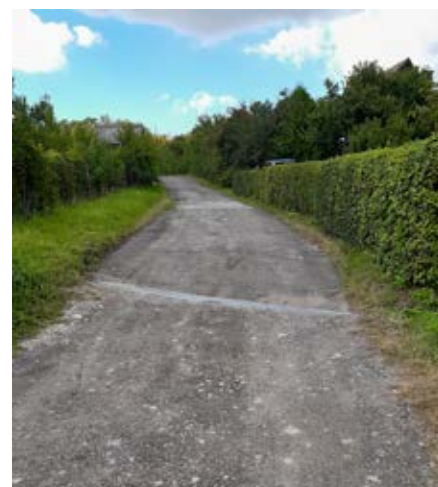
Opravená cesta ve vinohradech k lesu