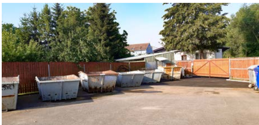
Rozšíření sběrného dvora – po realizaci